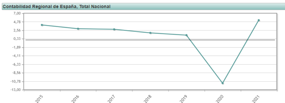
Ilustración 1. Tasa de crecimiento anual del PIB real per cápita.

Como se puede observar en la ilustración 1, el gráfico refleja la tasa de crecimiento anual del PIB en España real per cápita, esto es una medida económica que se utiliza para evaluar el nivel de desarrollo económico de un país y el bienestar promedio de su población. Esta medida toma en cuenta tanto el crecimiento económico (PIB real) como el tamaño de la población (per cápita), lo que permite analizar el nivel de producción económica por persona ajustado a la inflación. Como se puede ver, en el año de la pandemia (2020) el PIB decrece de manera brusca mientras que en 2021 se vuelve a recuperar.