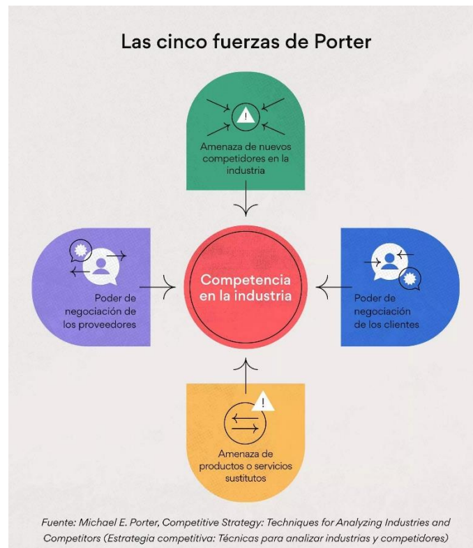
Ilustración 2. Las 5 fuerzas de PORTER