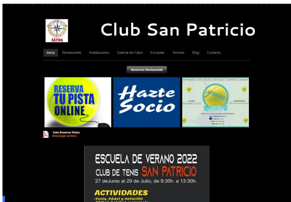
Ilustración 4. Página Web Club de Tenis San Patricio

Tal y como podemos ver en la Imagen 4, y centrándonos en el contenido de la página, más allá de los aspectos estéticos, es importante que tengamos en cuenta que todo se basa en cuatro partes fundamentales: reserva tu pista, hazte socio, reservas del restaurante e información variada sobre torneos, fotos, etc.