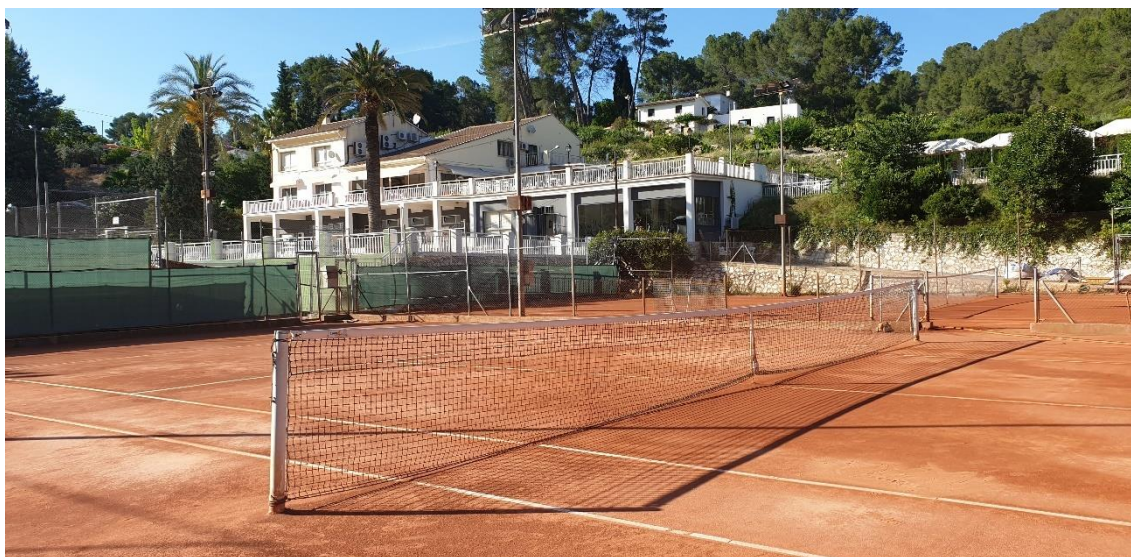
Ilustración 3. Pistas de tenis de la competencia, Club de Camp Bixquert.