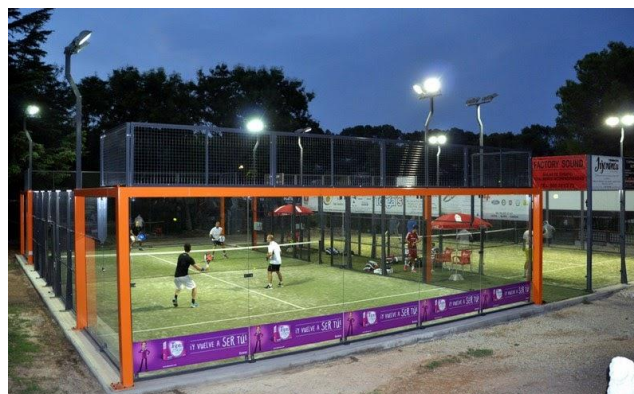
Ilustración 9. Pista de pádel del Club de Tenis San Patricio.

Se trata de un club de toda la vida, de pueblo y en el que todos los socios prácticamente se conocen, así que ahora hay que seguir incentivando a las nuevas generaciones o personas nuevas que vayan a vivir en Xátiva para darles a conocer el producto y hacer que les llame la atención probar el tenis o el pádel, que hoy en día es el hobby de mucha gente, de todas las edades.