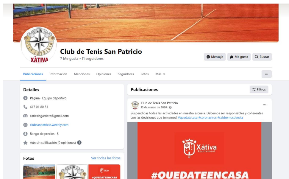
Ilustración 5. Perfil Facebook Club de Tennis San Patricio

Por otro lado, y terminando ya con la red social Facebook, cabe destacar que el perfil tiene únicamente 7 me gusta y 11 seguidores, por lo que, se puede confirmar que se trata de un perfil que está inutilizado.