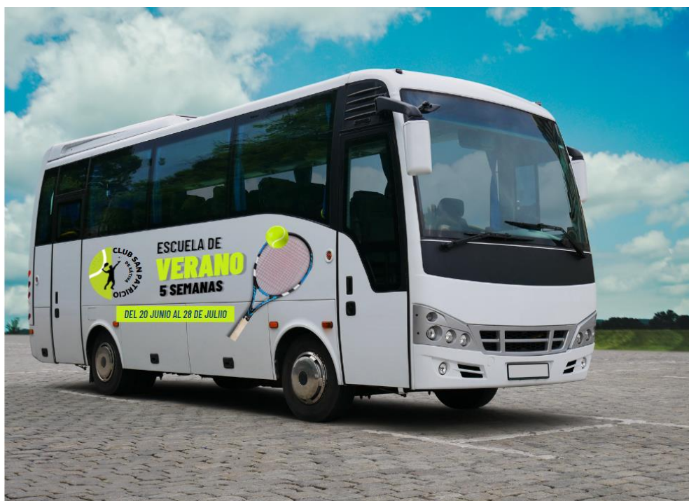
Ilustración 17. Publicidad escuela de verano en autobús.