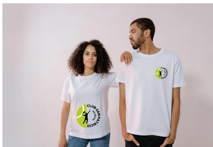
Il·lustració 14. Posibles camisetes bàsiques del club