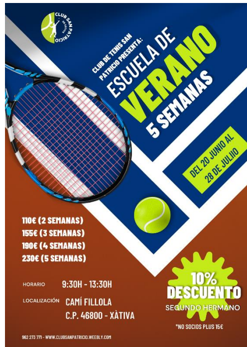
Ilustración 15. Posible cartel Escuela de Verano club