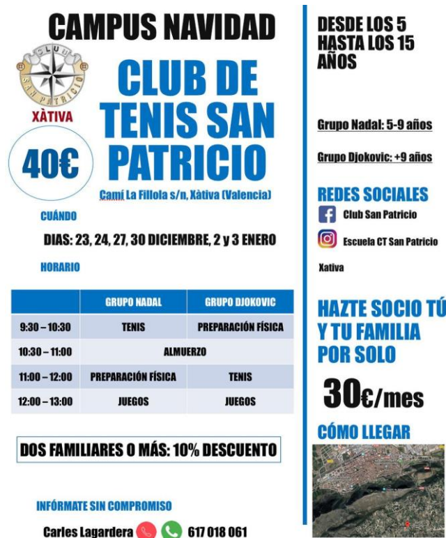
Ilustración 8. Ejemplo Cartel Publicitario Club Tennis San Patricio

Además, en todos los usos que vemos del logo se utiliza manteniendo el cuadro en fondo blanco tal y como vemos en la imagen 7, independientemente que el logo sea redondo e independientemente del uso que se le vaya a dar al mismo.