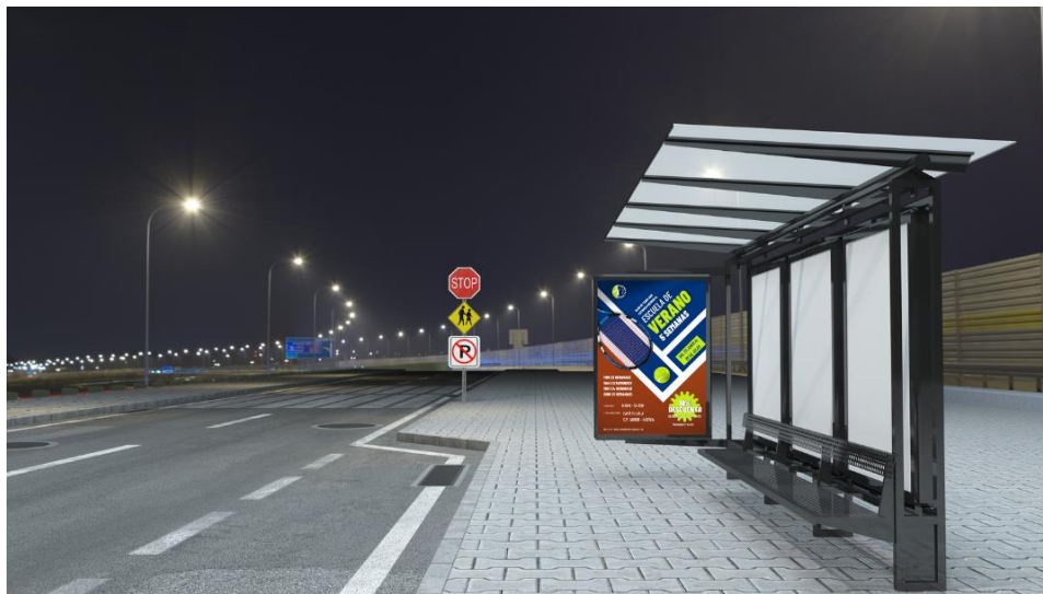
Ilustración 16. Cartel escuela de verano en Street Marketing (Mupi)