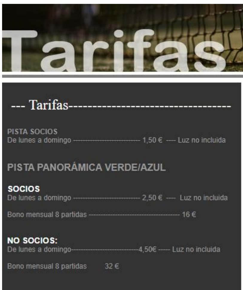
Ilustración 10. Tarifas reserva pistas Club San Patricio

En cuanto al precio, como su nombre indica, esta herramienta nos ayudará a ver los precios de la competencia, cuáles son los beneficios netos que se están sacando en el club, los descuentos que se están aplicando y/o pueden aplicarse, los gastos que se pueden reducir, etc.