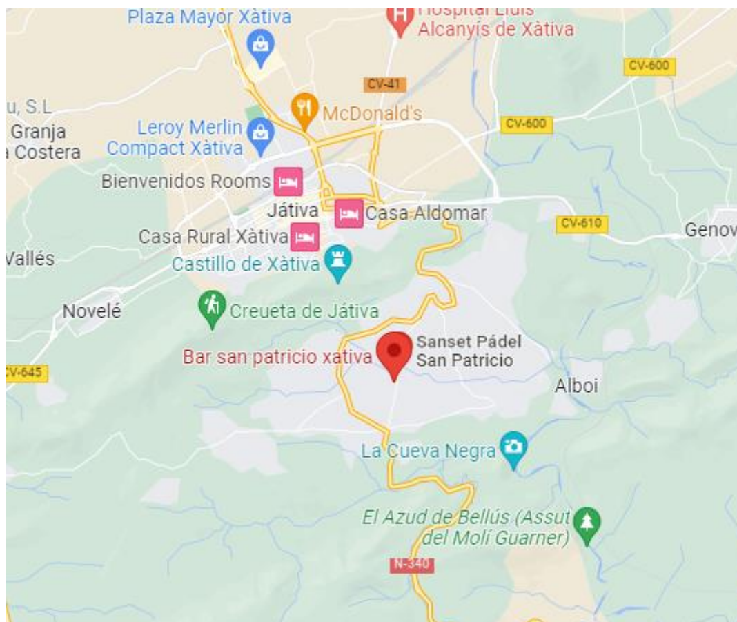
Ilustración 12. Localización del club en el mapa

Por último, el canal telefónico, pueden ser tanto llamadas como mensajes en WhatsApp para reservar pista o para pedir la información que el cliente solicite. Es uno de los canales más usados y prácticos.