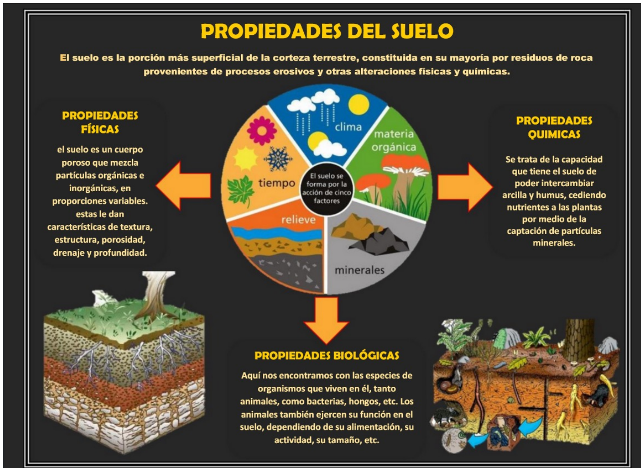
Figura 1. Propiedades del suelo