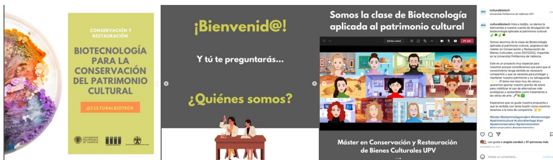
Fig. 2 Cuenta de Instagram, primer post.

Una vez creada la cuenta, el alumnado, por equipos eligió un artículo científico de alto impacto (indexado en JCR) en inglés de entre una lista de artículos puestos a su disposición por la profesora y crearon los posts de Instagram. Creando un total de 9 posts el primer curso y 6 posts el segundo curso. Para poder realizarlo, el alumnado tubo que leer los trabajos científicos, comprenderlos, resumirlos y extraer la información mas destacada para crear una infografía que divulgar en la red social. Así mismo prepararon entre 3 y 6 preguntas de examen tipo test que la profesora tubo en cuenta para la elaboración del examen final de la asignatura.