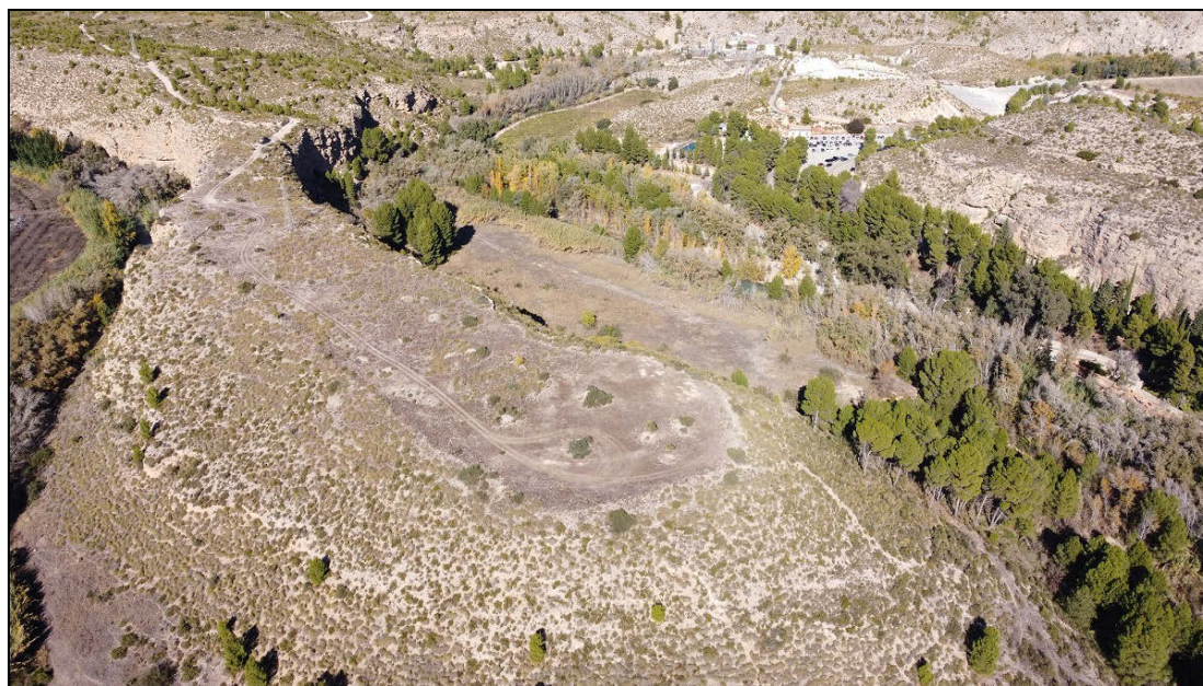
Fig. 2 Fotografía aérea del Cerro de la Virgen. Laderas occidental y meridional. R. Fernández Tristante (2021)

Por otra parte, los autores que han citado el yacimiento del Cerro de la Virgen, vinculado a priori con el propio Santuario de Ntra. Sra. de la Esperanza, se han caracterizado por tener un conocimiento fragmentario e inexacto del