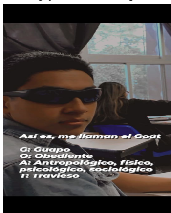
Fig. 1 Producto de clase primer año

Como ejemplo podemos plantear las siguientes imágenes, productos de clase, la primera (Fig. 1 Producto de clase primer año) de la asignatura de Dimensiones de la motricidad del primer año donde se les pide que de forma divertida planteen las dimensiones motrices planteadas, los resultados fueron diversos e interesantes, unos con mejor carga conceptual, y otros sorprendiendo con su habilidad para la creación del producto. Este grupo era considerado, en asamblea y en coordinación de licenciatura, como inquieto, motivo por el cual se nos asignó, para ver si lo “corregíamos”; en este momento, en su grado, es uno de los que más avances tiene respecto al plan de estudio, y son visibles sus avances y progresos como futuros docentes, incluso con mejor dominio del bagaje básico de su profesión.