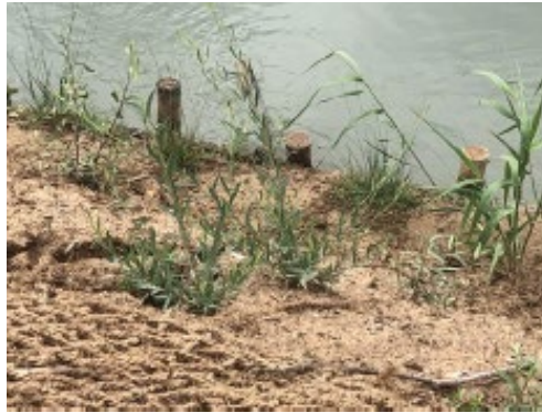
Imagen 2. Ramas junto con redes de coco para estabilización de suelos.