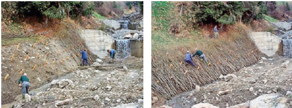
Imagen 4. Funciones de control de erosión y estabilización de suelos.

En función de los materiales éstas se agrupan en (CEDEX, 2011):