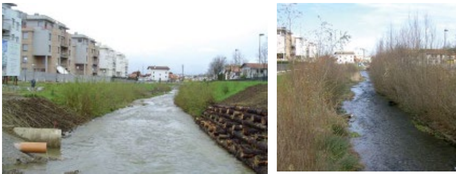
Imagen 5. Técnica de muro Krainer en el río Artia (Irún). Izquierda recién construido y derecha 4 años más tarde.