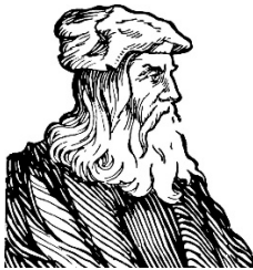
Leonardo da Vinci

Por todo ello, la bioingeniería se ha convertido en una moderna herramienta de diseño que es clave en la aplicación de Soluciones Basadas en la Naturaleza.