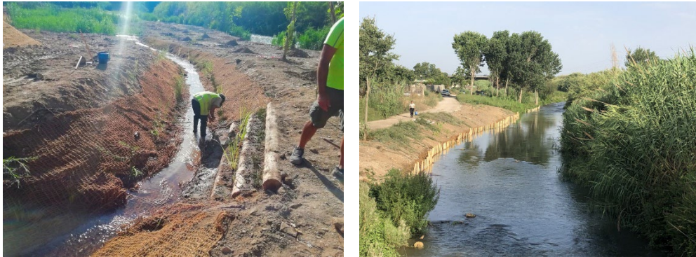
Imagen 3. Trabajos de bioingeniería en Manises (Valencia).