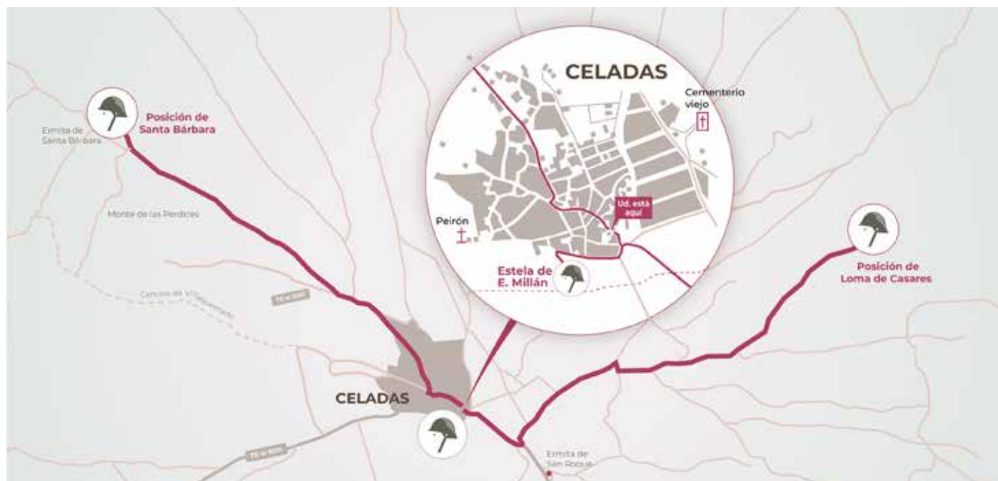
1. Mapa de situación de ambas posiciones respecto al municipio de Celadas (Teruel, España). 1. Location map of both positions and the municipality of Celadas (Teruel, Spain).