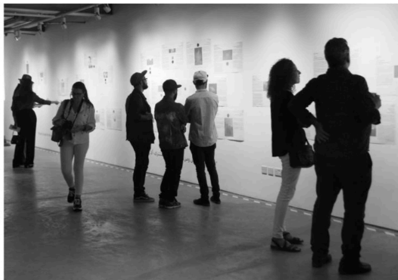
Figure # 12. "What about IN/OUT'19". Inaugural exhibition IN/OUT'19, 16 Oct 2019.

Temas sociales, económicos y ambientales se plantean desde lo artístico, para cuestionarse en la esfera pública de los distritos Jabal Al-Weibdeh y el distrito de Abdali, disponibles al público durante todo el período del festival.