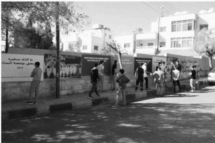
Figure # 35. Mau Monleón Pradas, working with students