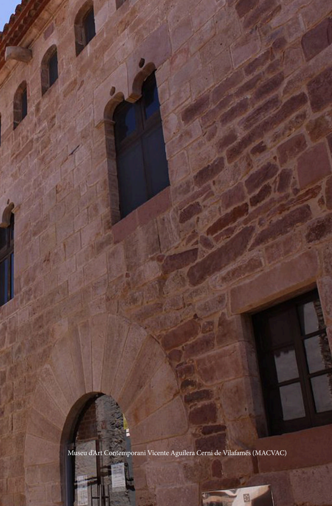
Museu d'Art Contemporani Vicente Aguilera Cerni de Vilafamés (MACVAC)