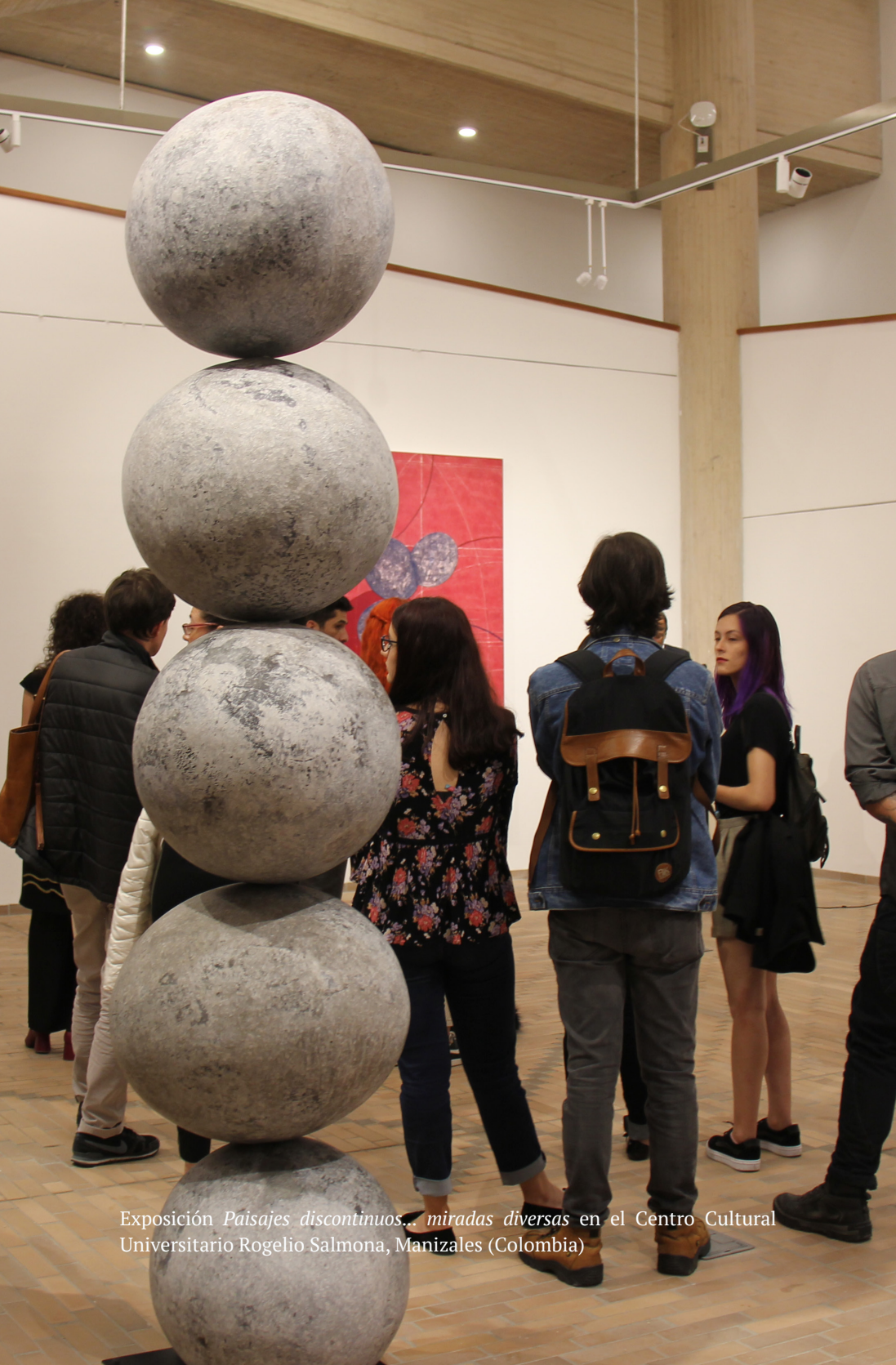
Exposición Paisajes discontinuos... miradas diversas en el Centro Cultural Universitario Rogelio Salmona, Manizales (Colombia)