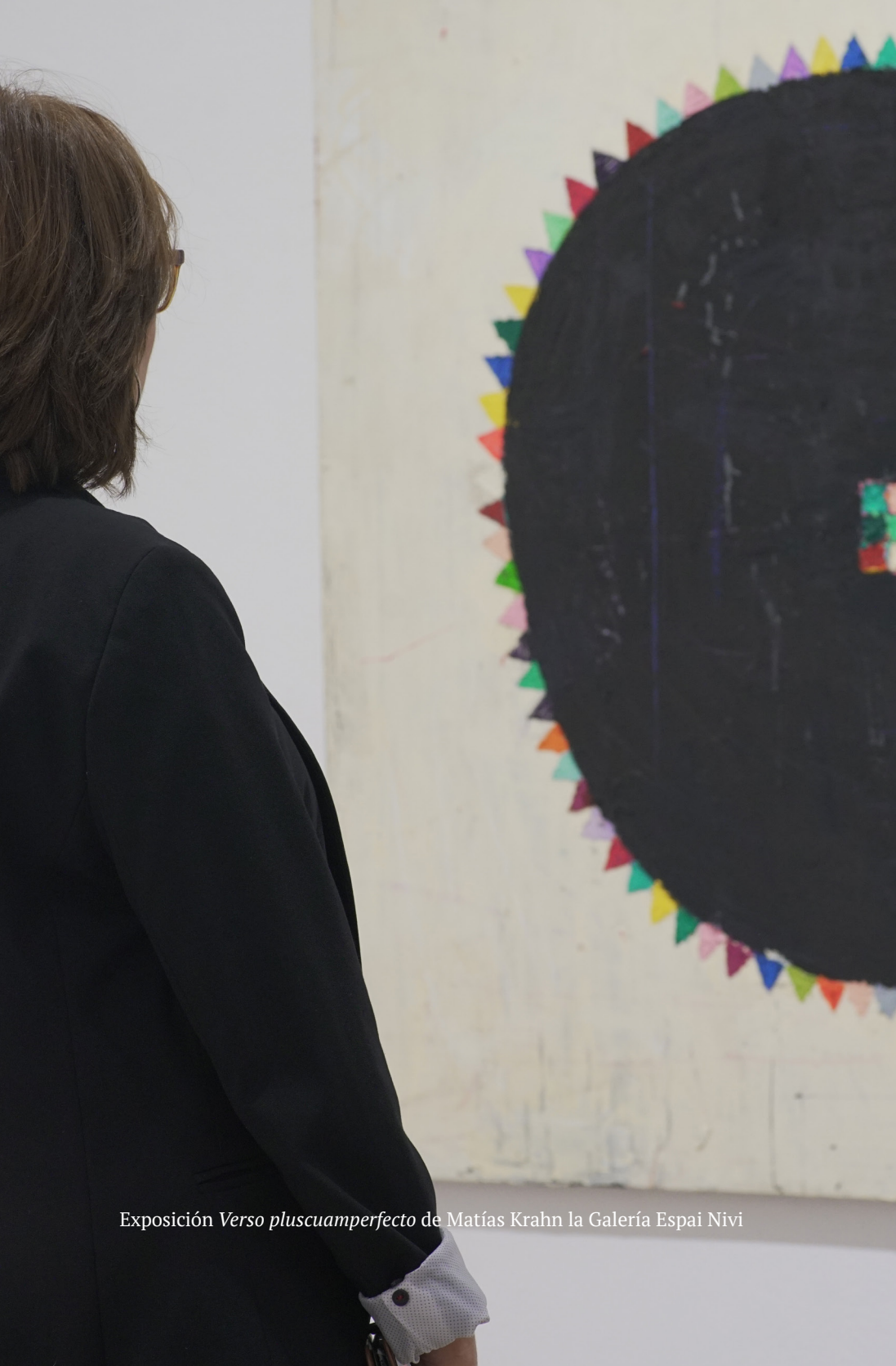
Exposición Verso pluscuamperfecto de Matías Krahn la Galería Espai Nivi