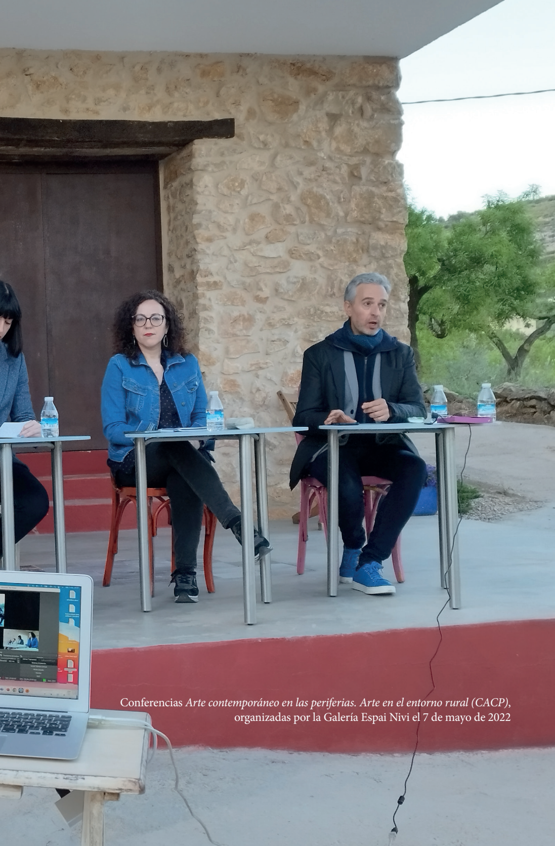
Conferencias Arte contemporáneo en las periferias. Arte en el entorno rural (CACP) , organizadas por la Galería Espai Nivi el 7 de mayo de 2022