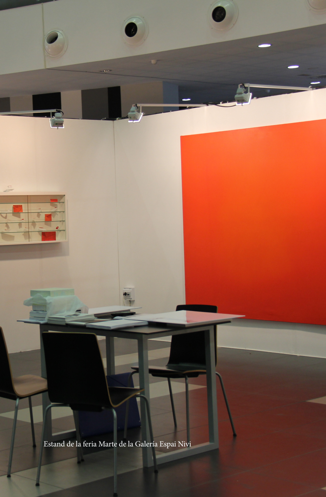
Estand de la feria Marte de la Galería Espai Nívi