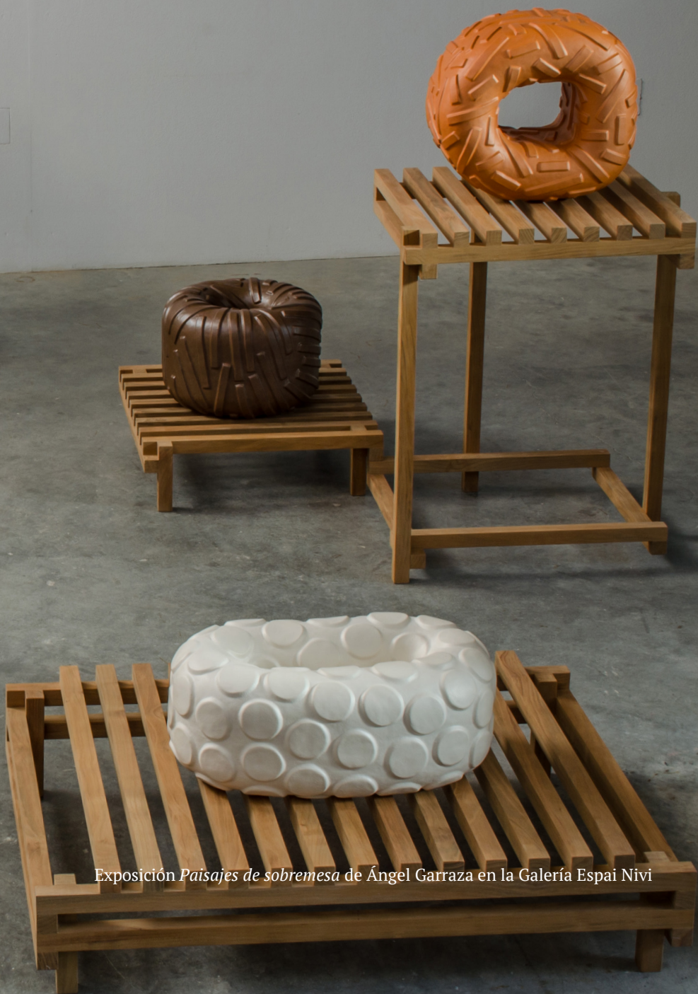
Exposición Paisajes de sobremesa de Ángel Garraza en la Galería Espai Nívi