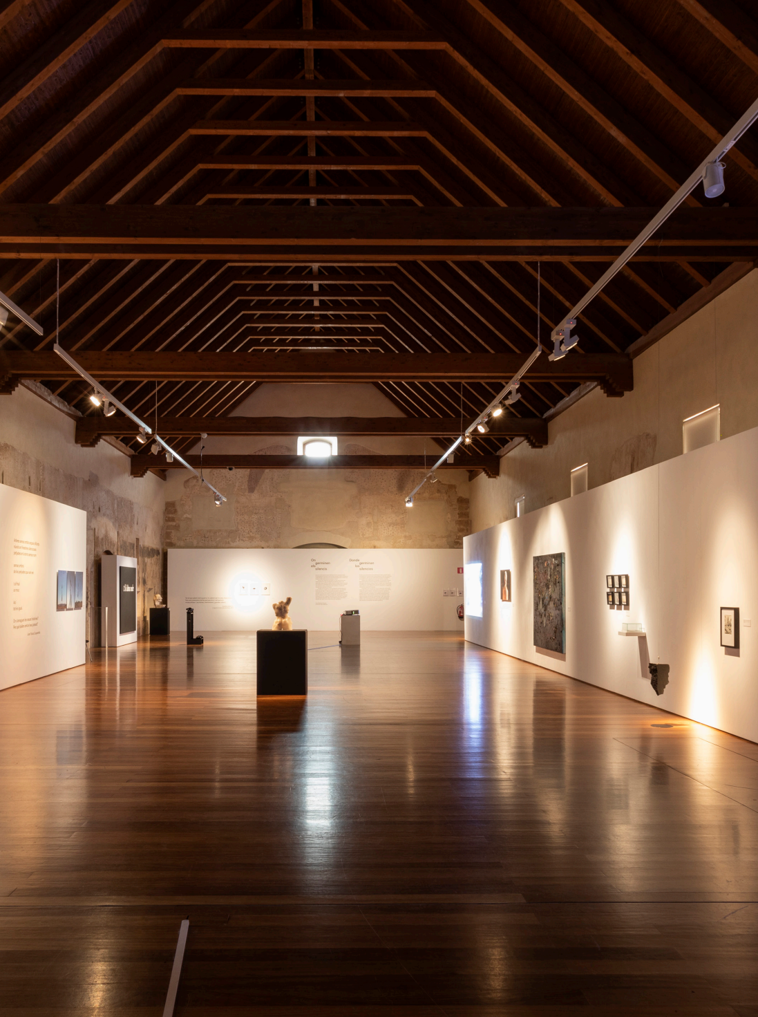
Exposició On germinen els silencis en el Centre del Carme Cultura Contemporània