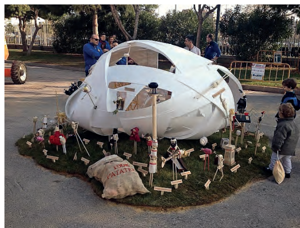
Falla Infantil UPV 2017 Equipo Tres en Raya