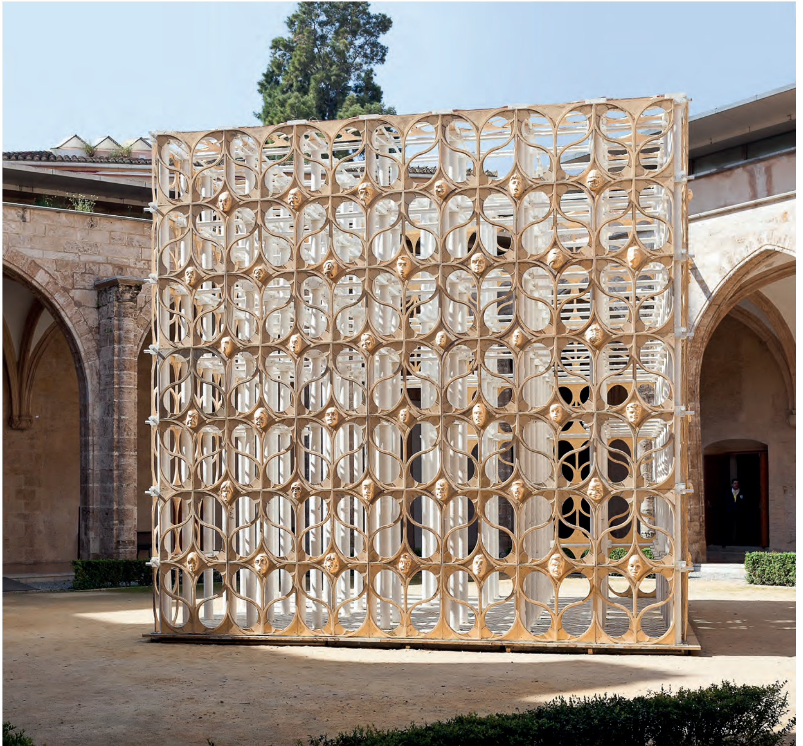
Falla CCCC 2017 "Renaixement", Burning Man Miguel Arraiz / David Moreno