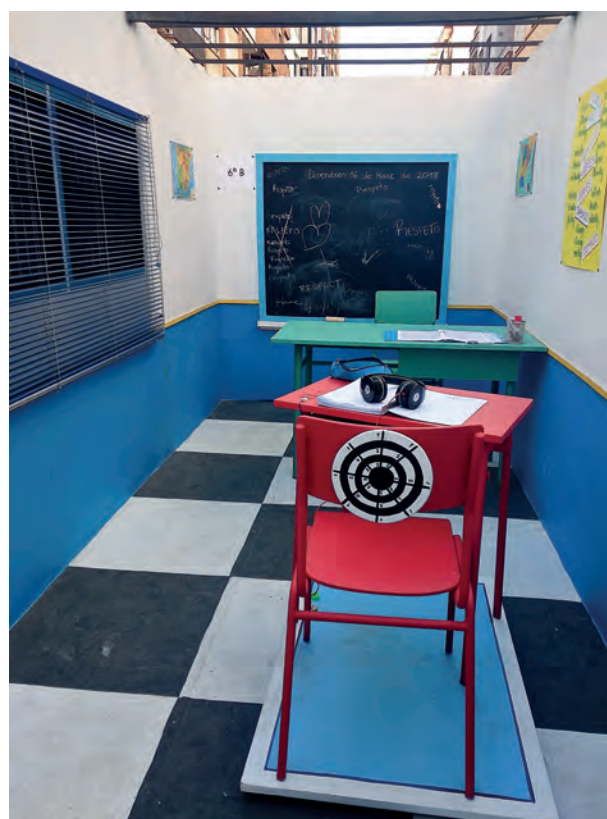
Falla Micer Rabasa-Poeta Maragall 2018 Amparo Ordáz / Juan Ruíz Recio

La idea fundamental del respeto como bandera de la innovación hace posible que el espíritu de rebeldía con