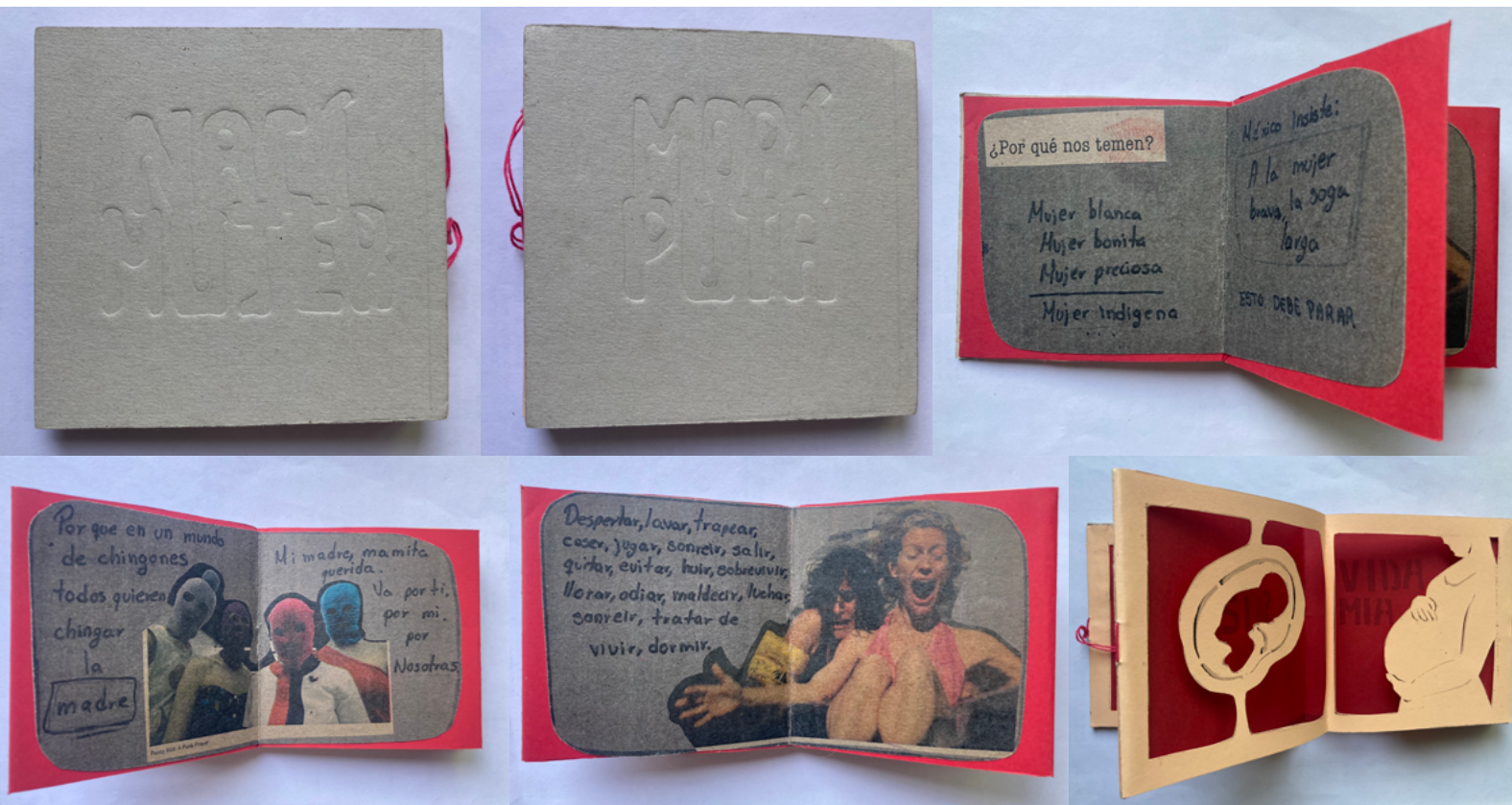
Figura 6. Serie de imágenes del libro-arte Nací Mujer / Morí Puta de Casandra Romero, 2017.

que provoca que las letras o elementos queden hundidos en la superficie. Esto crea un efecto de relieve negativo, ya que las áreas alrededor de las letras son elevadas y las propias letras están hundidas. Las letras no tienen color alguno, se mantiene natural al cartón gris grueso seleccionado por la artista, la composición es centrada, cuadrada, en caja alta y con un tracking e interlineado apretado que permite la lectura a pesar de la unión. La obra no solo tiene escritura en relieve, también tiene quirografía en su interior que lo vuelve más personal, al ser un libro de tipo carrusel y concertina en uno de sus lados expresa perspectivas feministas de la artista y problemas por los que pasa una mujer en territorio mexicano, justificando la muerte por ser una puta, por vestir de manera inapropiada, por buscárselo. Los textos quirográficos se apoyan del collage y de imágenes simbólicas para la mujer elaboradas en cut-out como un óvulo, un feto, un vientre, una virgen guadalupana, un sello feminista, que a su vez dejan ver a través del fondo carrusel otros textos, sumando constantemente a la interacción texto-imagen del lector.