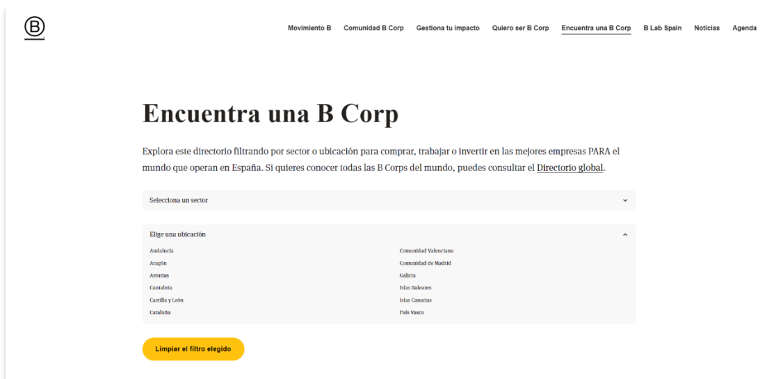
Imagen 4. Directorio de empresas certificadas como B Corp en España