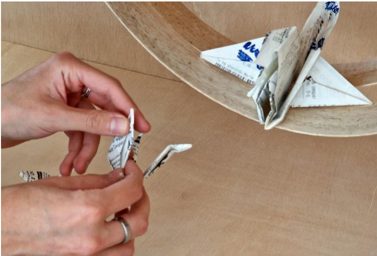
Imagen 3. Manos jugando con un ticket.

Pero como acabamos de mencionar, no queremos jugar con reglas establecidas ni con un kit de materiales “cerrados”, queremos jugar libremente y sin miedo. En los últimos años se ha extendido un fenómeno que, aunque no se relacione directamente con el arte contemporáneo, tiene ciertas conexiones con él. Nos referimos al fenómeno del do it yourself o DIY, movimiento asociado a la idea de hacer las cosas por uno mismo, evitando la compra, fomentando la creatividad y promoviendo el reciclaje y la fabricación con las propias manos. Pero Marina Garcés (2019, pp. 161-162), en su libro Fuera de clase: textos de filosofía de guerrilla , se muestra convencida de que el fenómeno del do it yourself , en muchos casos, nos ofrece una experiencia simulada de autosuficiencia que nos convierte en más dependientes. Afirma que vivimos cada vez más la vida en un kit y que los niños entienden hacer manualidades comprando juegos que comportan todas las piezas necesarias (materiales y herramientas) para construir cualquier cosa, desapareciendo la capacidad de descubrir en otros materiales la posibilidad de convertirse en otras cosas. En palabras de Marina Garcés, la creatividad o imaginación en