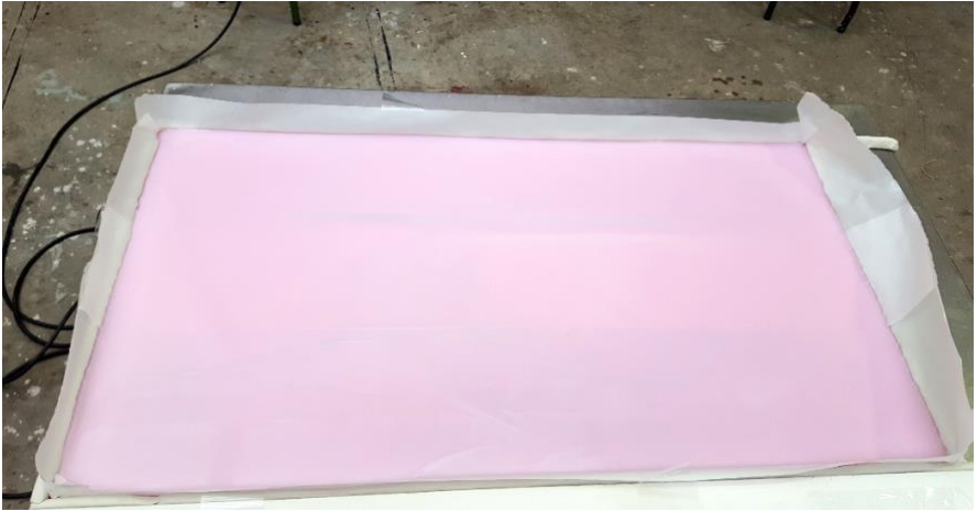
Imagen 4. Bioplástico en proceso de secado.

Hace años que la materia se ha vuelto fundamental en la concepción y creación de obras artísticas. Pero con los recursos naturales del planeta al límite y una sociedad de consumo que produce desperdicios en enormes cantidades, muchos artistas y diseñadores están investigando y desarrollando nuevos materiales acorde con las necesidades y retos del siglo XXI.