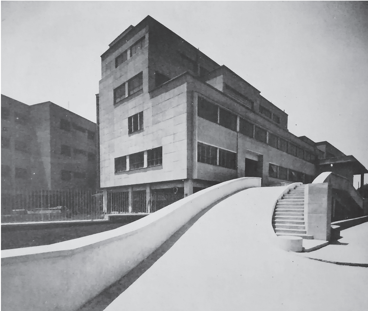
Figura 7. Sin título, c.a. 1948. Fotografía de Lola Álvarez Bravo de la rampa de acceso del Instituto Nacional de Cardiología (1944, obra de José Villagrán).