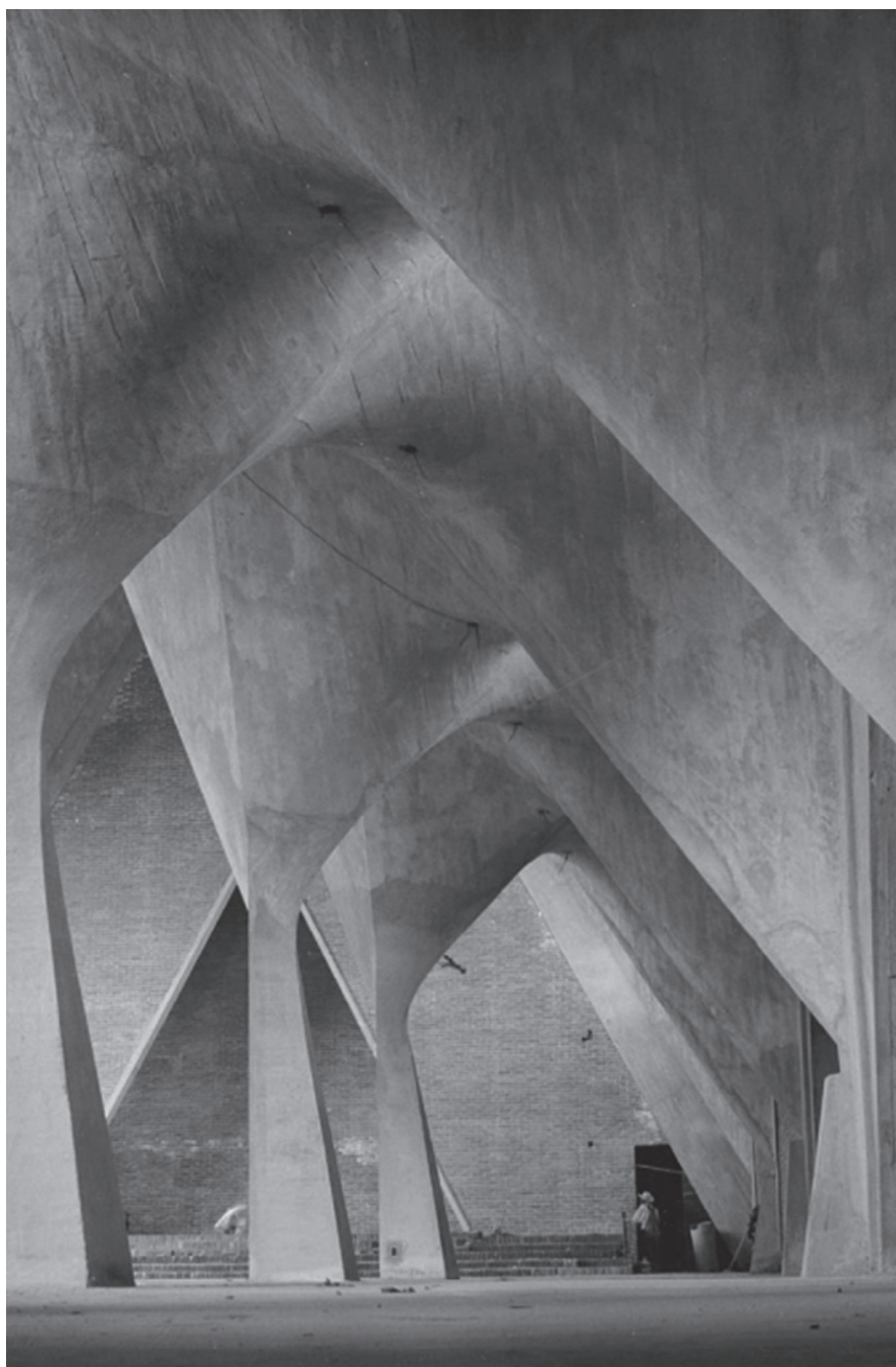
Figura 3. Sin título, 1954. Fotografía de Lola Álvarez Bravo del interior en obras de la Iglesia de la Medalla de la Virgen Milagrosa (1955, proyecto del arquitecto Félix Candela).