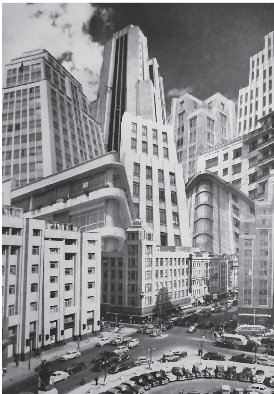
Figura 6. La capital de la República mexicana (1946). Foto-mural de Lola Álvarez Bravo.