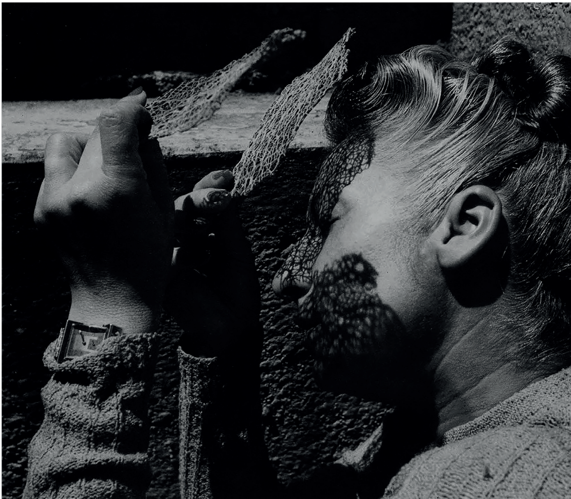
Figura 1. Autorretrato , c.a. 1950. Autorretrato de Lola Álvarez Bravo.