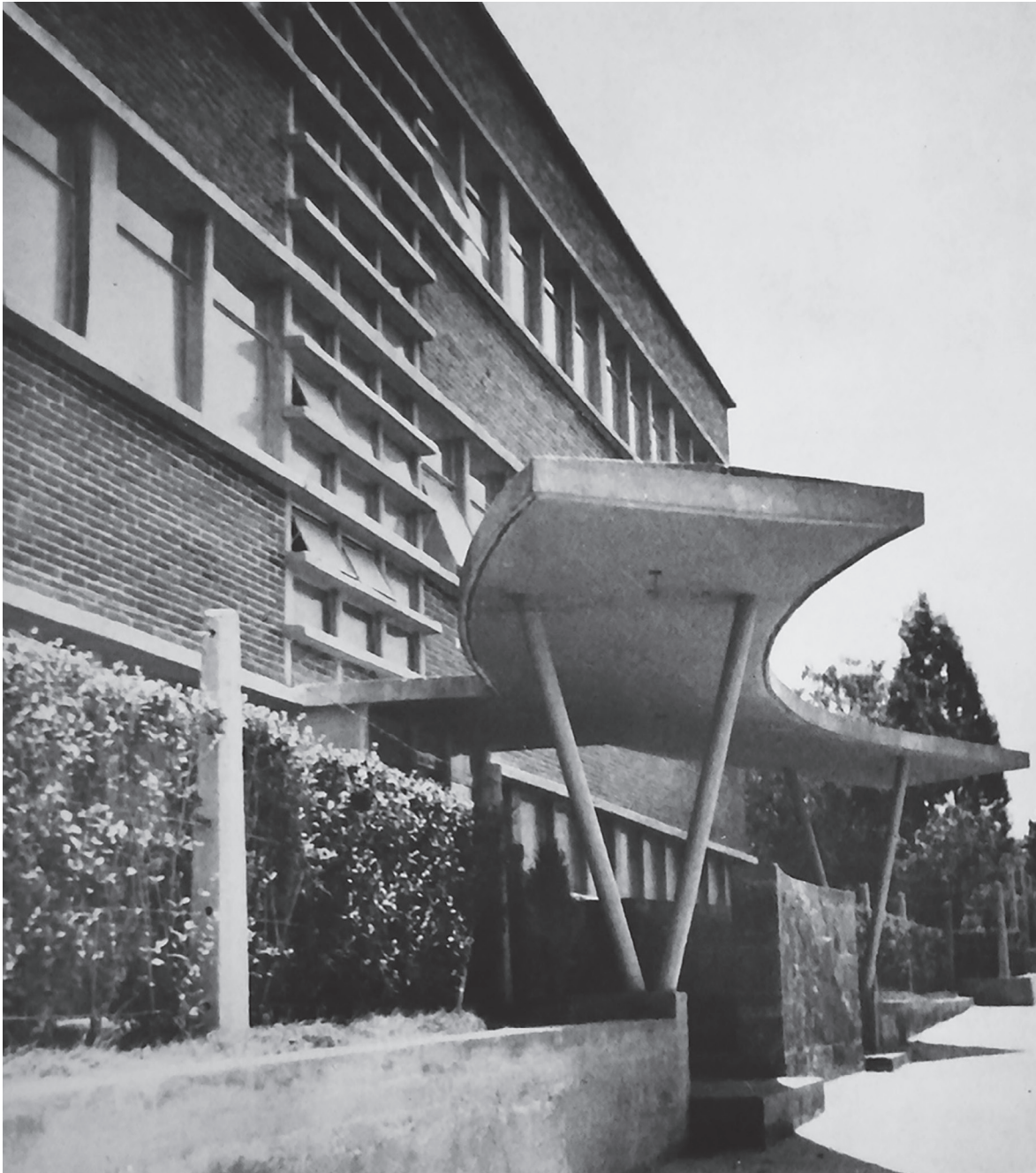
Figura 4. Sin título, 1948. Fotografía de Lola Álvarez Bravo del acceso al Centro de Asistencia Materno-Infantil Maximino Ávila Camacho (1948, proyecto del arquitecto Enrique de la Mora).