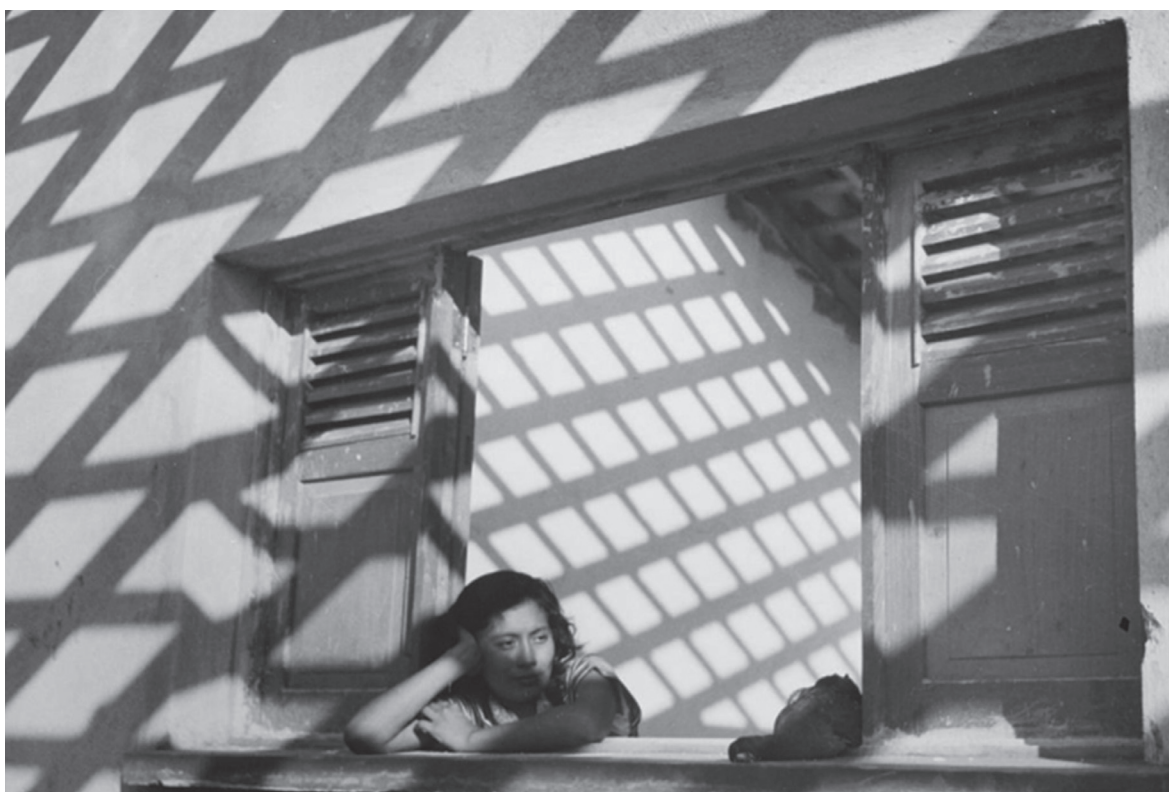
Figura 2. En su propia cárcel , c.a. 1950. Fotografía de Lola Álvarez Bravo.