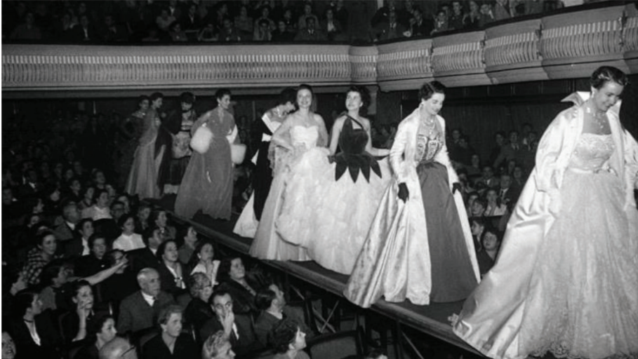
Figura 6. Desfile de moda organizado con motivo de la festividad de Santa Lucía