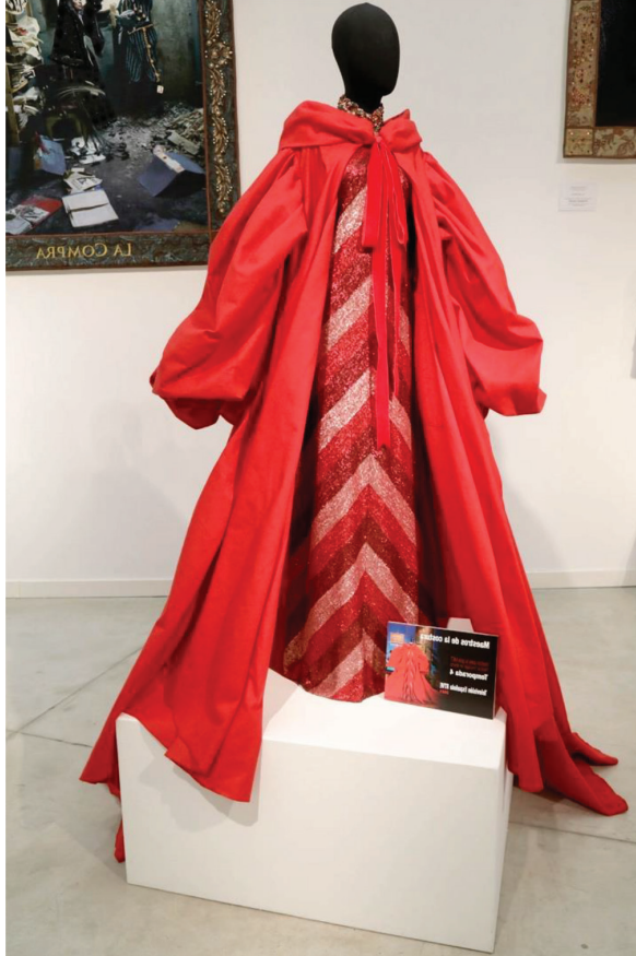
Figura 5. Traje elaborado en Maestros de la Costura