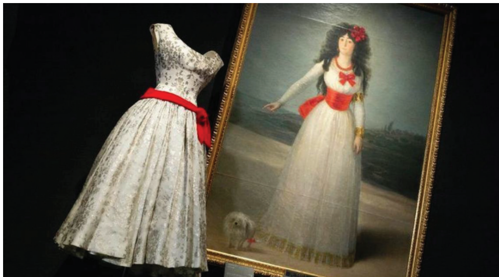
Figura 3. Balenciaga y la pintura española