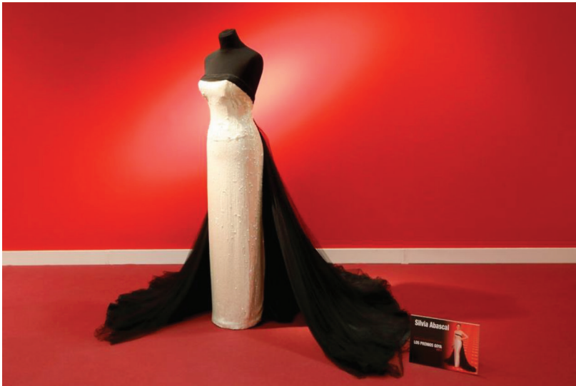
Figura 4. Traje de Silvia Abascal en los Premios Goya 2011

de Teatro Clásico, el Centro Dramático Nacional o el Teatro de La Abadía. La exhibición incluyó también el traje de boda utilizado en la película El lobo de Wall Street (2013), el vestido que usó Penélope Cruz en Manolete (2008), el traje de novia que llevó Clara Lago en el filme Ocho apellidos vascos (2014), así como algunos trajes utilizados por la cantante Marta Sánchez en sus múltiples giras y un par de vestidos lucidos por Anne Igartiburu en las galas televisivas con motivo de la nochevieja.