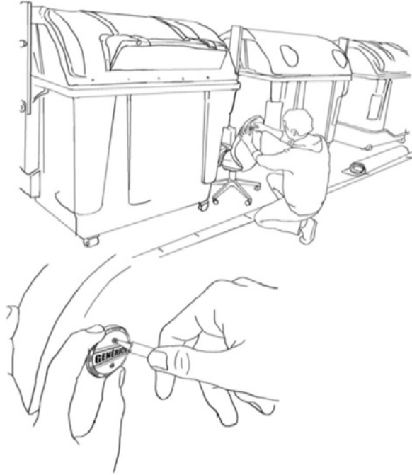
Fig. 9. Dibujo sobre el proceso de seriación de los objetos encontrados.

No sólo se podía recoger un objeto que podía ser de utilidad en algún lugar de casa, sino que los transeúntes se podían llevar una obra de arte encontrada, marcada y regalada para transformar la función del arte como mercancía, eliminando la compra venta y permitiendo su accesibilidad y disfrute. De este modo, se transformaba el proceso de adquisición en algo cíclico, accesible y cambiante fuera del modelo monetario cerrado, elitista e individual. Una propuesta en términos de cultura libre (Lessig 2005) asociada a los procesos de creación, producción, distribución y consumo.