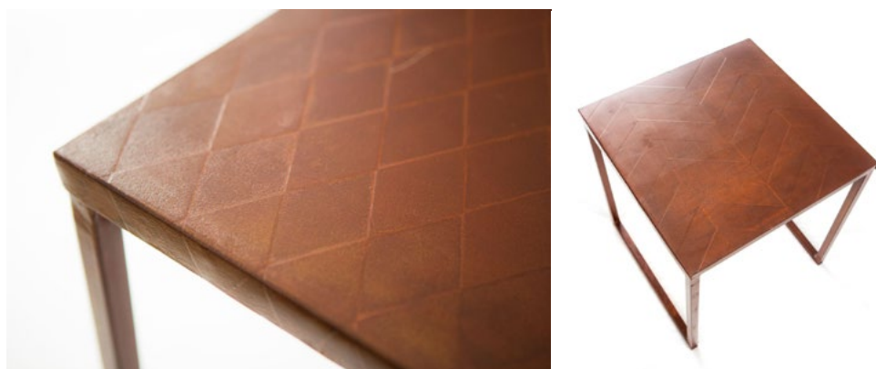
Fig. 3 y 4. Corten Nightstands. Planchas de acero corten y estructura de hierro.

La aproximación a los procesos de manipulado de estos materiales mediante el corte y soldadura, la serigrafía con barniz de aguafuerte y el gofrado y plegado del metal, aportan multitud de ideas para próximas experimentaciones artísticas y procesuales; los resultados ejemplifican perfectamente las posibilidades que nos ofrece este proceso metodológico para la obtención de texturas sobre el metal.