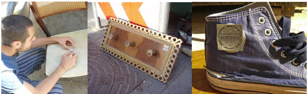
Fig. 10, 11 y 12. Proceso de seriación y objetos encontrados.

No sólo se podía recoger un objeto que podía ser de utilidad en algún lugar de casa, sino que los transeúntes se podían llevar una obra de arte encontrada, marcada y regalada para transformar la función del arte como mercancía, eliminando la compra venta y permitiendo su accesibilidad y disfrute. De este modo, se transformaba el proceso de adquisición en algo cíclico, accesible y cambiante fuera del modelo monetario cerrado, elitista e individual. Una propuesta en términos de cultura libre (Lessig 2005) asociada a los procesos de creación, producción, distribución y consumo.