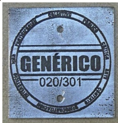
Fig. 5, 6, 7 y 8. Ejemplo del proceso de producción del logo del colectivo y la pieza definitiva con el número de serie, en este caso "020/301".

Este proyecto, enmarcado como comentábamos en el concepto de la muerte del autor se insertó dentro de un colectivo artístico denominado "Genérico" donde las intervenciones que se proponían giraban alrededor de estas ideas: política, crítica, arte, democratización, intersticio, idea, colectivo, vida, etc.