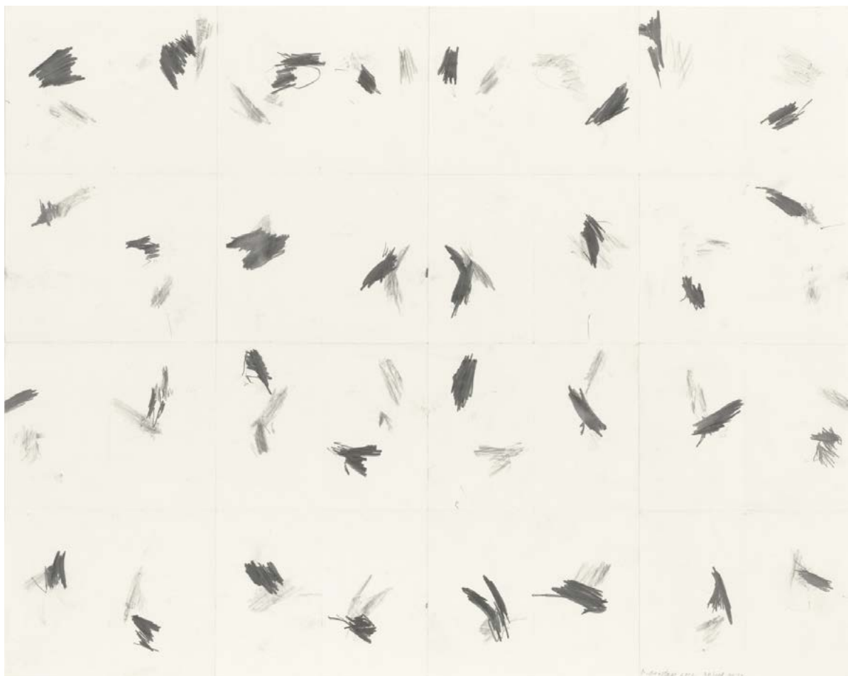
Figura 4. William Anastasi: Pocket Drawings (2002). Grafito sobre papel de seda (57.2 × 72.4 cm).

vacío espiritual generado por el mundo consumista. Se trata de una corriente muy amplia, como se puede comprobar en sitios web como Walking the land , Walking artist networks , Rethinking cities o Transition Town Movement . Son movimientos artísticos, urbanos y/o activistas que organizan prácticas de caminar y dibujar como intervención positiva frente a la crisis ambiental. El objetivo de sus acciones es, a través de los paseos en los que los participantes están invitados a dibujar o escribir su percepción del paisaje, aumentar la conciencia de pertenencia a un lugar, fomentar el disfrute estético del paisaje natural, la biodiversidad y los productos locales fruto de la tierra. De igual modo la vigencia de esta nueva actitud queda constatada por las exposiciones relacionadas directamente con el tema como Walking And Thinking and Walking en el Louisiana Art Museum de Dinamarca (1996), Walk Ways (Surrey, Portland, Halifax, Austin, Tampa, Reading, 1998-2004),