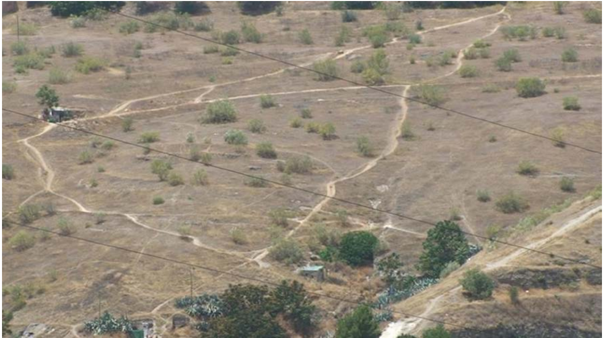
Figura 6. Caminos-dibujos (Granada, 2016).

entendido como huella corporal, sino que va más allá y alcanza un profundo significado filosófico. El ser humano se muestra desnudo de adornos, solo con su presencia corporal, en su unicidad y transitoriedad.