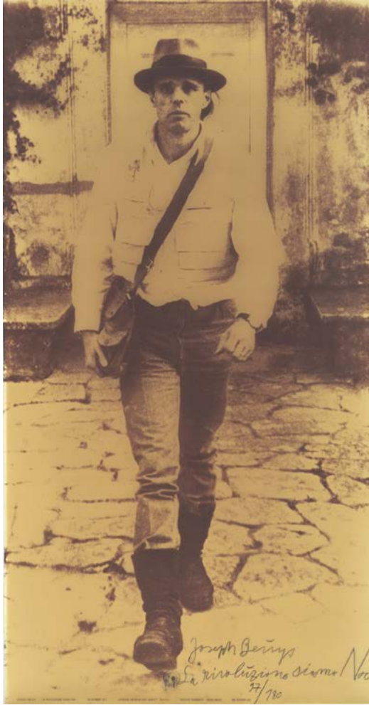
Figura 9. Joseph Beuys, We are the Revolution - La Rivoluzione siamo noi (1972). Diazotipo con añadidos de sellos de caucho (191,5 x 100,7 cm).

el aspecto revolucionario del caminar, así como lo expresa el famoso cartel de Joseph Beuys We are the revolution 9 (Figura 9) donde aparece el artista simplemente caminando.