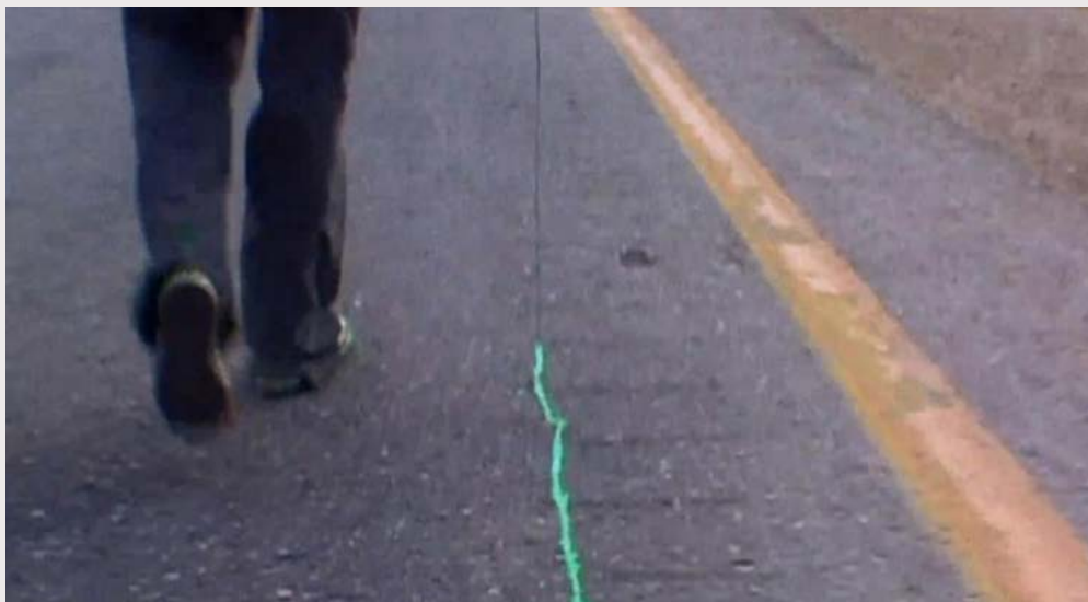
Figura 7. Francis Alÿs, The Green Line (2004).