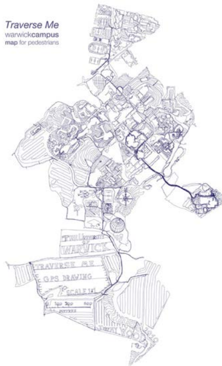
Figura 2. Fiona Robinson: These are the paths we did not take (2008). Estos son los caminos que no cogimos . Geso, óleo y carboncillo sobre tela (102 x 77 cm).