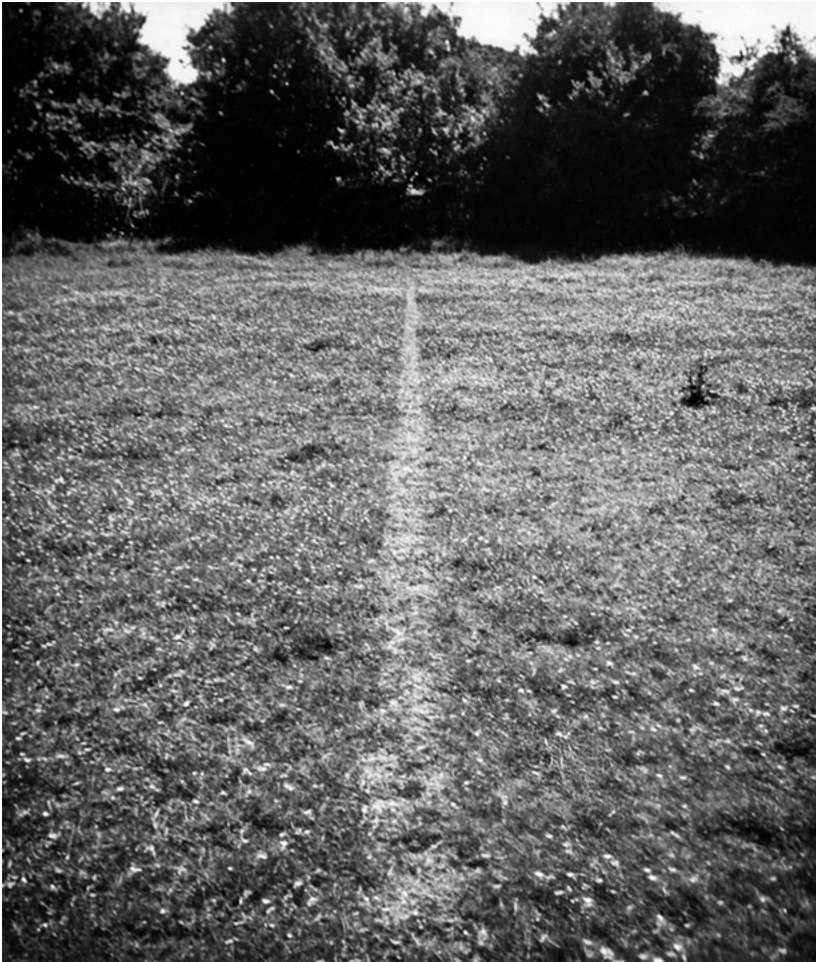
Figura 5. Richard Long. A line made by walking (1967). (Fuente: http://www.richardlong.org/Sculptures/2011sculptures/linewalking.html )

Walk on Exhibition (Sunderland, 2013), por la creación de novedosos museos como el Museum of Walking existente tanto en Inglaterra (Londres, 2007) como en EEUU (Arizona, 2017), y por la proliferación de centros de Arte y Naturaleza en todo el mundo (citamos, por poner sólo algunos ejemplos en España, la Fundación Beulas en Huesca, el Cerro Gallinero en Ávila, la Fundación NMAC Montanmedio Arte Contemporáneo en Cádiz y ValdelArte, Centro de Arte Contemporáneo Medioambiental en Valdelarco en Sierra de Aracena, Huelva).