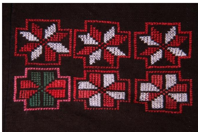
Imagen 21 loto catágico de Miao

El pueblo Miao se encuentra en una región alpina relativamente remota con pendientes empinadas y una alta cobertura forestal. Los patrones comunes de las plantas de bordado de Miao son el anís estrellado, el loto catágico, etc., también a través de la exageración y la deformación de las plantas, etc., para extraer un patrón simple, lo que significa que la gente local aboga por el espíritu de la naturaleza.