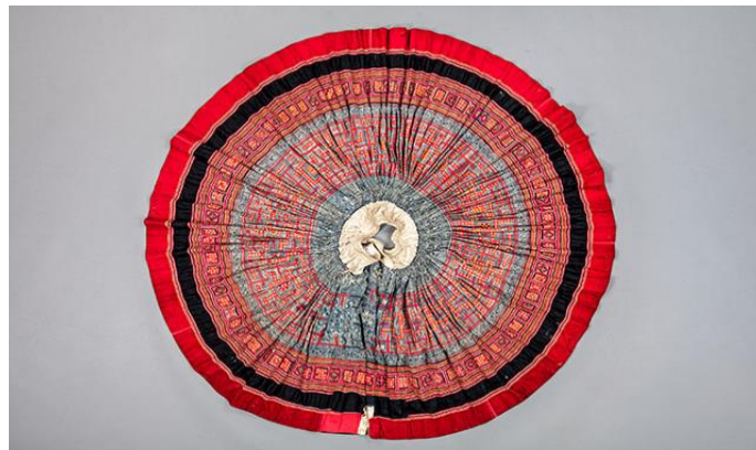
Imagen 6 Falda de Miao