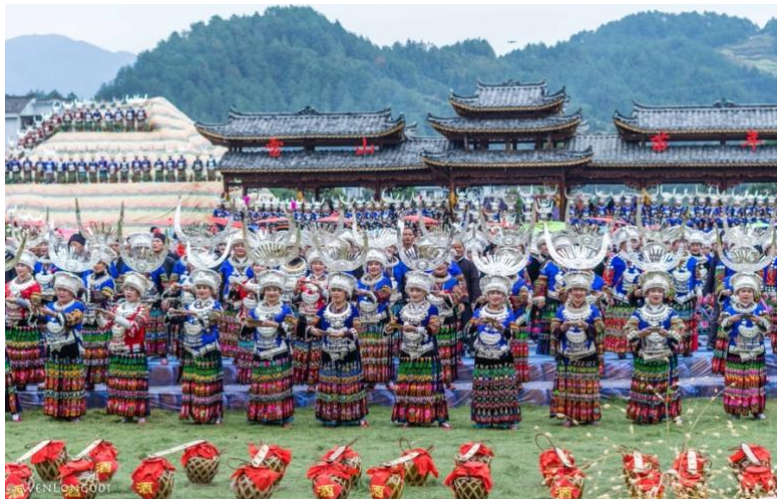
Imagen 11 Año Miao