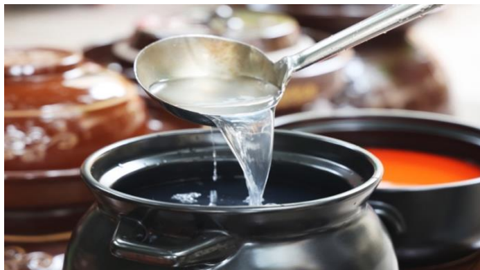
Imagen 10 Caldo agrio de Miao