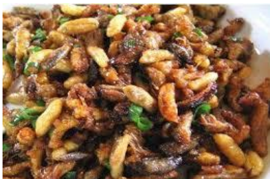
Imagen 7 Abejas fritas