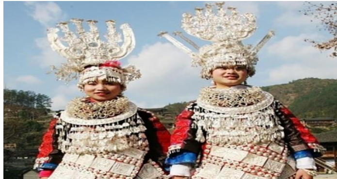
Imagen 4 Los Adornos de Miao