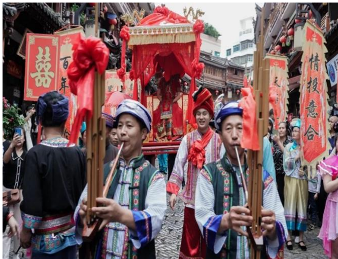
Imagen 12 Festival 8 de abril