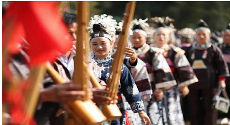
Imagen 14 Festival de espárragos bailando