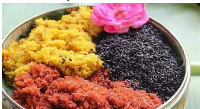
Imagen 8 Arroz de tres colores