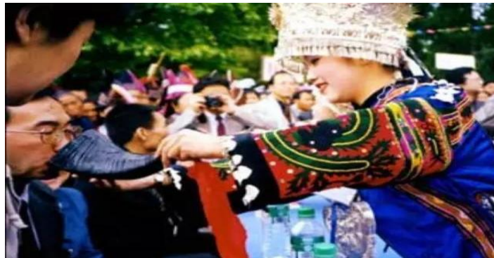
Imagen 9 Vino de barricada