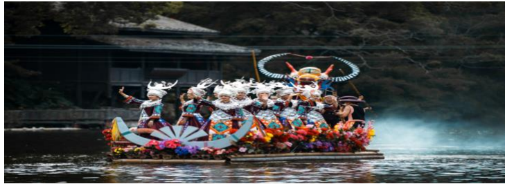
Imagen 16 El Festival del Bote del Dragón

Fuente: http://www.olympic.cn/museum/tvjypt/2020/0624/334173.html