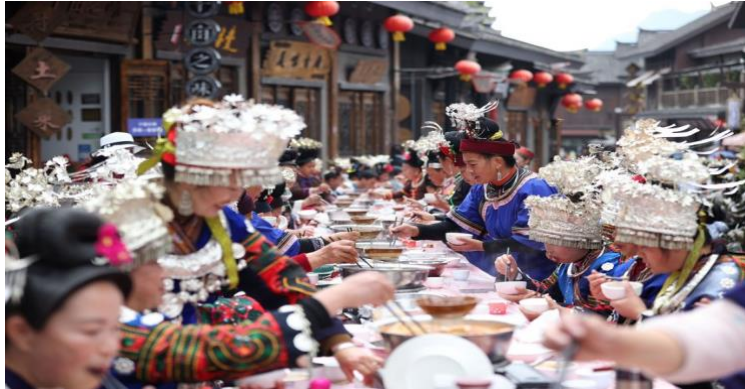
Imagen 3 El banquete de mesa larga