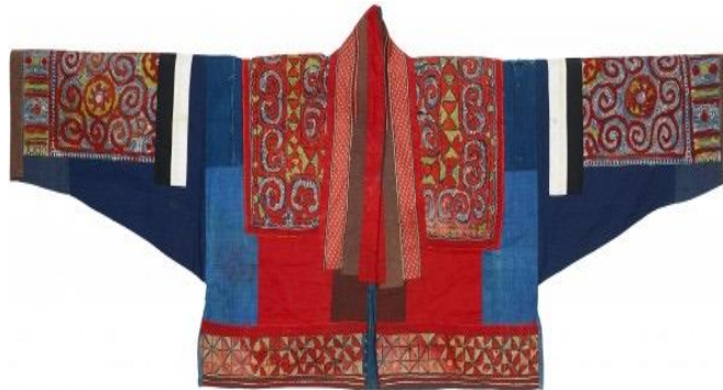
Imagen 5 Tipo de camiseta tradicional de mujer