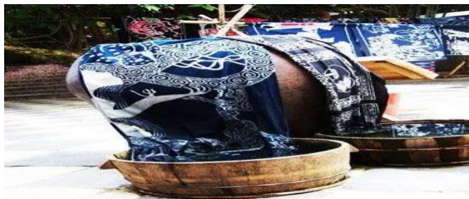
Imagen 17 Teñido natural de plantas