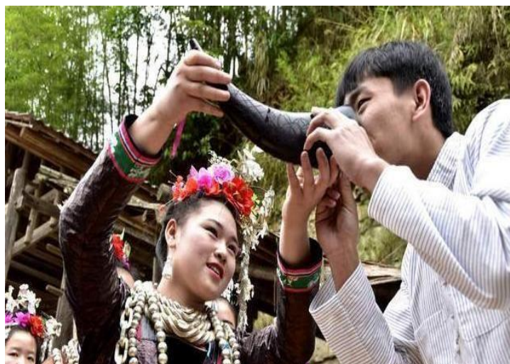
Imagen 2 los invitados beben vino de barricada