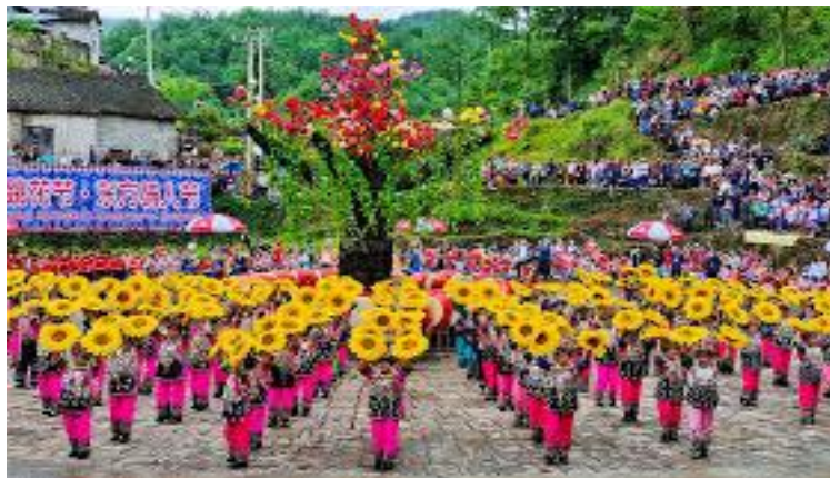
Imagen 13 Festival de danza de los Flores