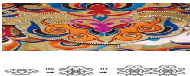
Imagen 18 Descomposición del patrón de mariposa de bordado Miao