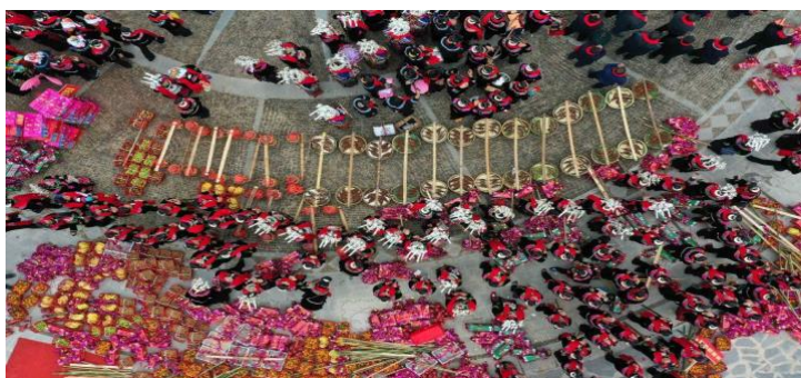
Imagen 15 Festival Tibetano del Tambor Miao