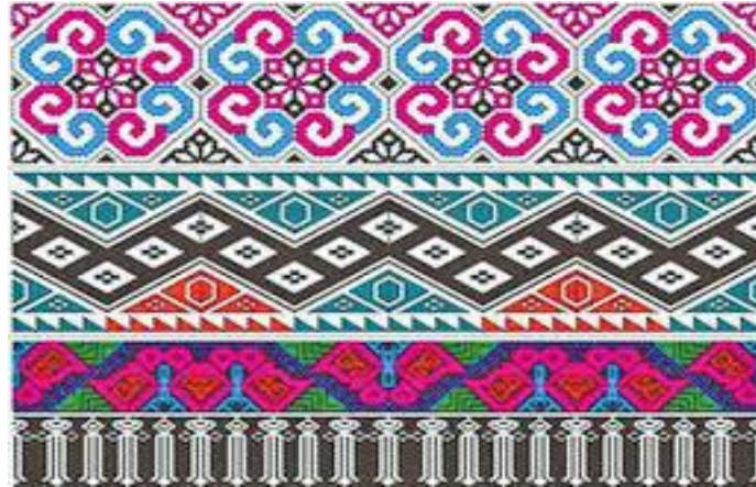
Imagen 22 Patrones de Geométricos