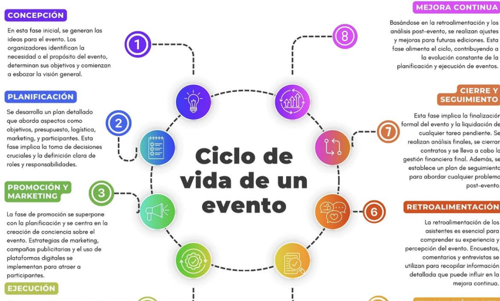
Figura 2 Las principales fases del ciclo de vida de un evento.

El tercero es el Enfoque de Ciclo de Vida del Evento. Este método se utiliza comúnmente desde la concepción de un evento hasta su finalización y evaluación, realizando una serie de reflexiones sobre el proceso. Permite identificar rápidamente las áreas de mejora y las lecciones aprendidas de la planificación del evento. Incluye la planificación preliminar, la implementación, la operación durante el evento y el desmontaje (Sánchez Silva, s.f.).