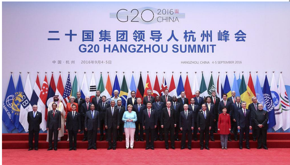
Figura 6 Grupo de los líderes asistentes a la Cumbre del G20 de 2016 en Hangzhou.