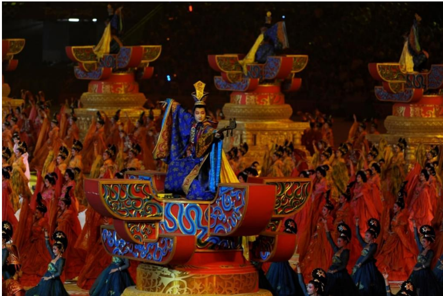
Figura 9 Elementos chinos en la ceremonia de inauguración de los Juegos Olímpicos de Pekín 2008.

Resultados: Los espectadores de todo el mundo, a través de transmisiones televisivas e internet, aumentaron su conocimiento y apreciación de la cultura china, promoviendo el intercambio cultural internacional.