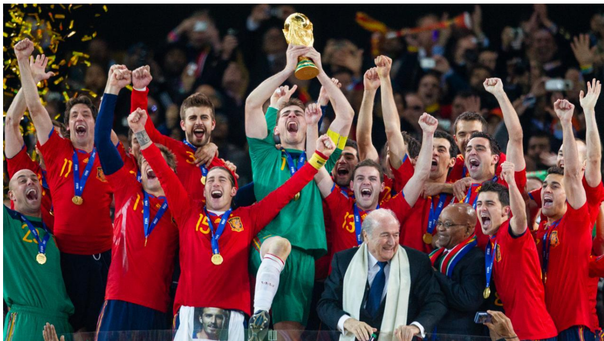
Figura 5 Copa Mundial de Fútbol de 2010.