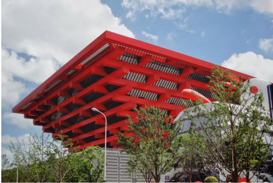
Figura 3 Exposición Universal de Shanghái 2010.