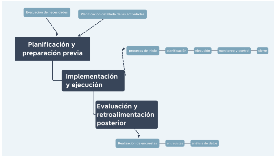
Figura 12 Etapas del nuevo modelo.

El modelo se divide en tres fases: planificación y preparación previa, implementación y ejecución, y evaluación y retroalimentación posterior.