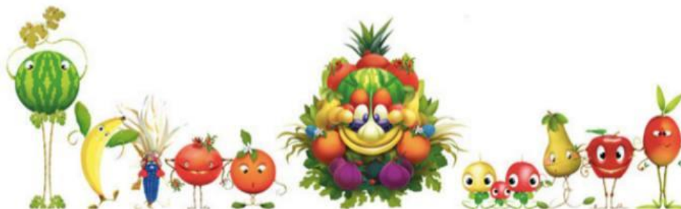
Figura 7 Temas para la Expo de Milán 2015.