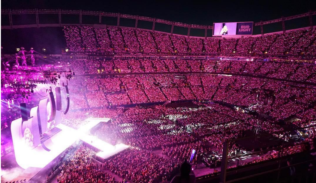
Figura 4 "Reputation Stadium Tour" de Taylor Swift en 2018.