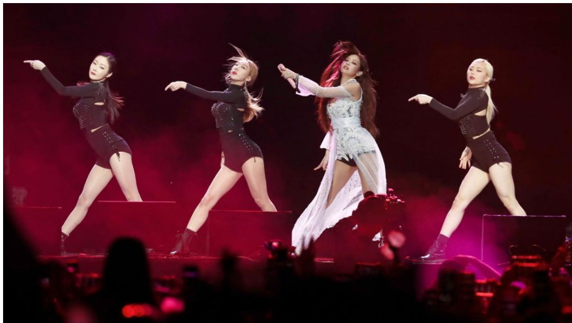
Figura 11 En las actuaciones del Festival de Música y Artes de Coachella 2019.

Resultados: El festival de Coachella 2019 generó más de 114 millones de dólares en ingresos, causando un gran impacto y fomentando el desarrollo de la industria local de hoteles, restaurantes y transporte.