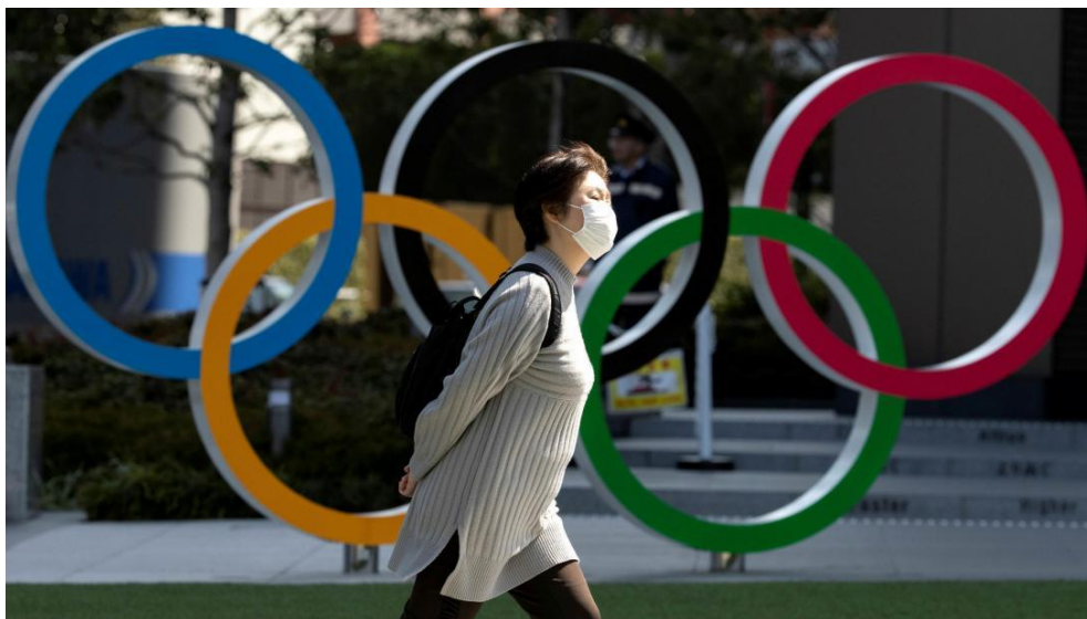
Figura 10 Juegos Olímpicos de Tokio durante el Covid-19.

Medidas para disminuir el impacto negativo: Los organizadores implementaron estrictas medidas de salud y seguridad, incluyendo pruebas regulares, restricciones de público y mejoras en la gestión sanitaria, aunque no lograron eliminar completamente la tensión social.