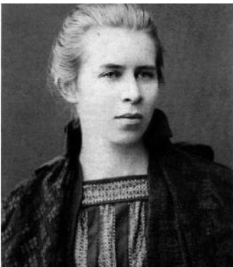
Fig 12. Fotografía del retrato de Lesya Ukraínka