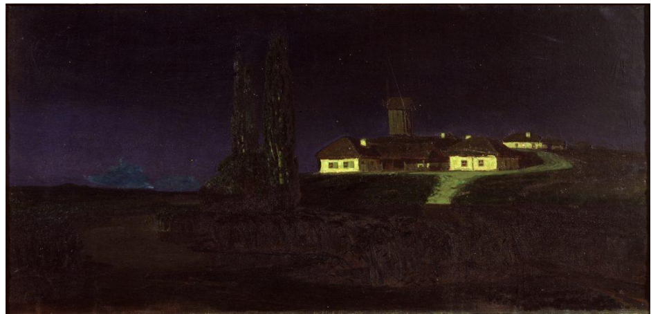
Fig 15. Cuadro de Arkhip Kuindzhi, Ukrainian Night (1876)

Para el paisaje de exterior se ha inspirado en un cuadro de Arkhip Kuindzhi, un pintor tradicional ucraniano, ya que durante el cortometraje se han querido homenajear a artistas tradicionales. Para la casa y su interior nos hemos inspirado en casas tradicionales ucranianas y se ha optado por un acabado que evoque a la acuarela.