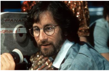
Fig 11. Fotografía del retrato de Steven Allan Spielberg

4. La vida es bella es una película de Roberto Benigni,(1997), que básicamente trata sobre cómo explicarle la guerra a un niño o como hacerle que la pueda vivir sin sufrimiento, alejándole del horror de la misma.. Está ambientada desde 1939 cuando estaba a punto de estallar la Segunda Guerra Mundial hasta su finalización. Los protagonistas de esta obra son Guido, su mujer Dora y su hijo, al estallar la guerra son todos llevados a un campo de concentración puesto que Guido era judío, pero separados de la madre. Durante su trayectoria vemos como Guido intenta hacerle creer a su hijo pequeño que