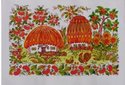
Fig.3. Anónimo. Cuadro estilo Petrykivka.