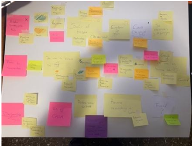
Fig 7. Segunda escaleta

Para coordinar el equipo, primeramente partimos de un mapa conceptual y una presentación de la idea matriz, con su temática, tono y primeros referentes, así el equipo podía tener una primera visión de lo que se deseaba conseguir desde dirección en el cortometraje, y a partir de aquí construir y evolucionar.