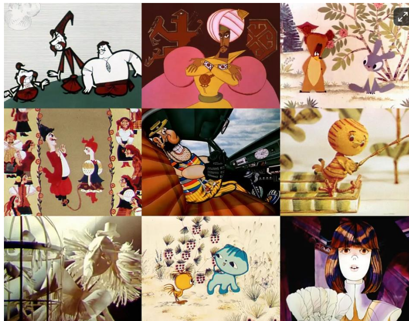
Fig.4. Animación ucraniana por década. Década de 1960 (fila superior): Cómo cocinaban los cosacos Kulesh , Marusia Bohuslavka y El osito y el que vive en el río . Década de los 1970(fila central): Cómo las esposas vendieron a sus maridos , Las aventuras del capitán Wrongel y Un pollo a cuadros . Y los años 80(fila inferior): Arena Blanca , Sobre los grandes y los pequeños y Alicia en el país de las maravillas .

Con un pasado rico en originalidad y con una actualidad llena de energía por nuevos retos, está claro que la animación ucraniana como hizo en su día, perdurará por mucho más tiempo. Es cierto que actualmente con la guerra no está claro su futuro, pasando por un desequilibrio notorio, pero al igual pasa con el país invasor, Rusia, también se ha visto afectada en su mercado de la animación por los actuales acontecimientos.