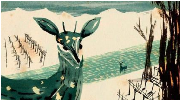
Fig 8. Fotograma extraído del cortometraje de Amore de Inverno