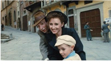
Fig 13. Fotograma extraído de la película La vida es Bella .

todo es un juego para que no sufra las barbaries a los que van a ser expuestos. Esta es una película de referencia en toda regla puesto que a pesar de tratar el tema de la guerra lo hace desde una perspectiva totalmente diferente y familiar, intimista y empática; esto realmente hace que el espectador capte totalmente y conecte con el estado emocional y los personajes con la situación, y finalmente que el mensaje llegue más profundo.