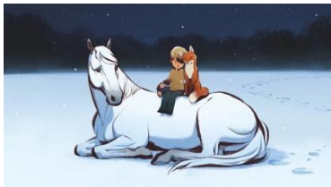
Fig 9. Fotograma extraído del cortometraje de El niño, el zorro y el caballo