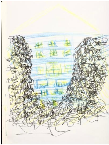
Fig.1. Asignatura Dibujo y Expresión, Dibujo de Darya Didenko. Un edificio derrumbado por un bomba y redibujado la estructura con lápices de colores