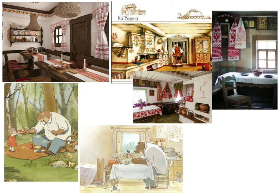
Fig 16. Moodboard para la casa y el estilo.