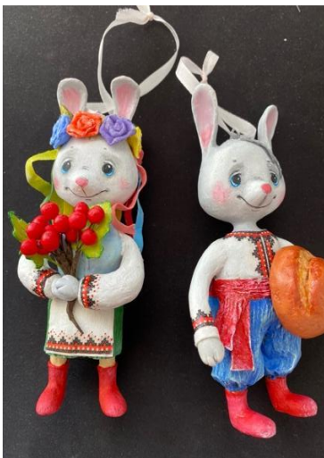
Fig 5. Muñecos originiales

El año que comenzó la guerra, esas mismas navidades, nos regalaron dos conejitos de papel maché vestidos con el traje tradicional ucraniano y estos guardaban una historia detrás. Fueron construidos por una mujer que se gana la vida vendiendo estos muñecos, y justo estos dos los elaboró bajo la luz de una vela mientras bombardeaban su ciudad, una historia que no me dejó indiferente. (Fig. 5)