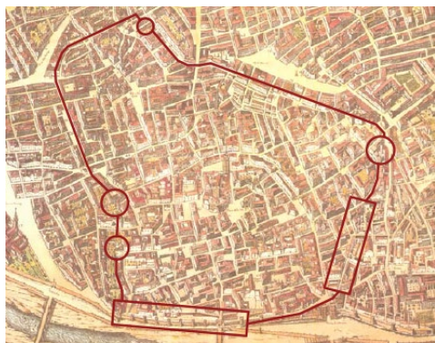
Fig. 3- Vestigios de la muralla árabe grafiados por Tosca en 1704. Grabado de Fortea de 1734.

(1924); Lamarca (1848), Escaplez (1738), Carboneres (1873) y Chavás (1889) en el siglo XIX; Torres Balbas (1970), Sanchis Sivera (1932), Sanchis Guarner (1965), Cabanes (1998), Huici Miranda (2017), Hinojosa Montalvo (2014), (López González y Mániz Téstor (2020), Aldana (2000) etc. en el siglo XX. Asimismo arqueólogos de la talla de Nicolu Primitiu Gómez Serrano (1997) realizaron a comienzos del siglo XX una importante labor en el conocimiento de las obras de infraestructuras históricas, impulsando excavaciones en lugares como la Almoyna o el alcazar islámico, proporcionando el primer análisis sistemático de la arqueología valenciana (Jimenez, 2009: 48)