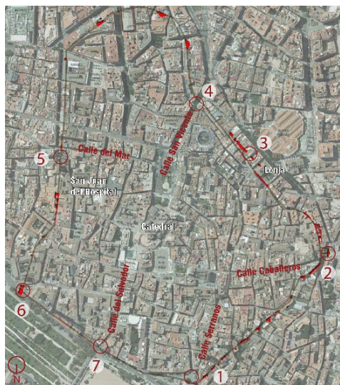
Fig. 1- Foto aérea 2013 SIGESPA con los restos arqueológicos de la muralla árabe. Plan General de Valencia. Catálogo de bienes y espacios protegidos. El nombre de las puertas se indica en la figura 2

Esta muralla fue mandada edificar por ‘Abd al-Aziz ben ‘Abd ar-Rahman al-Nasir ben Abí Amir (Sanchis i Guarner, 1965:240). Según el geógrafo almeriense Al-‘Udrí, (siglo XI) estaba construida en piedra, asentada sobre cimientos de adobe y sus muros eran la obra más perfecta y hermosa de al-Andalus. Este mismo autor cita seis puertas de la muralla ya que la puerta de la Alaería fue abierta con posterioridad. (Hinojosa Montalvo, 2011). En esta comunicación se hace referencia exclusivamente a la puerta de la Xarea.