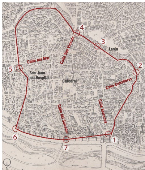
Fig. 2- Sobre el plano de Mancelli (1608) se ha grafiado el recorrido de la muralla y sus puertas: