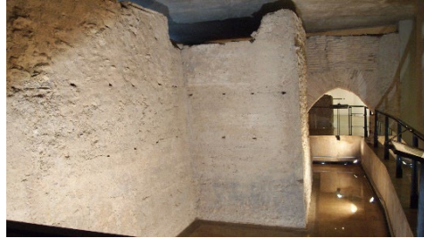
Fig. 7- La muralla árabe de Valencia ubicada en la plaza del Tossal de Valencia.

como en las excavaciones que se han realizado en diferentes partes del lienzo de muralla (Fig. 1) (Badía y Pascual. 1991)