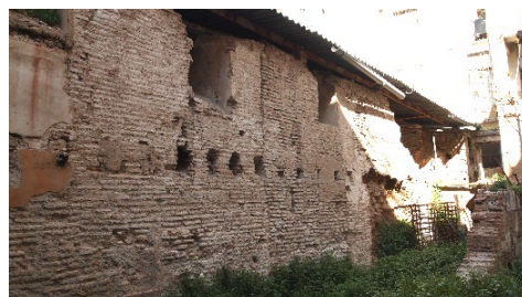
Fig. 6- La calle de Xepolella, llamada por los cristianos calle de Cristofol Soler. En la actualidad forma parte de una propiedad privada.

...illam carrariam totam de Xepolela quam habent in circumfinio de Exarea sicut vadit de domibus utriusque partis usque ad Algañic de Abinjafaci (1648). Esta calle, llamada posteriormente por los cristianos calle de Cristofolo Soler conducía al barrio musulmán denominado Rabat Alcadi. Este era el barrio donde se encontraba el mercado de la ciudad y el matadero. Desde esta misma calle se accedía también al Çoch o zoco. Se trataba de una calle de carácter comercial donde se vendían productos de lujo como sedas, plata, cuero, etc. (Magdalena, 1979:318) (Fig. 5)