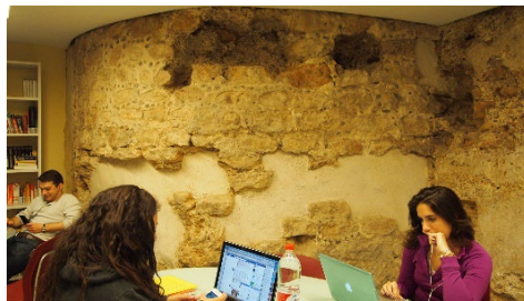
Fig. 4- Vestigios del torreón situado en el interior de un edificio de la calle de las Rocas. Es de destacar el adorno mediante pequeñas piedras de color negro incrustadas en la argamasa de la mampostería.

los cristianos del Temple y por los árabes Bab al-Sakhar o Puerta de la Roca.