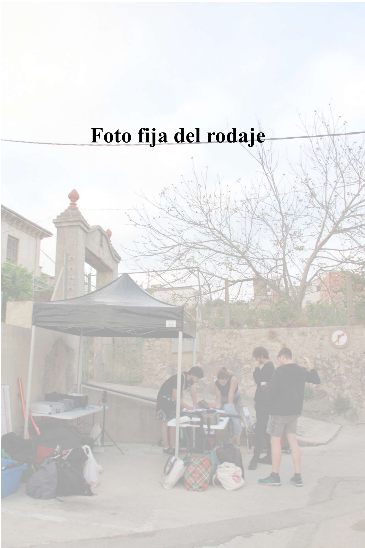
Foto fija del rodaje