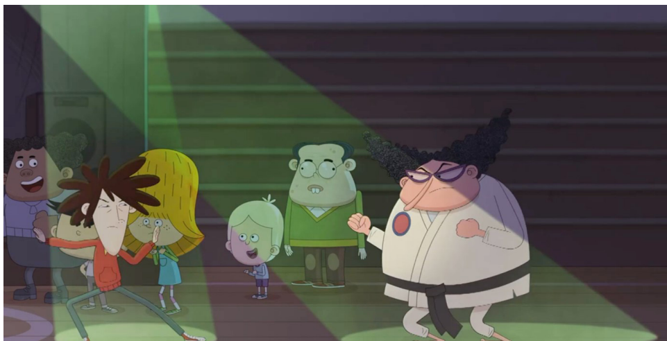
Fig. 3. Captura de Yo, Elvis Riboldi . Episodio 2. Presentación del esperado evento de artes marciales: Señorita Jennifer vs. Sunte Lee.

En esta línea, otro estudio revela que España sería el tercer país del mundo en recetar psicofármacos a menores de 17 años, por detrás de Canadá y Estados Unidos de América (Aguirre Sánchez et al., 2022:10)