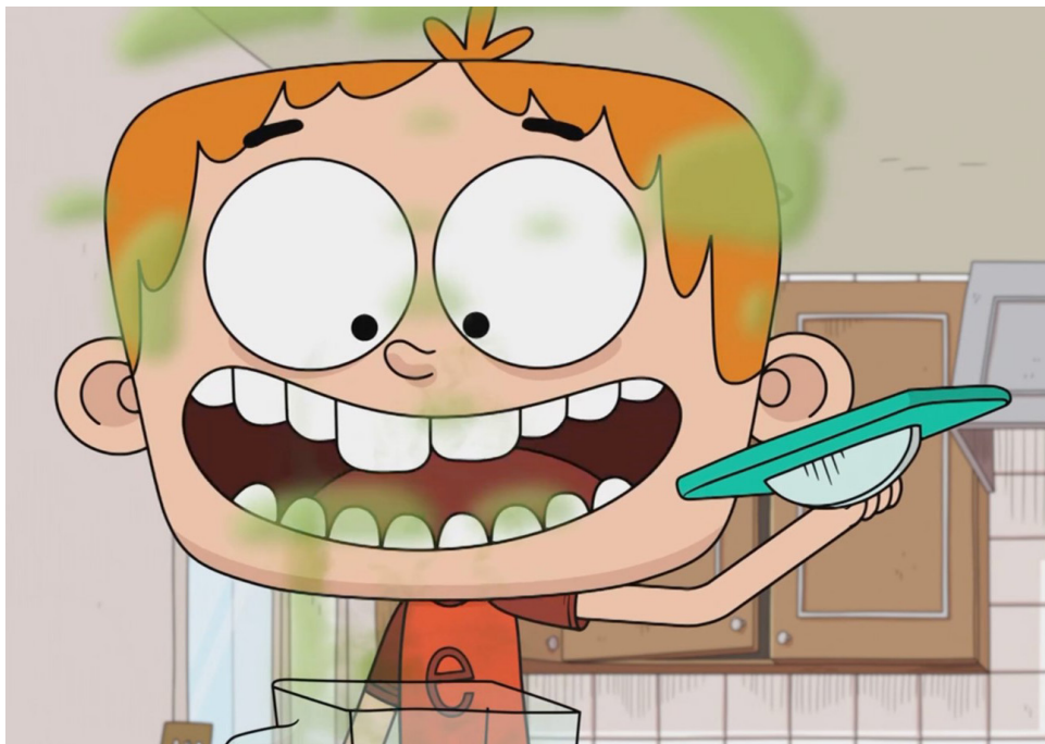
Fig. 4. Captura de Yo, Elvis Riboldi . Episodio 3. La creación de una fragancia propia.

con la realidad. En lo que concierne al color, no se observa una propuesta o tendencia estética determinada, se destaca el mismo estilo presentado en las ilustraciones de las ediciones impresas.