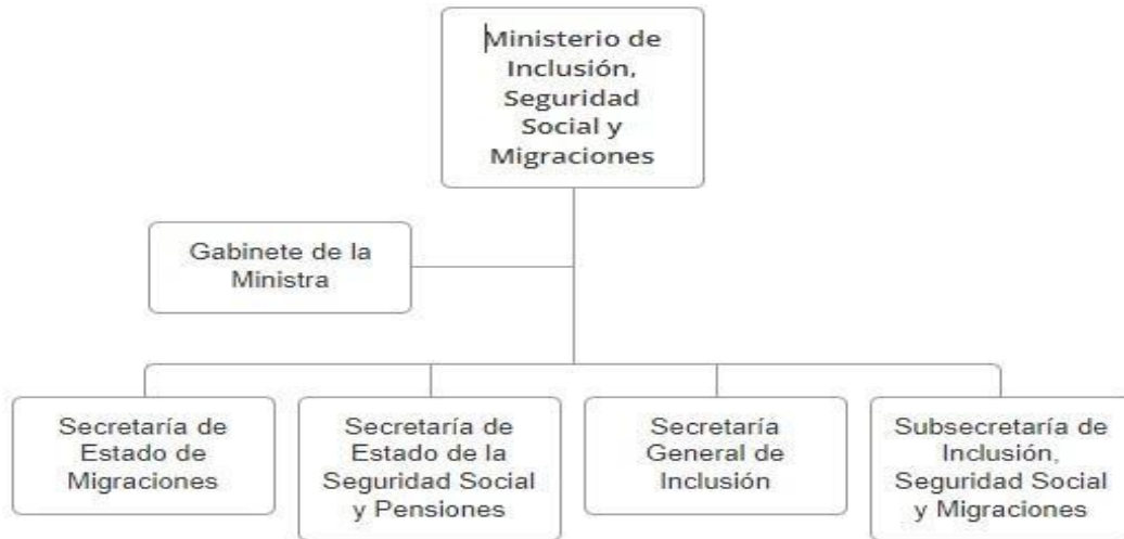
Figura: 1 Organigrama general Ministerio de Inclusión, Seguridad Social y Migraciones