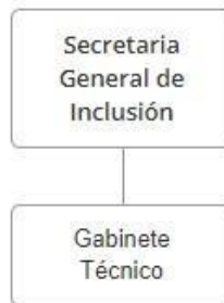
Figura: 4 Organigrama secretaría General de Inclusión

Así pues, este organigrama refleja cómo se organiza la Secretaría de Estado de la Seguridad Social y Pensiones, con un enfoque en la gestión integral del sistema de seguridad social en España, desde la planificación hasta la ejecución tecnológica.