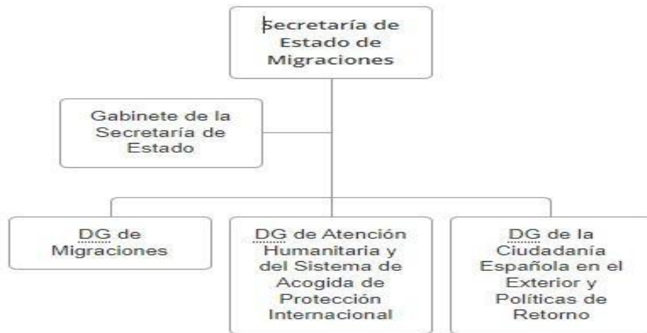
Figura: 2 Organigrama secretaría de Estado de Migraciones