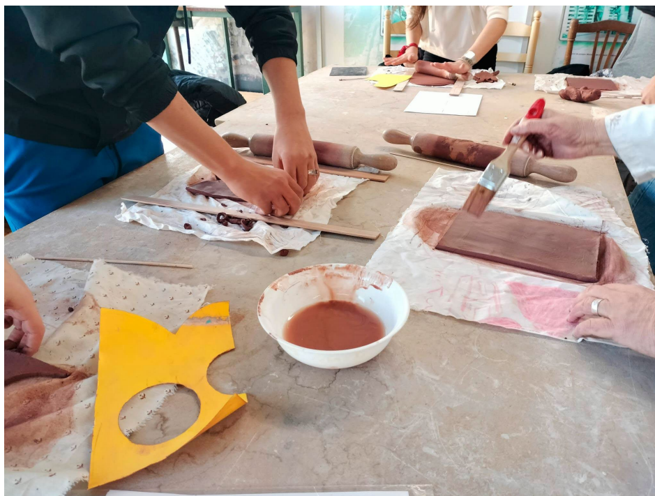
Fig. 1 Imagen del proceso de trabajo en la primera sesión del taller.

La actividad consta de dos sesiones de 50 minutos muy bien estructuradas: en la primera, se procede al amasado manual de la arcilla para darle forma laminada y un espesor homogéneo mediante rodillos de madera, una vez alisado el barro se práctica el recorte de cada una de las piezas empleando diferentes plantillas con el diseño previsto para cada azulejo. En la segunda sesión, se lleva a cabo el esmaltado de los azulejos que ya han pasado la fase de secado, se utiliza una gama de tres colores en cada una de las piezas. Finalmente, la ceramista del museo efectua el proceso de horneado para fijar el color de los azulejos y dejarlos acabados para su exposición.