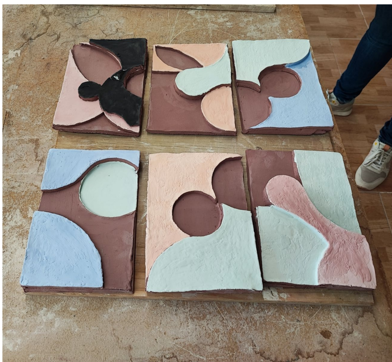
Fig. 4 Imagen de las piezas de cerámica con la aplicación del color y preparadas para el proceso de horneado.

Los azulejos formaron parte de la exposición “Hacer el pasado sostenible”, realizada el 20 de mayo de 2023 en el Museo del Azulejo Manolo Safont de Onda. La muestra recogió las obras hechas por alumnado de los institutos Serra d’Espadà y Torrelló y del Máster de Secundaria de la Universitat Jaume I.