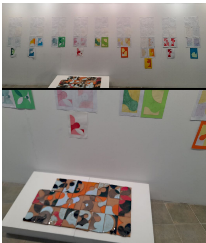
Fig. 5 Imagen de la exposición “Hacer el pasado sostenible” realizada el 20 de mayo de 2023, en el Museo del Azulejo Manolo Safont de Onda.

Los azulejos formaron parte de la exposición “Hacer el pasado sostenible”, realizada el 20 de mayo de 2023 en el Museo del Azulejo Manolo Safont de Onda. La muestra recogió las obras hechas por alumnado de los institutos Serra d’Espadà y Torrelló y del Máster de Secundaria de la Universitat Jaume I.