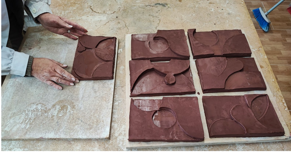
Fig. 2 Imagen de las piezas acabadas después de la primera sesión.