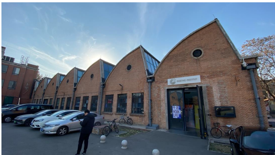
Fig. 5 Fotografía de la entrada del Instituto Goethe en el distrito de arte 798.