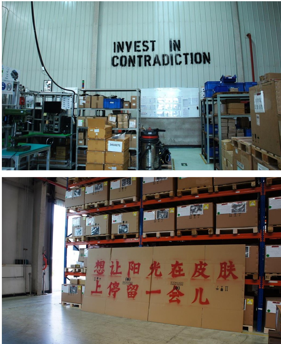
Fig. 2 Fotografía de las obra del artista Ma Yongfeng. Fuente: El Departamento de I+D de Sensibilidad Social (2011)

El eslogan oficial de Bernard Controls, “Invertir en Confianza,” encarna un compromiso con la fiabilidad en la producción de componentes nucleares, abogando por un “mentalidad positiva” que contrasta marcadamente con las frases subversivas de Ma. Sus eslóganes juguetones pero críticos perturban el orden usual de la producción industrial, introduciendo imprevisibilidad y humor. No solo critican los matices autoritarios de la cultura corporativa, sino que también promueven un diálogo sobre la autonomía, la expresión y la condición humana dentro del entorno industrial. Al integrar estos eslóganes dentro de la fábrica fomenta un espacio donde el pensamiento independiente y el cumplimiento organizacional coexisten, instando a una reevaluación de los roles y derechos de los trabajadores. Su arte transforma el paisaje estético de la fábrica y estimula una interacción más reflexiva y dinámica entre los empleados y los valores de sus empleadores, destacando el potencial transformador del arte en entornos corporativos.