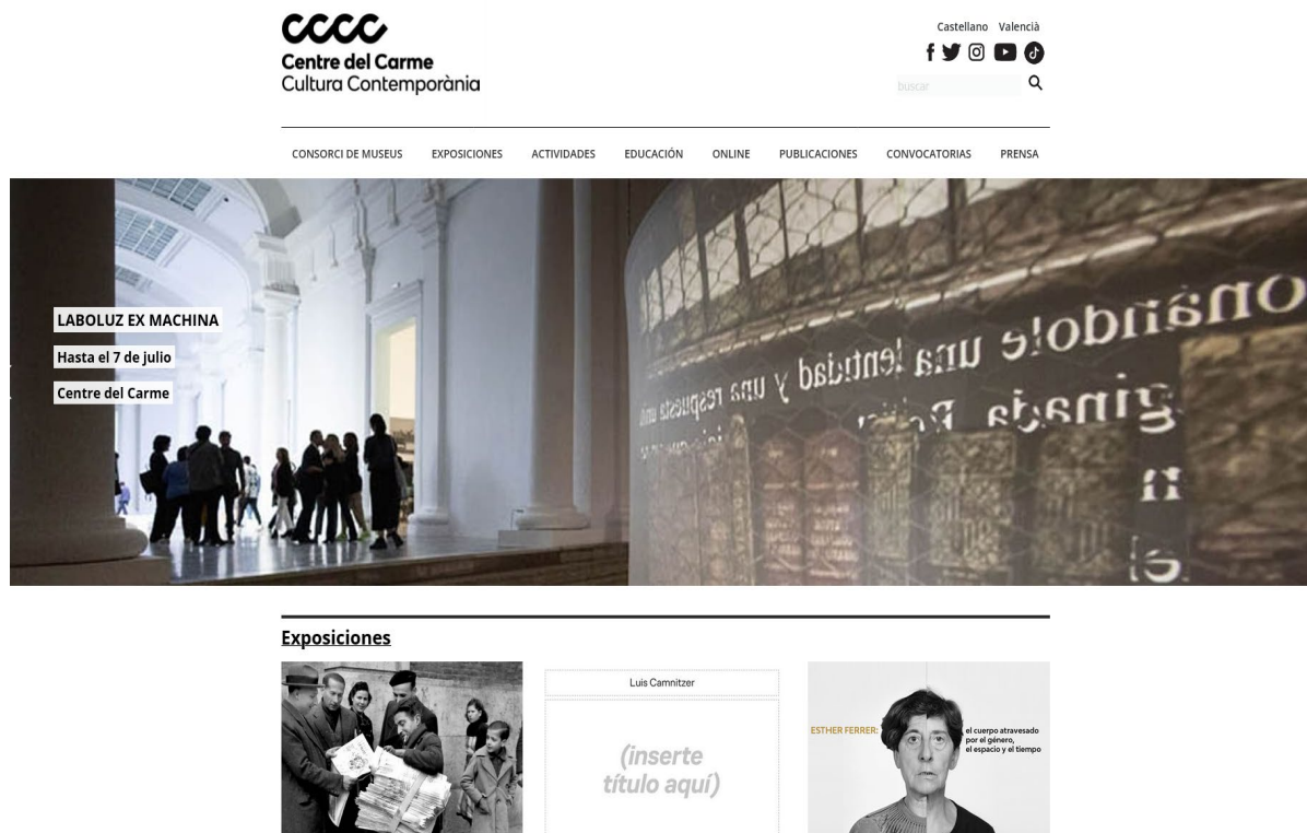
Fig. 3. Página web del Centre del Carme.

Existen otros proyectos artísticos relevantes en el marco de esta investigación y que van más allá del fake y la suplantación. Entre ellos se destacan "Aleph-arts" (1997-2002), un sitio web que servía como punto de encuentro e información sobre net art y exposiciones, "The File Room" de Muntadas (1994), un archivo de casos de censura en el arte que defiende el derecho al conocimiento, y "e-valencia.org" de Daniel García Andújar (2001), un foro que surgió como respuesta al descontento con la política cultural institucional en la Comunitat Valenciana. Este último buscaba trasladar las discusiones sobre política cultural a una plataforma participativa, un foro, para que los ciudadanos pudieran expresar sus opiniones y participar en el debate.