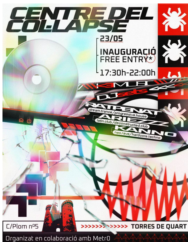
Fig. 4. Cartel de inauguración del CCCC. (2024)