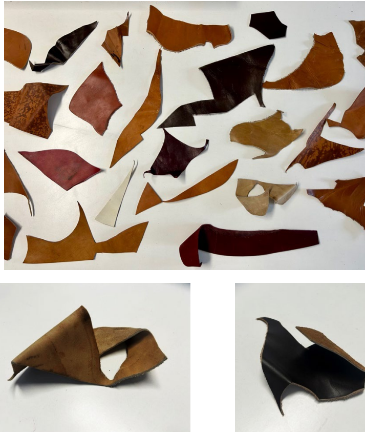
Fig. 2 Imágenes de recortes de cuero sobrantes almacenados en la casa familiar.

Por otra parte, recuperar los saberes populares y las artesanías tradicionales puede entenderse, en cierto sentido y salvando las distancias, como un objetivo alineado con la teoría de la “ecología de saberes” promulgada por Boaventura de Sousa Santos (2010); ya que más allá del conocimiento científico, de los avances tecnológicos y del ansia de progreso promovidos en las sociedades occidentales, existen otras gnoseologías válidas (no solo en el Sur global, sino también en el propio contexto occidental), que pertenecen a tiempos pasados y al ámbito de la memoria y del recuerdo, y que merecen la pena ser visibilizadas y puestas en valor. Estos conocimientos se caracterizan por desarrollarse manualmente en un tiempo pausado, y por transmitirse oralmente de generación a generación; rasgos en cierta manera también presentes en el proyecto artístico realizado, como se verá a continuación.