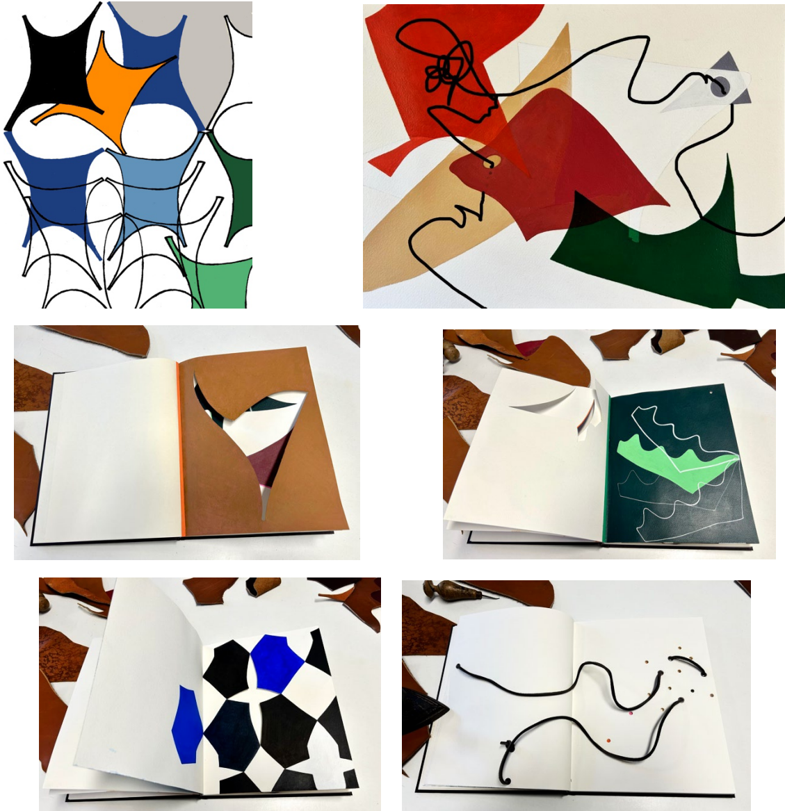
Fig. 4 Imágenes de los primeros resultados del proyecto.