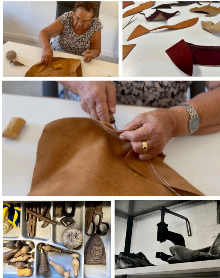
Fig. 3 Mapa visual vinculado a la metodología del proyecto.