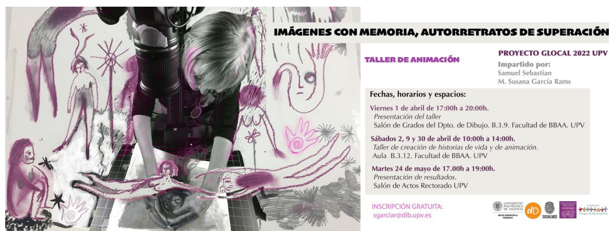
Fig. 1. García Rams. M. Susana. (2022) Publicidad del taller y calendario de actividades.

Las mujeres tenemos que estar siempre alerta en todos los niveles para estar a salvo...y eso es algo que nos une más allá de que hablemos distintas lenguas o nos expresemos diferente.” (Herguera. 24,09,2023)