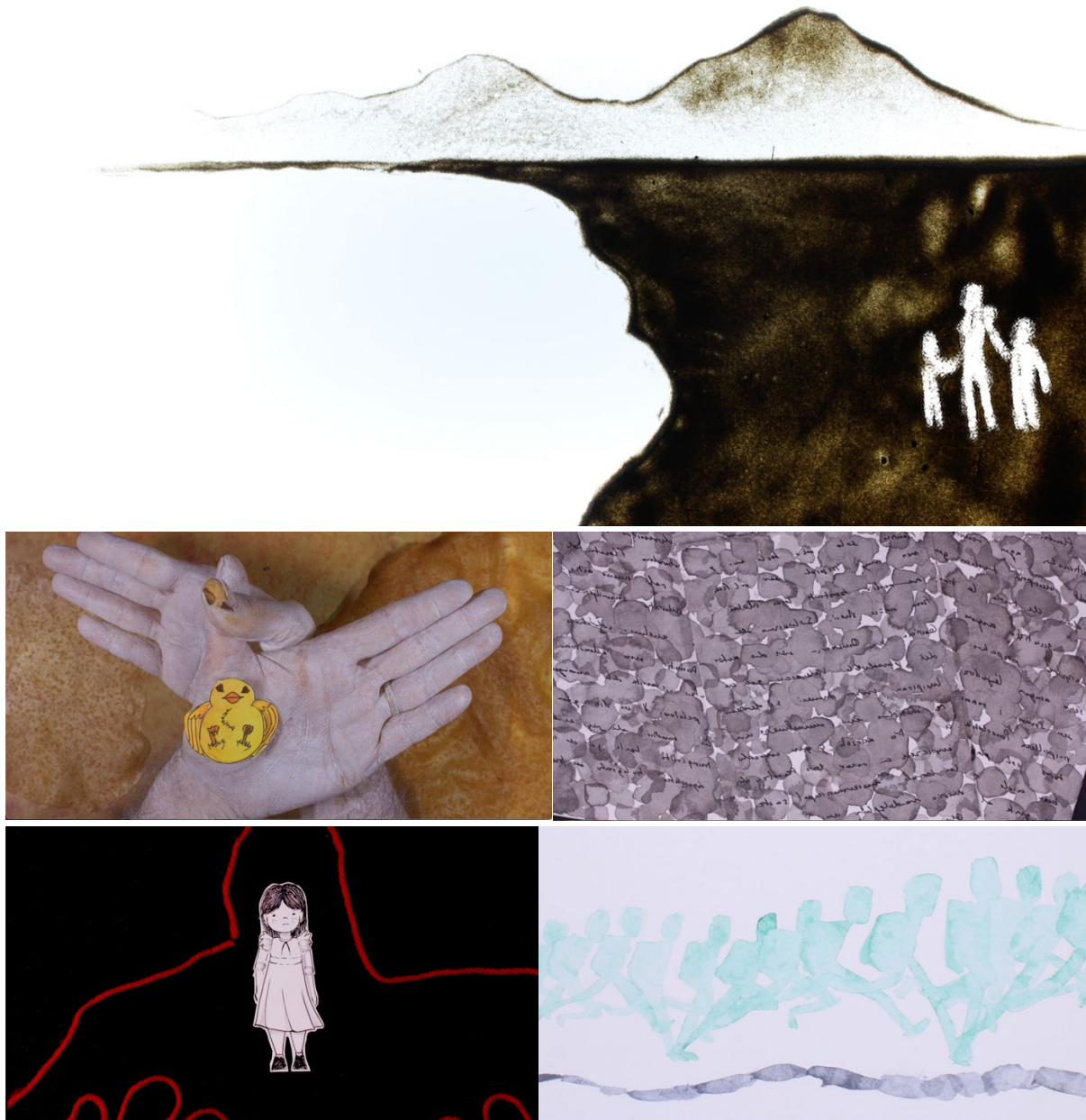
Fig. 3. Imágenes de la diversidad técnica de los cinco cortos animados. Arriba arena, recortes y pixilación, tinta y caligrafía, dibujo y collage y finalmente acuarela sobre papel.

La metodología aplicada fue de intervención social desde la animación. Cada una de las fases tuvo una estrategia de trabajo, planificada cuidadosamente, para abordar cada sesión del taller involucrando activamente a las mujeres de manera lúdica y transversal. Con actividades relacionadas con la creatividad, la expresión y el aprendizaje de herramientas narrativas y audiovisuales. En equipos de 5 personas, con supervisión y tiempos de experimentación y reflexión. Fueron 30 horas, del 1 de abril al 24 de mayo de 2022. Un viernes de 17:00 a 21:00 y cinco sábados de 10:00h a 15:00h. Seguimiento dentro y fuera del taller.