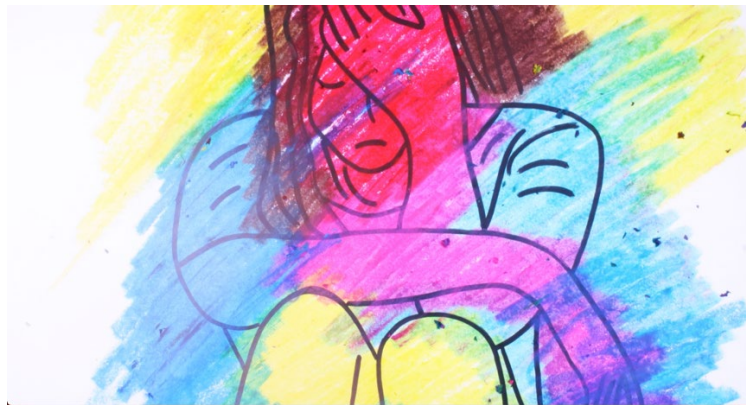
Fig. 2. Imagen del Taller intervenida por una de las mujeres. Dibujo con rotulador y ceras

El objetivo substancial del proyecto fue dar a conocer la situación de las mujeres víctimas de violencia machista y de sus hijas/os en primera persona, trabajando la escucha activa a través del relato vivencial de cinco de ellas; desvelando los abusos e injusticias sufridos, el abandono social e institucional, sus coincidencias desde orígenes y culturas diversas, pero sobre todo, su fortaleza y hacerlo visible en animación. “No se trata de que a través de lo visual se narre lo que les sucede a los seres humanos, sino de que en su forma narrativa se capte un aspecto que ya estaba presente en las vidas relatadas” (Córdoba. V.Y. 2007.236)