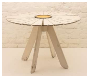
Fig. a.70. Mesa girasol para jardín. Década de 1950