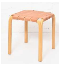
Fig. a.56. modelo Y61