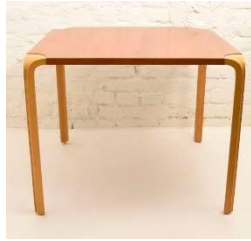
Fig. a.68. Mesa de comedor con pata en abanico. Década de 1960