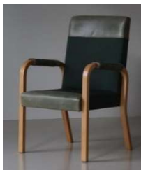
Fig. a.18. Silla excepcional para Enso-Gutzeit. 1962