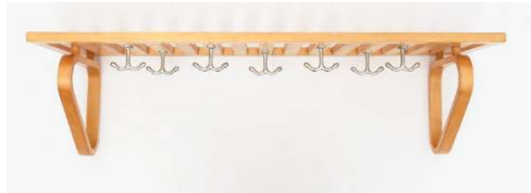
Fig. a.86. Perchero 1940s