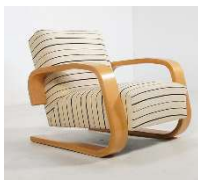
Fig. a.5. Modelo 400. Periodo de producción de 1960 a 1969