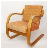
Fig. a.4. Modelo 34/402. Periodo de producción de 1940 a 1949.