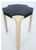
Fig. a.47. X602