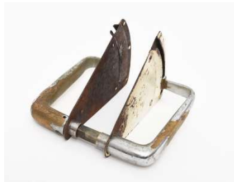
Fig. a.129. Pomos para Paimio. 1932