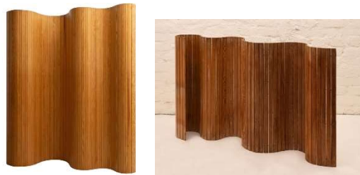
Fig. a.130. Pantalla 100. 1936. Versión alta y baja