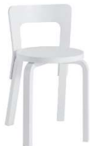
Fig. a.24. Modelo 65. Diseñada en 1935. También versión para niños NE65