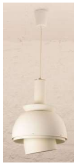
Fig. a.105. A118. Década de 1950/1960