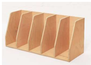
Fig. a.89. Almacenaje para libros atribuido a Aino Aalto. Década de 1930