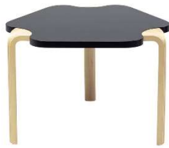
Fig. a.74. Mesa para Maison Carré. 1958