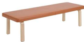
Fig. a.32. Banco 167. 1945