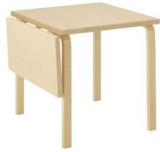
Fig. a.62. mesa DL18C. Plegable. 1933