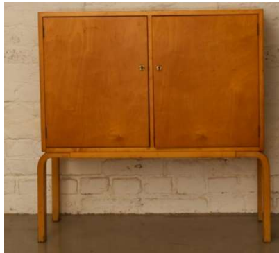
Fig. a.92. armario 810. 1950s