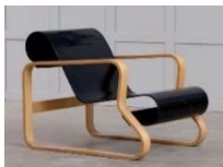
Fig. a.12. Silla 41 Paimio. Diseñada en 1932.