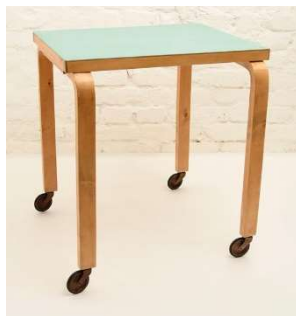
Fig. a.65. Mesa cuadrada con ruedas