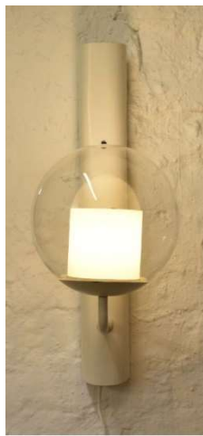
Fig. a.110. Wall lamp for Paimio sanatorium. 1932