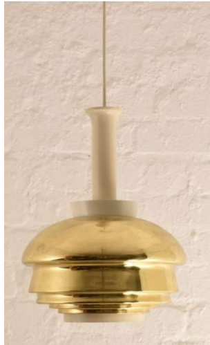
Fig. a.104. A335B. Década de 1960