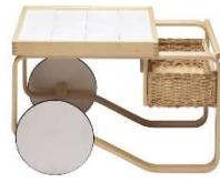
Fig. a.79. Carrito de té 900. 1937