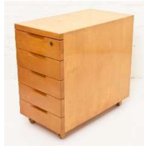
Fig. a.90. Cajonera grande 1930s