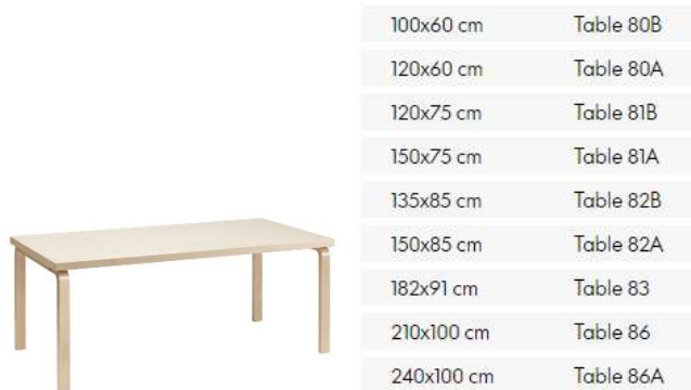
Fig. a.57. Mesa rectangular y variantes de dimensiones. 1933