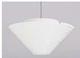
Fig. a.101. Plafondier A622B.