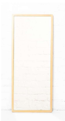
Fig. a.121. Modelo 192A. Década de 1970