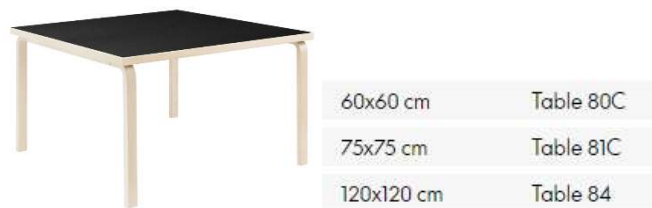
Fig. a.58. Mesa cuadrada y variantes de dimensiones. 1933