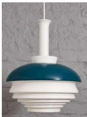
Fig. a.103. A335A. Década de 1950