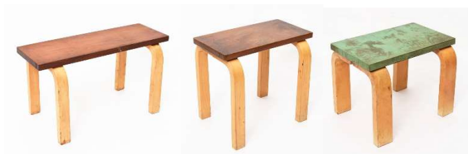
Fig. a.78. Mesas pequeñas