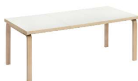
Fig. a.61. Mesa Extensible. 1956