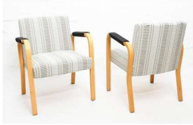
Fig. a.19. Modelo 46. Producido en 1947