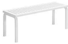
Fig. a.30. Banco 153A. 1945