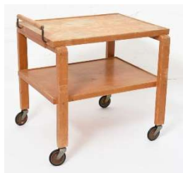
Fig. a.81. Excepcional carrito de té con finger joints. 1940s