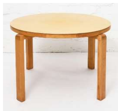
Fig. a.67. Excepcional mesa redonda con finger joint. Década de 1940