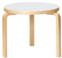
Fig. a.76. Mesa auxiliar 90D