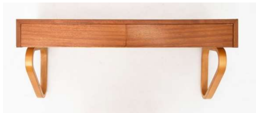
Fig. a.88. Consola de pared con cajones. Década de 1950