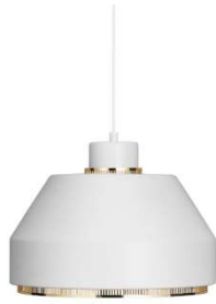
Fig. a.100. AMA500. 1941. Aino Aalto