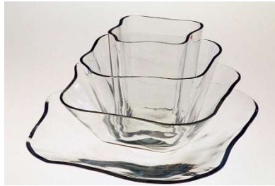
Fig. a.123. La flor de Aalto. Conjunto de 4 jarrones/platos. Alvar y Aino Aalto. 1939