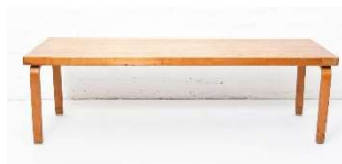
Fig. a.35. Banco para flores. Década de 1930