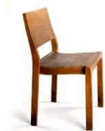
Fig. a.22. Modelo 611. Diseñada en 1929. También versión para niños