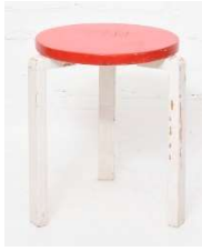
Fig. a.50. Stool 60 con Finger joint