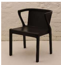
Fig. a.29. Modelo nº2. Década de 1930