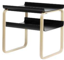
Fig. a.75. Mesa auxiliar 915. 1932