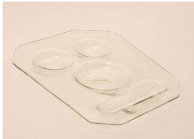
Fig. a.125. Cocktail o plato de ensalada. Década de 1950.