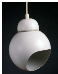
Fig. a.106. A338. "Bilberry". 1958