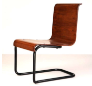
Fig. a.20. Silla 23. 1930/1932. Usada en Paimio. Vista por primera vez en exposición.