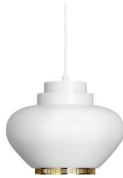
Fig. a.97. A333 "Turnip". 1954