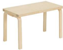
Fig. a.31. Banco 153B. 1945