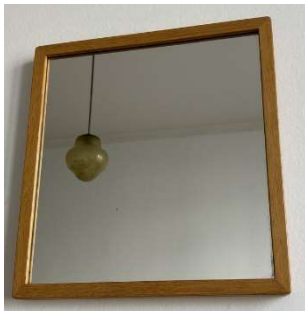
Fig. a.119. Modelo 192B. 1950