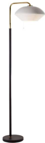
Fig. a.114. Lámpara de pie A811. 1965