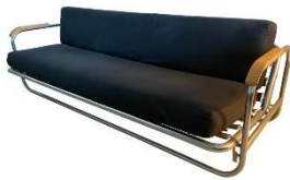
Fig. a.41. Sofá cama. Década de 1940.