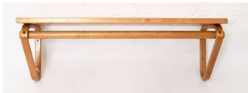
Fig. a.87. Estantería para sombreros. Década de 1930