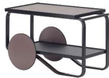
Fig. a.80. Carrito de té 901. 1936