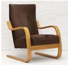
Fig. a.15. Modelo A36. Diseñada de 1929 a 1949. Similar a 402 y 401 pero altura intermedia y asiento bajo.