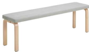
Fig. a.33. Banco 168 B