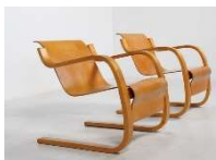
Fig. a.6. Número 31 silla en voladizo. Posteriormente llamado modelo 42. Diseñado en 1932