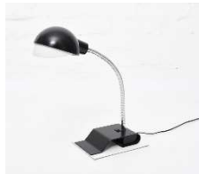
Fig. a.117. Flexo A703. Década de 1980