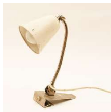
Fig. a.118. Paimio lámpara para leer. Década de 1930