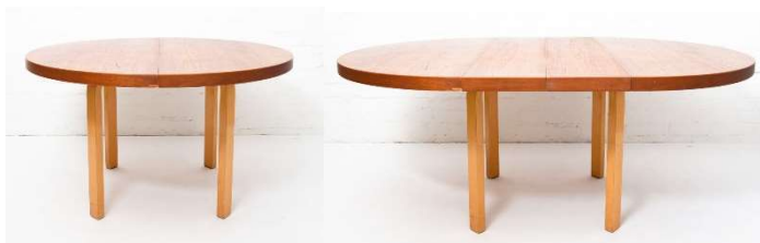
Fig. a.66. Excepcional L93 redonda extensible. Década de 1950