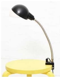
Fig. a.116. Flexo excepcional A703. Década de 1950