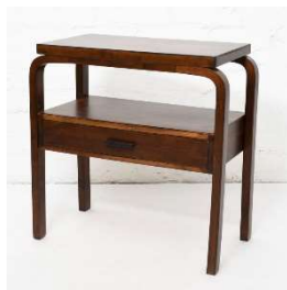
Fig. a.77. Primera edición de mesa auxiliar. 1930s