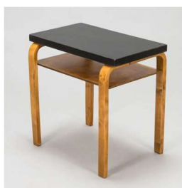
Fig. a.73. Mesa auxiliar. Década de 1930