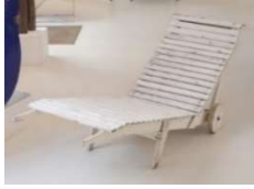
Fig.a.1. Silla para el porche de Villa Mairea atribuida a Alvar Aalto.