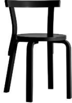
Fig. a.26. Modelo 68. Diseñada en 1935