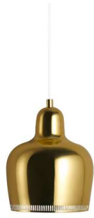
Fig. a.94. A330S "Golden Bell". 1937