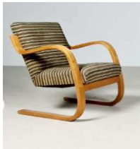
Fig. a.3. Modelo 402. Periodo de producción de 1930 a 1939.