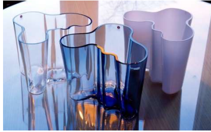
Fig. a.124. Jarrón Aalto "Savoy vase". 1936. Diferentes formas y tamaños.