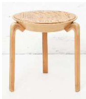
Fig. a.55. Excepcional modelo V63. Década de 1940