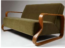
Fig. a.43. Modelo 544. 1932