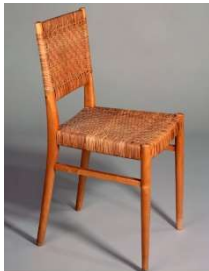
Fig. a.28. Silla de mimbre atribuida a Aino Aalto. Década de 1940