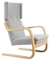
Fig. a.10. Periodo de producción de 1930 a 1939