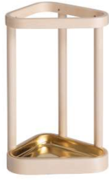
Fig. a.127. Paragüero 115. 1936