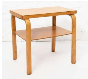
Fig. a.71. Mesa para radio. Década de 1940