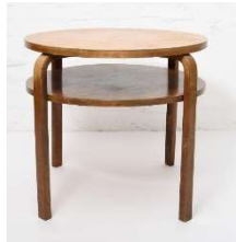
Fig. a.63. Mesa de club con altura rara. 1930s