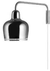
Fig. a.108. Lámpara de pared A330S "Golden Bell". 1937