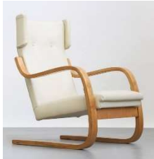
Fig. a.8. Periodo de producción de 1930 a 1939