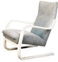
Fig. a.7. Modelo 401 sillón en voladizo.