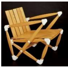
Fig.a.2. Silla de terraza. 1955