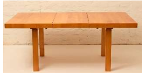
Fig. a.69. Mesa rectangular extensible con H-leg. Década de 1940