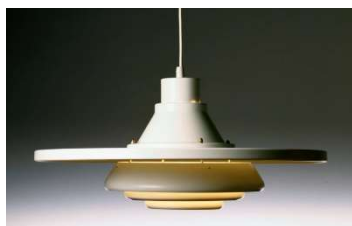
Fig. a.107. A337. "flying saucer". 1957