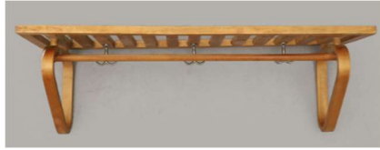
Fig. a.85. Estantería perchero. Década de 1930