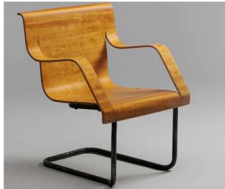
Fig. a.21. Silla 26 versión de la silla 23 (con reposabrazos)