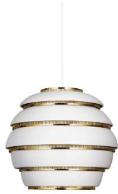
Fig. a.95. A331 "beehive". 1953