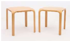
Fig. a.46. x601. Década de 1980