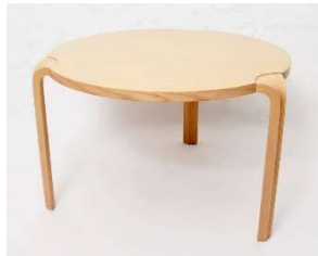
Fig. a.64. Mesa redonda con pata en abanico.