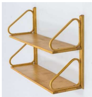
Fig. a.84. Estantería de pared. 1946-1956