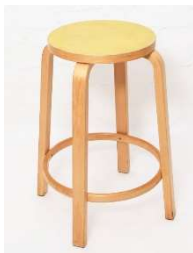
Fig. a.53. Taburete para bar 64. 1935