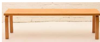
Fig. a.36. Banco para flores con patas más cortas.