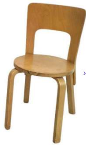
Fig. a.23. Modelo 66. Diseñada en 1935