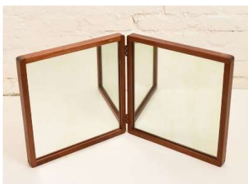
Fig. a.122. Espejo doble con bisagra