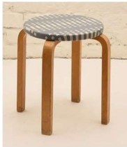
Fig. a.51. taburete E60. 1934. También versión para niños NE60