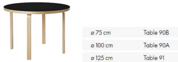
Fig. a.59. Mesa redonda y variantes de dimensiones. 1933