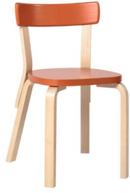
Fig. a.25. Modelo 69. Diseñada en 1935