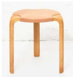
Fig. a.45. X600. Década de 1960