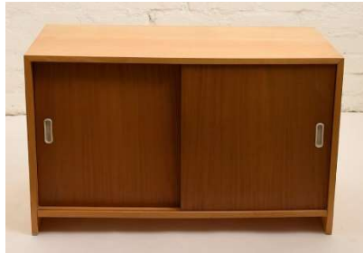
Fig. a.91. Armario 217. 1950s