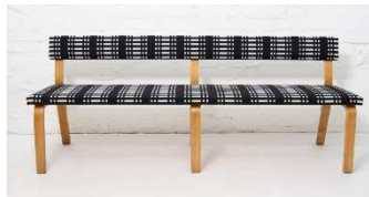
Fig. a.34. Excepcional banco con pata en L. Década de 1940