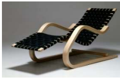
Fig. a.16. Sillón reclinado modelo 43. Diseñado en 1937