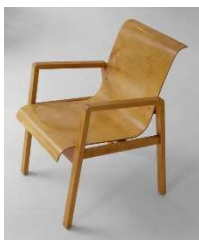
Fig. a.17. Modelo 51/403. Periodo de producción de 1930 a 1939.