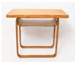
Fig. a.72. Mesa auxiliar 916. Década de 1930