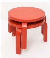
Fig. a.49. Stool 60 con patas más cortas