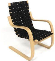
Fig. a.14. Modelo 406. Periodo de producción de 1970 a 1979.