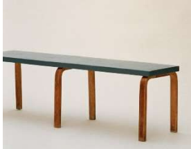
Fig. a.38. Banco con seis patas. 1935