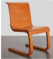
Fig. a.27. Modelo 21 en voladizo.