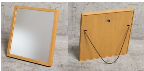
Fig. a.120. Espejo de pared o mesa. Década de 1950