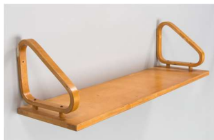
Fig. a.82. Estantería modelo 112. 1936