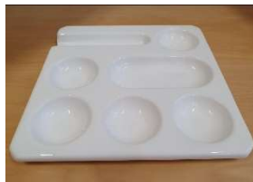
Fig. a.126. Bandeja de cocktail vintage. Década de 1950