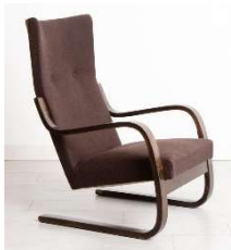
Fig. a.9. Periodo de producción de 1930 a 1939.