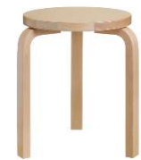
Fig. a.48. Stool 60. 1933