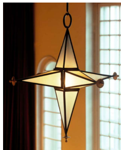
Fig. a.93. Lámpara para auditorio. 1925