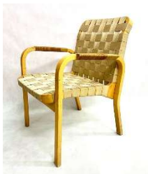
Fig. a.11. Modelo 45. Diseñada en 1947.