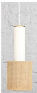
Fig. a.102. Excepcional A115. Década de 1950