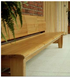
Fig. a.39. Banco para Säynätsalo.