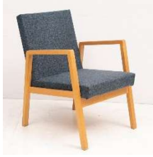
Fig. a.13. Modelo 54/404. Variante acolchada de la 403 (1932). Silla de pasillo vintage. Periodo de producción de 1950 a 1959.