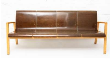
Fig. a.37. Excepcional banco para pasillo. Década de 1940