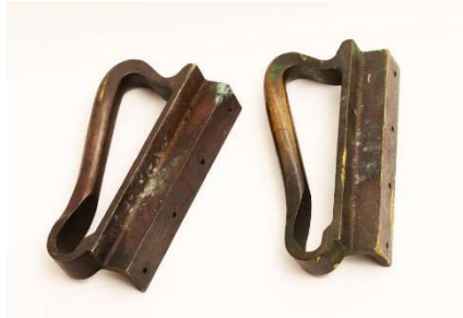
Fig. a.128. Pomos. Década de 1950