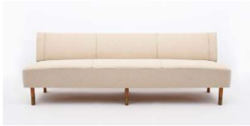
Fig. a.44. Sofá excepcional. Década de 1950.