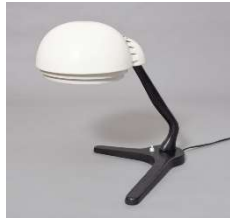
Fig. a.115. Flexo excepcional A704. Década de 1950