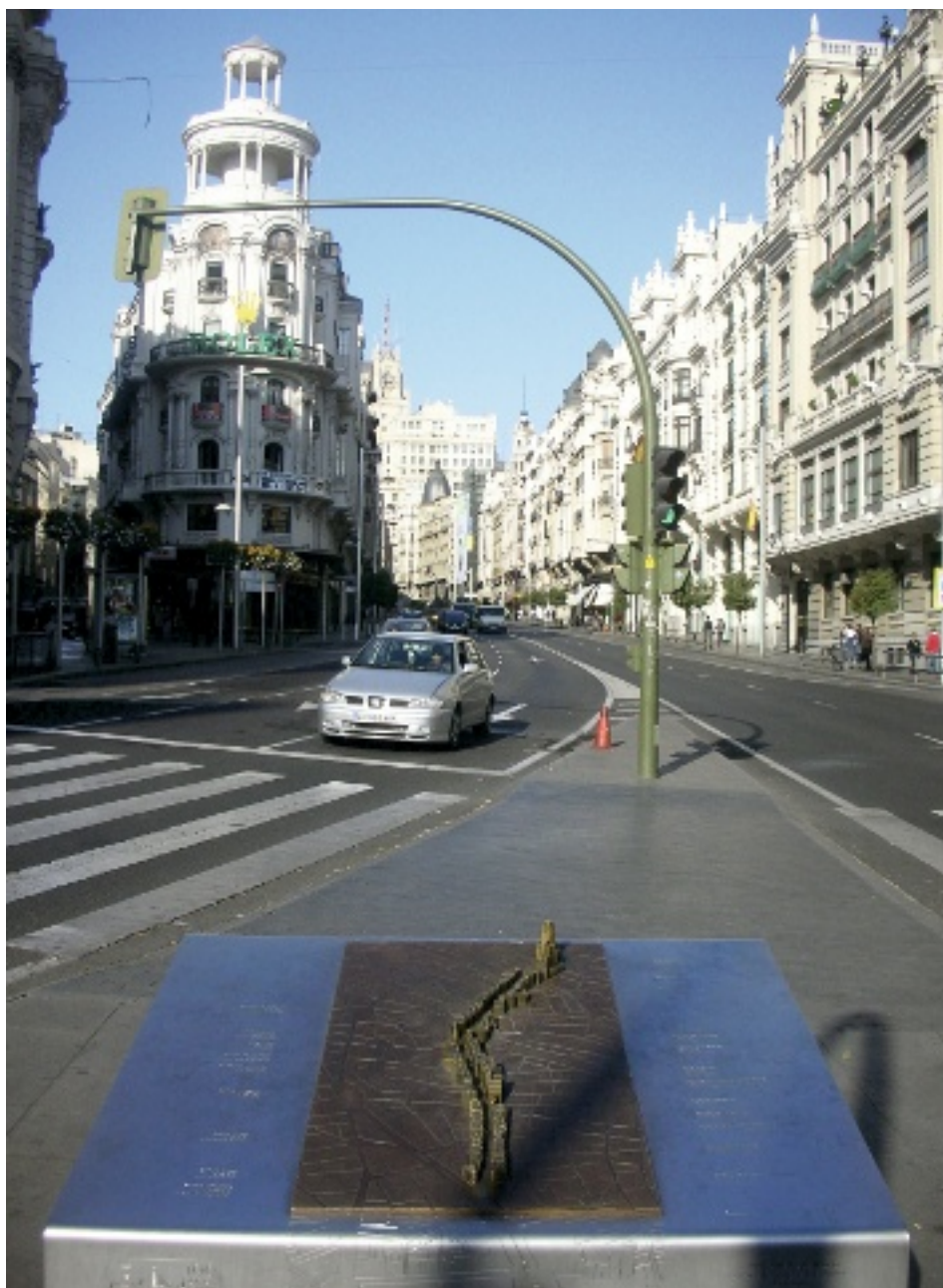
6. Maqueta de la Gran Vía en el sitio.