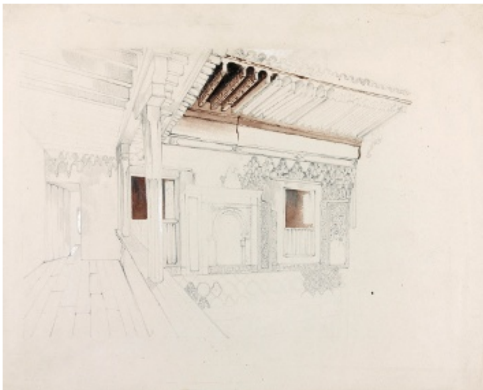
9. John F. Lewis's Patio de la Mezquita from its corridor , 1832 [Nowadays 'Patio del Cuarto Dorado']. Victoria and Albert Museum, London.