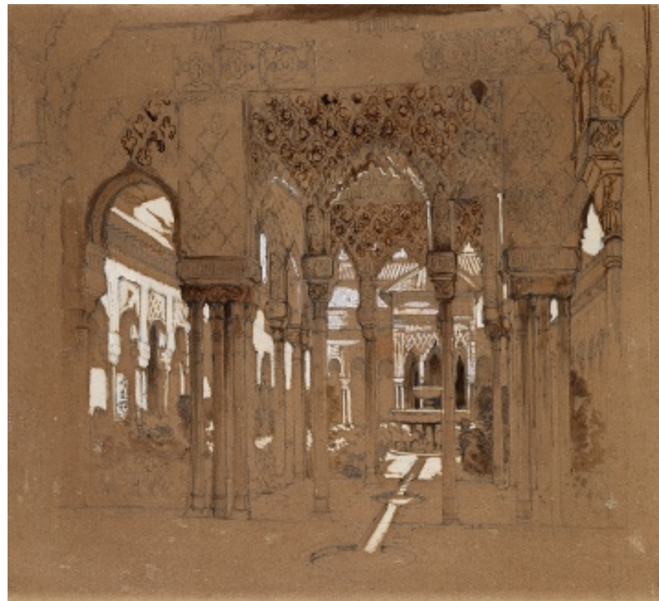
4. John F. Lewis's Patio de los Leones through its shrine , 1833. Ford Family Collection.