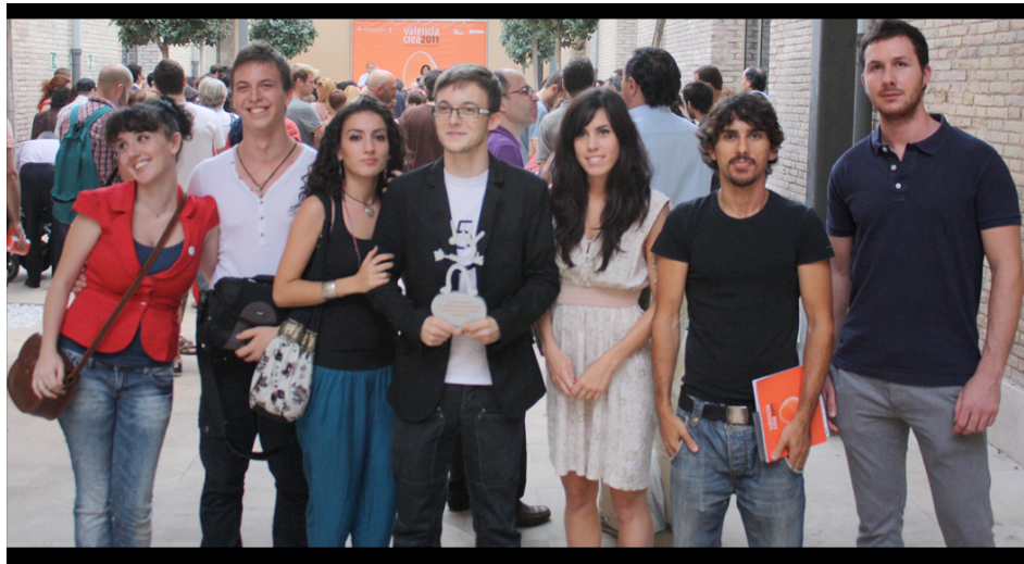
Fotografía del equipo en la entrega del premio Valencia Crea