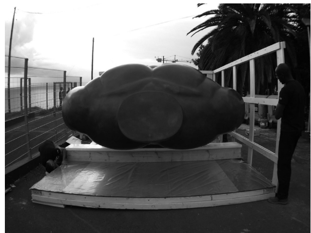
Figuras 3 y 4. Traslado y desembalaje de un busto de Botero a una nueva ubicación, Casa das Mudanças en Calheta (Madeira)