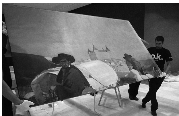
Figuras 1 y 2. Manipulación de la obra de Sorolla Castilla. La Fiesta del Pan.1913. Montaje de la Exposición Visión de España