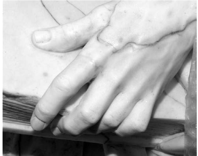
Figura 10. Detalle de la mano izquierda de San Vicente Ferrer. Tratamiento volumétrico del dedo índice tras la intervención.

El proceso de estucado se realizó mediante el uso de Modostuc con un poco de Acril 33 disuelto en agua desionizada al 3% en lagunas de pequeño tamaño y de poca profundidad. Para las lagunas de gran formato, se utilizó Álamo 70 .