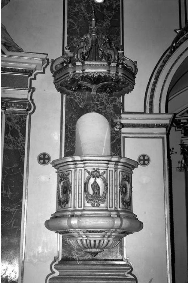
Figura 11. Estado inicial del púlpito.