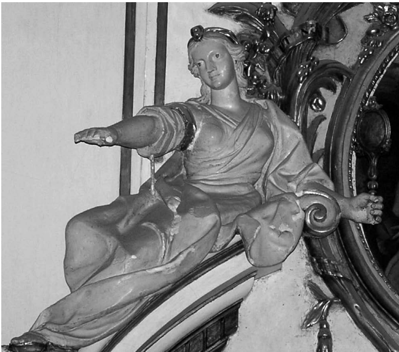
Figura 7. Detalle original de la alegoría de la Prudencia.

la pilastra izquierda que da entrada a la capilla de San José y que se halla horadada para su uso.