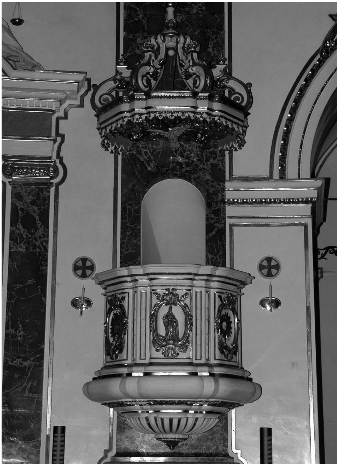
Figura 13. Estado final del púlpito.