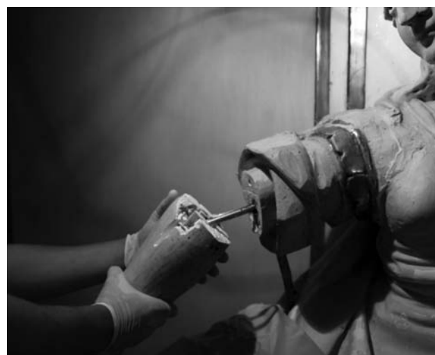
Figura 6. Detalle refuerzo estructural con pernos de acero inoxidable en la alegoría de la Prudencia.