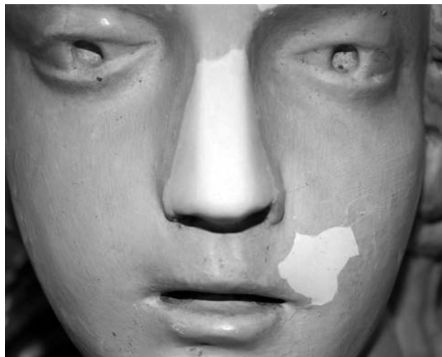
Figura 4. Detalle de reintegración de lagunas en la alegoría de la Prudencia.