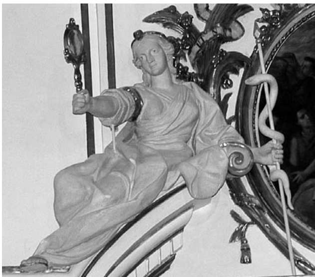
Figura 8. Detalle final de la alegoría de la Prudencia con rémora y brazo derecho en posición adecuada para coger el espejo.

año 36 del pasado siglo y, están localizadas en la zona de pliegue de los ropajes, en el libro, en el dedo índice de la mano izquierda, así como en la base de la pieza. Son abundantes también, la presencia de grietas y fisuras localizadas en las zonas de fractura de dichas lagunas.