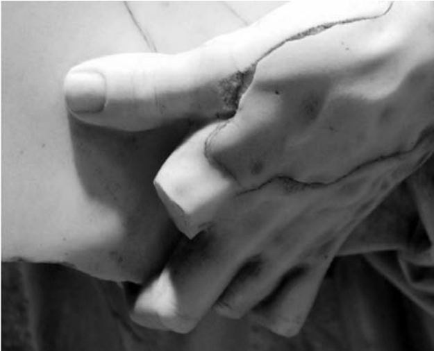
Figura 9. Detalle de la mano izquierda de San Vicente Ferrer. Mutilación del dedo índice. Antes de la intervención.