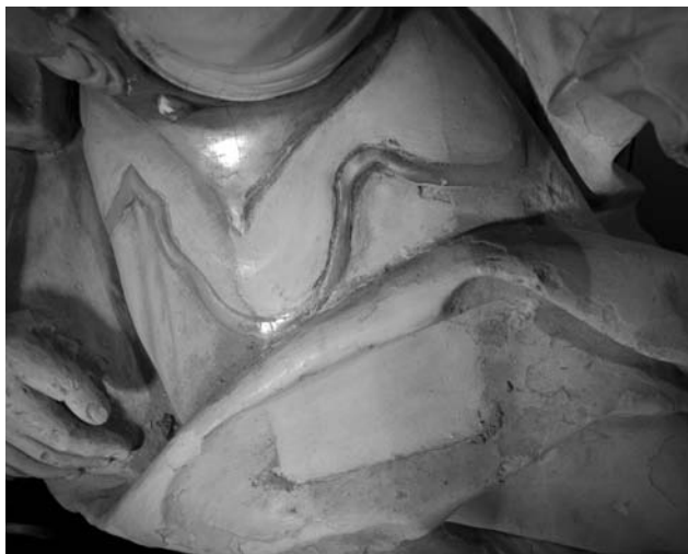
Figura 1. Detalle de limpieza mecánica en la alegoría de la Prudencia.