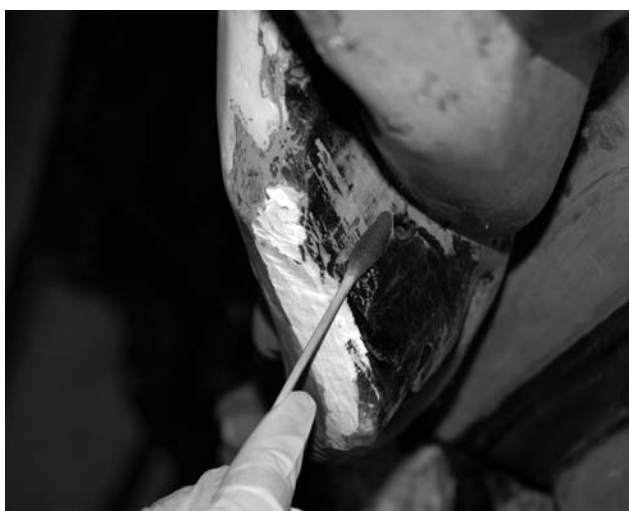
Figura 3. Detalle de limpieza química en la alegoría de la Prudencia.