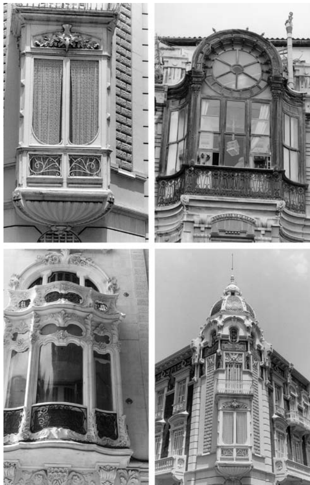
Figura 6. Los miradores en el Modernismo y el Eclecticismo

A esta primera y sencilla rejería la seguirá una lenta y progresiva evolución formal que conllevará una progresiva complejidad. Formas cada vez más elaboradas sustituirán las sencillas mallas