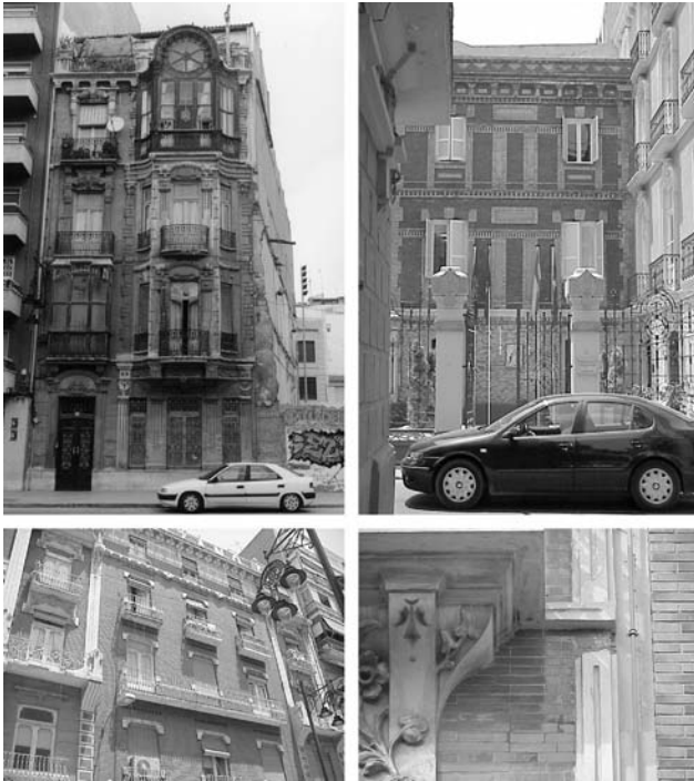
Figura 3. El ladrillo visto

Un recorrido por este entramado de elementos arquitectónico y de los materiales empleados en los edificios de la ciudad, presentaría los siguientes resultados: