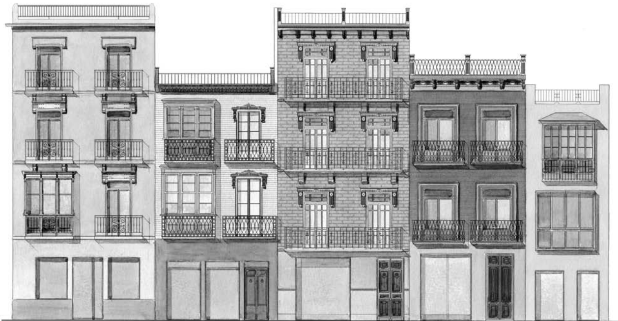
Figura 10. Propuesta cromática para la Plaza de San Francisco