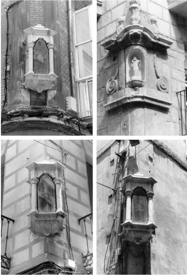
Figura 1. El centro histórico de Cartagena: Detalle

ha profundizado en el análisis y comprensión del empleo de los materiales en cada época histórica, en aras a determinar las características formales y cromáticas de cada tipología concreta.