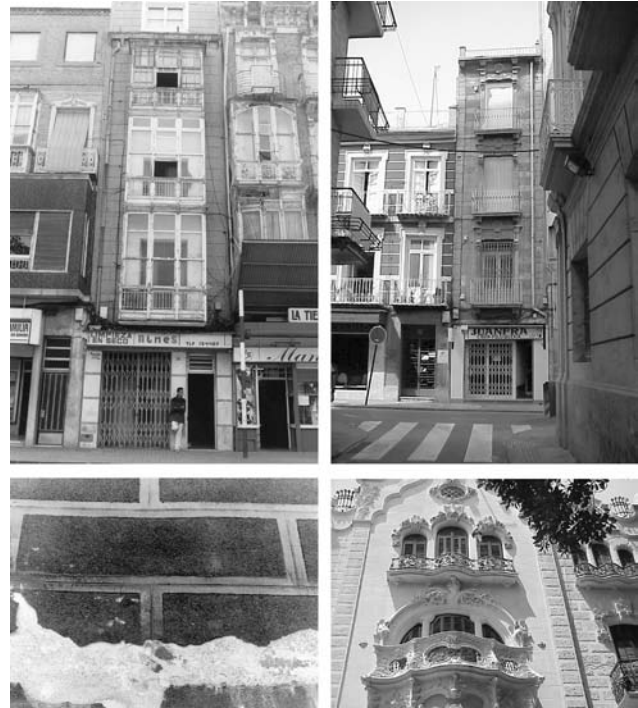
Figura 2. Revoco y color en Cartagena: La sillería simulada

La base es la determinación de las tipologías originales que, estructuradas según criterios de sucesión cronológica, serían las mostradas en la tabla 1.