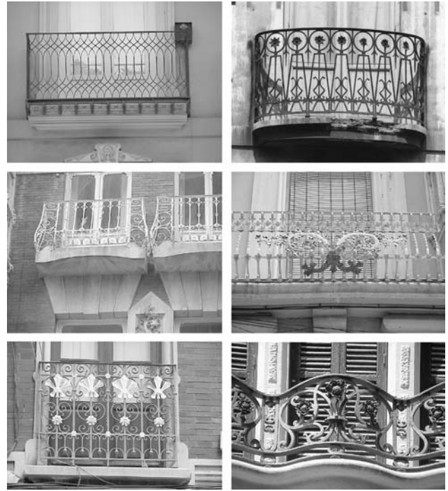
Figura 4. Las cerrajerías históricas

Sin embargo, Cartagena presenta dos singularidades dignas de atención: En primer lugar el recurso a los fingidos de sillería realizados con el propio revoco de fachada y reforzados visualmente con el uso del color; y en segundo lugar, y en mayor medida, con el recurso al ladrillo visto en la fachada. Especialmente este último es singular de Cartagena, ya que si bien es usual en los edificios eclécticos, en el caso de Cartagena su uso se extiende incluso a