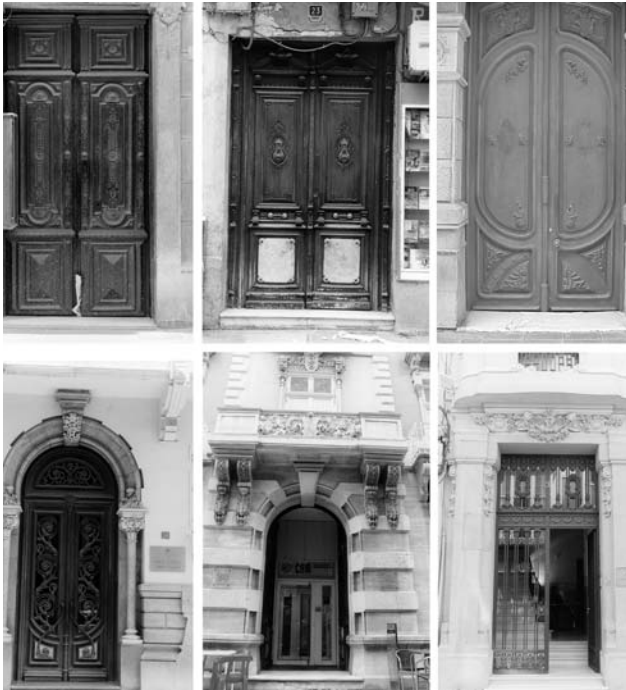
Figura 7. Las carpinterías de madera

“Constituyen, sin duda, el elemento más significativo y caracterizador del paisaje urbano cartagenero, llegando a constituir su imagen de marca. No se trata, sin embargo, de un elemento de presencia habitual desde antiguo, sino que empezó a desempeñar un claro papel protagonista a partir de la reconstrucción urbanística tras la destrucción ocasionada por la represión de la revolución cantonal. Según testimonios de viajeros de época, antes del Cantón, lo que más llamaba la atención del paisaje urbano de Cartagena era su abundancia de rejas a, consecuencia de las necesidades defensivas a las que se veía expuesta la ciudad” (López y Chacón, 2000: 34), ver figura 5.