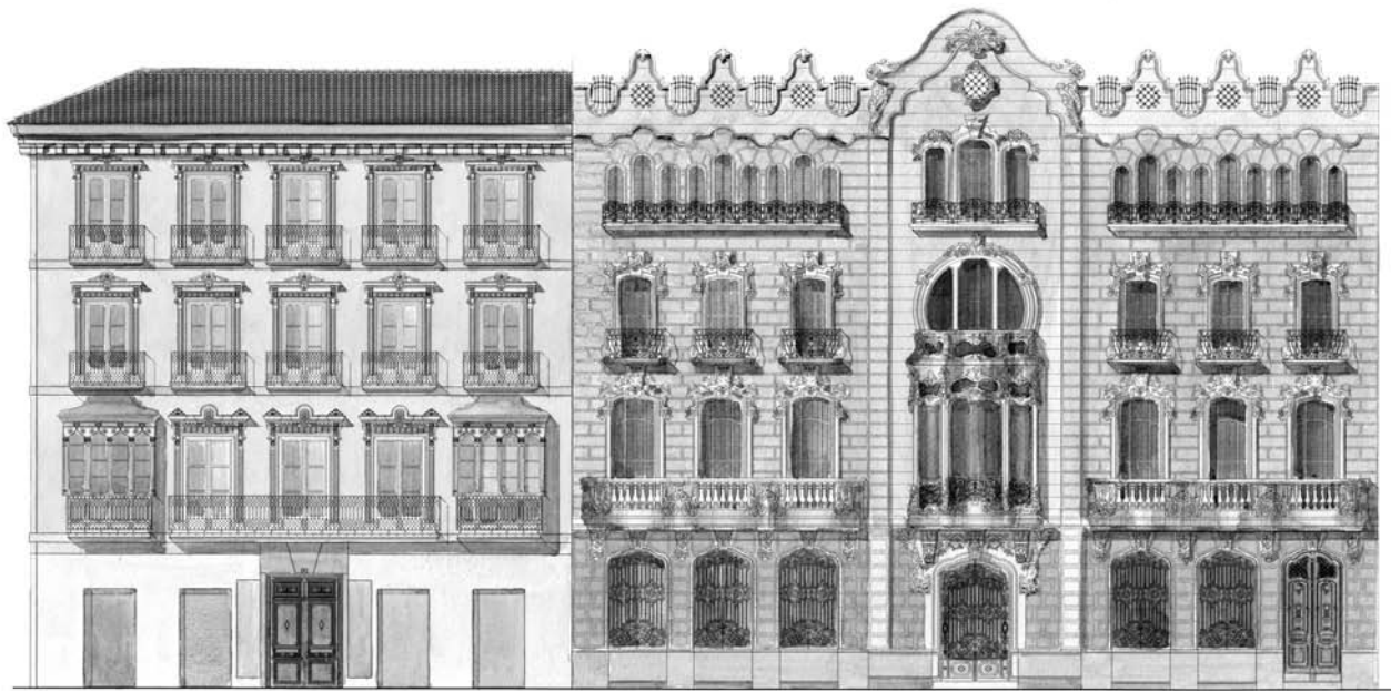
Figura 9. Propuesta cromática para la Plaza de San Francisco