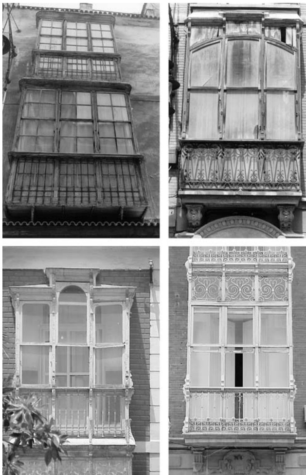
Figura 5. Los miradores en el Clasicismo arquitectónico

Inicialmente, las rejerías más antiguas, herederas directas de las rejas medievales, apenas estaban constituidas por mallas de elementos metálicos formando enrejados sencillos. Este tipo de elementos debió ser muy numeroso en la ciudad, tal como describen diferentes escritores que visitaron la ciudad.