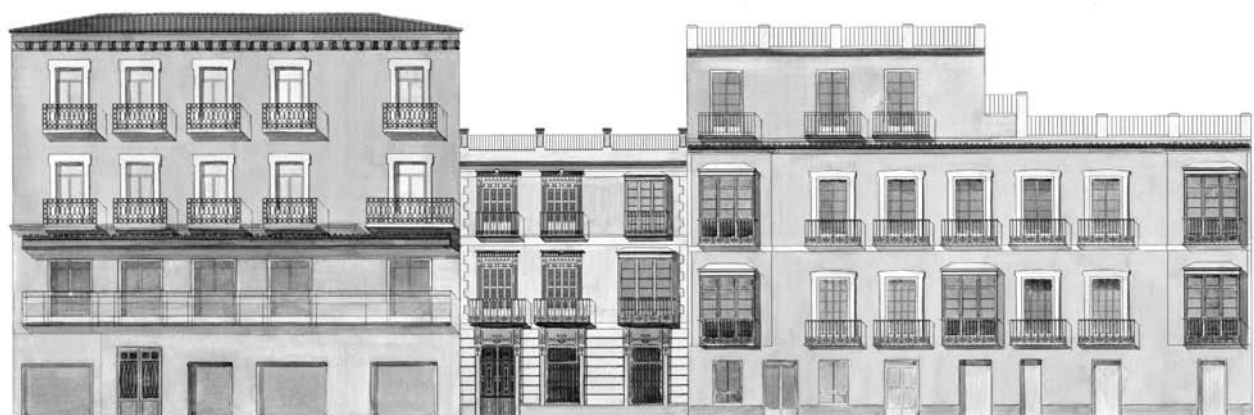
Figura 11. Propuesta cromática para la Plaza de San Francisco