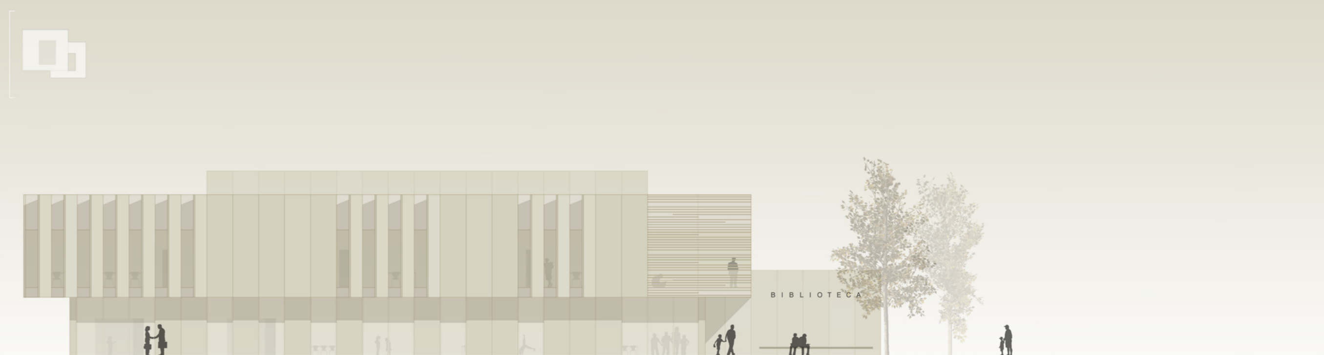
ALZADO OESTE 1/200