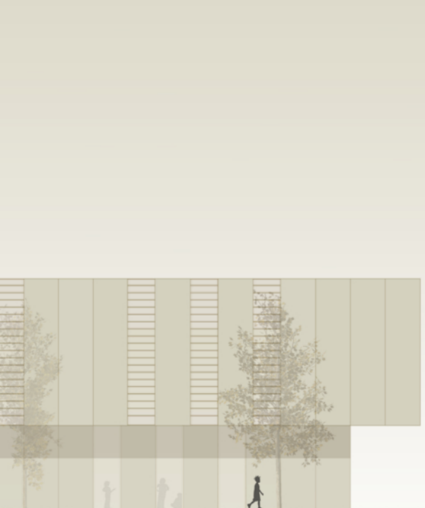
ALZADO NORTE 1/200