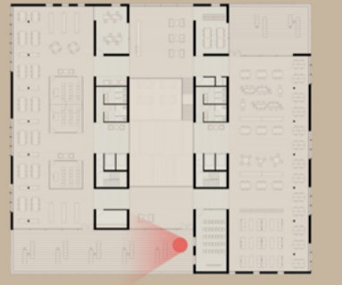
VISTA INTERIOR DEL ACCESO