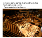
la música como centro de atención principal música en punto central _mercado de la zona de la ciudad