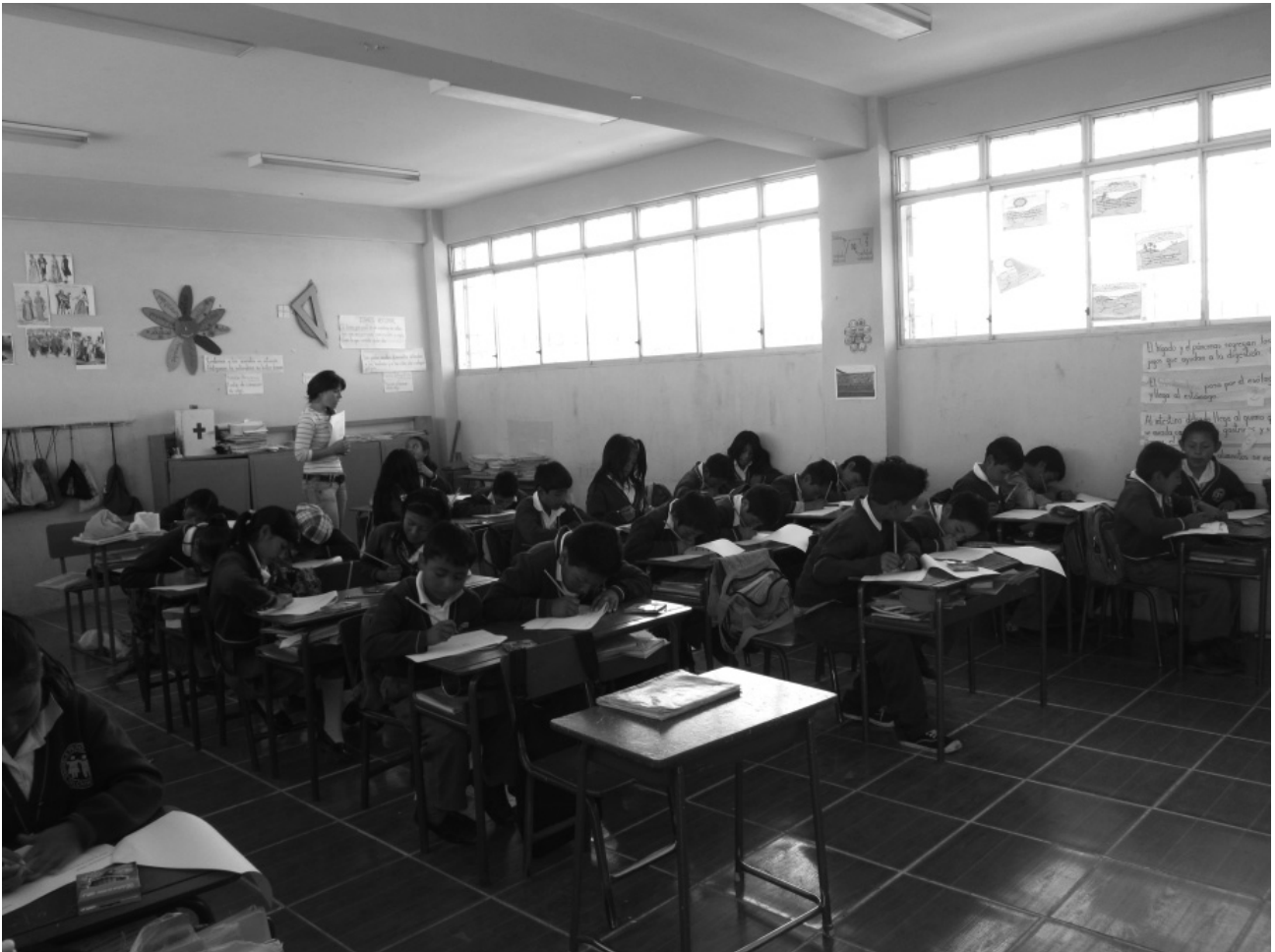
Figura 1. Curso sobre conservación de bienes culturales aplicado a niños de 6º curso de la Escuela Pedro Moncayo (Malchingui)