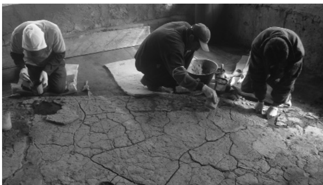
Figura 4. Parte del personal de mantenimiento del Parque Arqueológico de Cochasqui durante el curso de capacitación para la restauración de las superficies ccerámicas