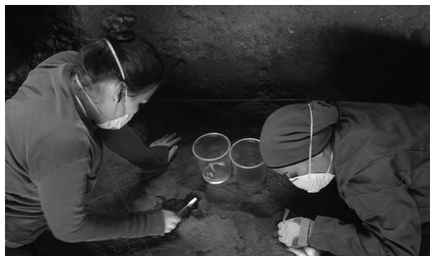
Figura 5. Alumnas de la Universidad Tecnológica Equinoccial realizando acciones de limpieza biológica

las estructuras encontradas en la Pirámide nº13 (tipo de material, su manufactura e hipotéticos usos que haber tenido), así como de las patologías que presentaban antes de la intervención conservativa y las aparecidas posteriormente (debido a la incursión de animales salvajes). En cuanto a las prácticas, los alumnos pudieron conocer y experimentar los diferentes tipos de limpieza más afines a las plataformas y los agentes patógenos que en ellas se encontraban así como las metodologías empleadas para la recuperación formal de las estructuras. Posteriormente al seminario, los alumnos más