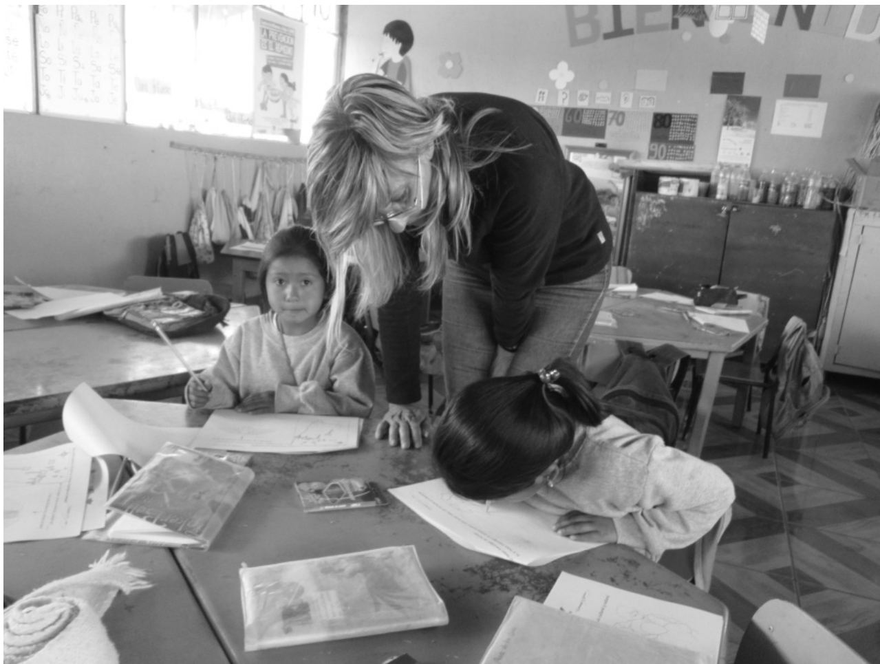
Figura 3. Niños de segundo curso realizando los ejercicios correspondientes al Bloque II. Escuela Pedro Moncayo (Malchingui)