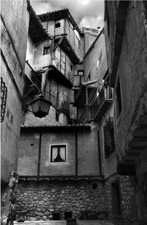
Figura 3. Vista del revestimiento de yeso rojo en las fachadas.

- La madera, que es básicamente el pino. Antiguamente estos montes estaban poblados de sabinas, encinas y carrascas, que dan una madera mucho más densa y oscura, mientras que el pino es mucho más claro.