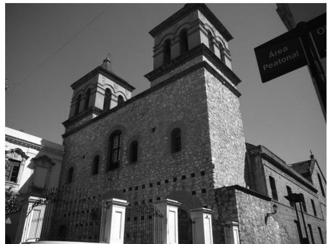
Figura 4. Iglesia de la Compañía de Jesús. Siglo XVII

Las imponderables limitaciones de materiales, y más aun la limitación de la mano de obra especializada, quedan expresadas en la tecnología y en la basta arquitectura del siglo XVII. El sistema constructivo utilizado desde la colonia hasta nuestros días, es a