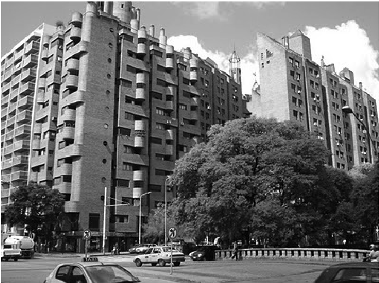
Figura 5. Imagen urbana de la ciudad de Córdoba

A partir de este enfoque el presente trabajo refuerza y revalida la hipótesis de que el color ambiental constituye un rasgo de identidad de un estilo propio y particular de apropiación determinado, y por lo tanto podría operar como una efectiva herramienta de recuperación y puesta en valor del patrimonio. Referirse al color ambiental es referirse a la identidad que fue estratificada en la memoria de sus monumentos, calles y lugares, por ello la necesidad de preservar y garantizar la adecuada transformación de estos tonos cromáticos.