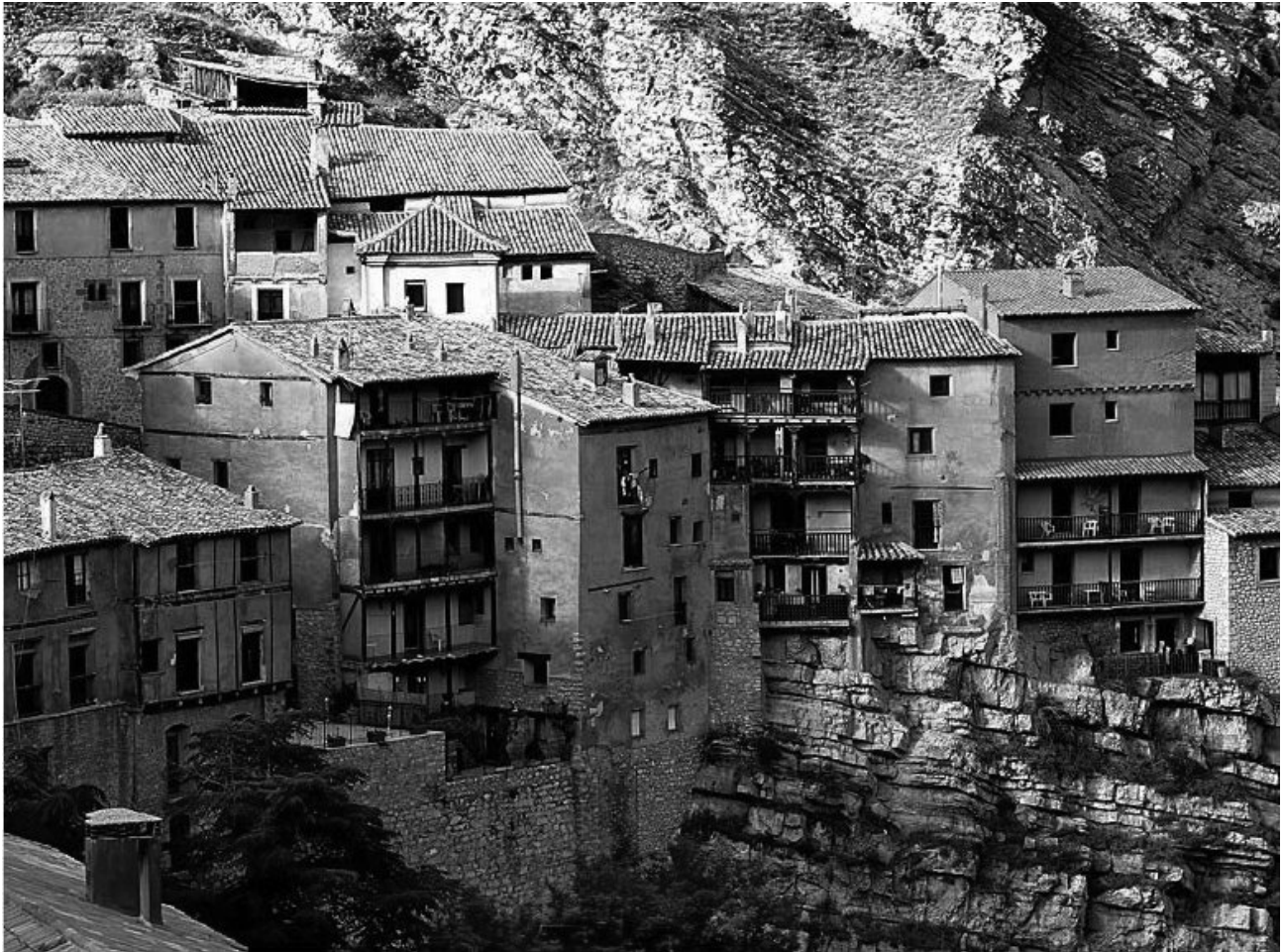
Figura 2. Vista general de Albarracín..

La disponibilidad de la piedra y la abundancia de madera en los macizos del entorno, explican el empleo de estos dos materiales en la construcción y permiten comprender la sencillez, el pragmatismo, la homogeneidad y el equilibrio para resolver diferentes tipologías como arquitectura militar (defensas, muralla, Portal de Molina, etc.), arquitectura civil (Ayuntamiento, Palacio Episcopal, etc), arquitectura residencial y arquitectura religiosa (Catedral, Iglesia de Santa María) con el mismo material y acabado.