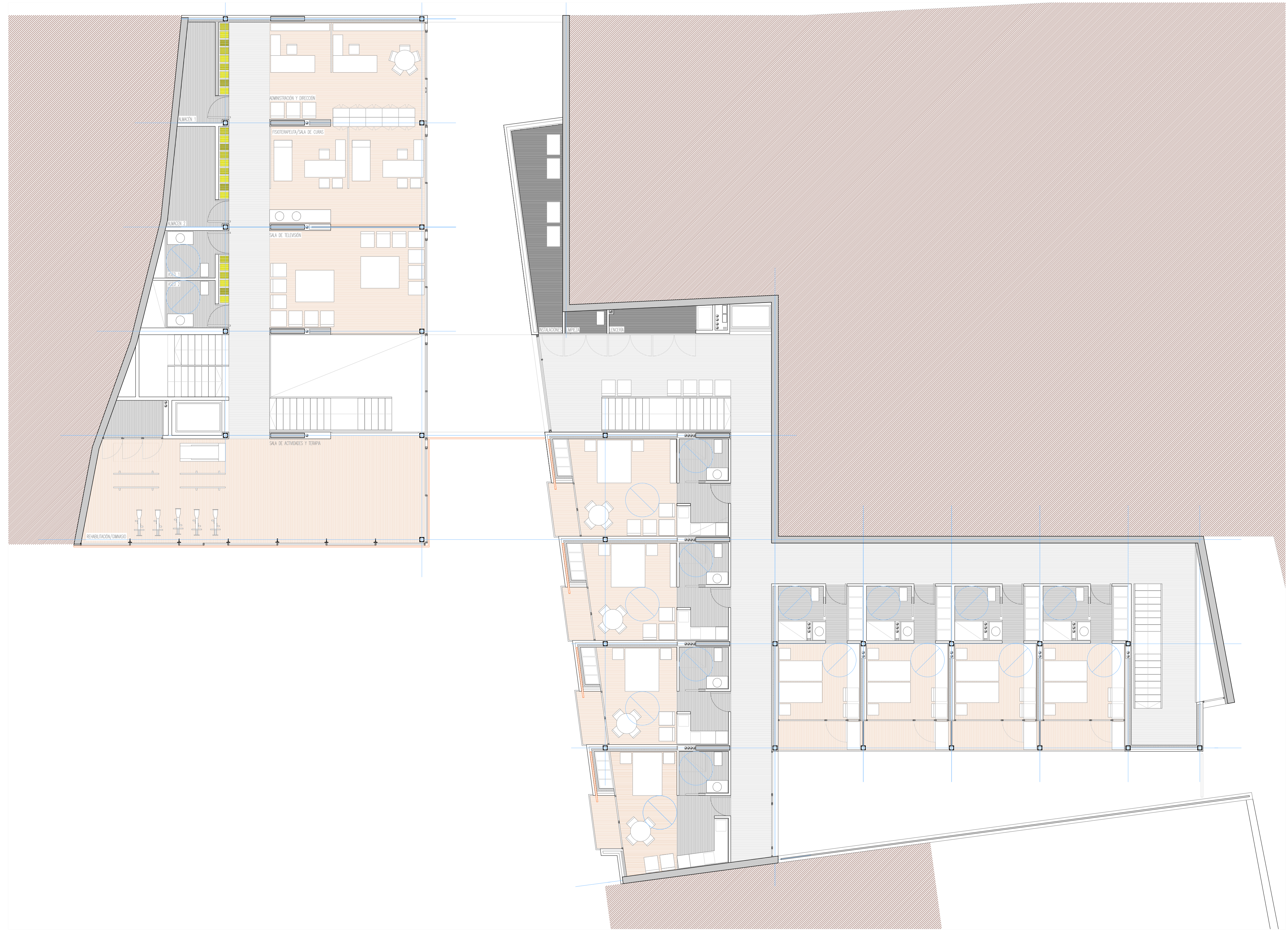
PLANTA PRIMERA escala 1/100

RESIDENCIA Y CENTRO DE DÍA EN CARPESA ADRIAN HERNANDEZ BALLESTEROS - TALLER 5