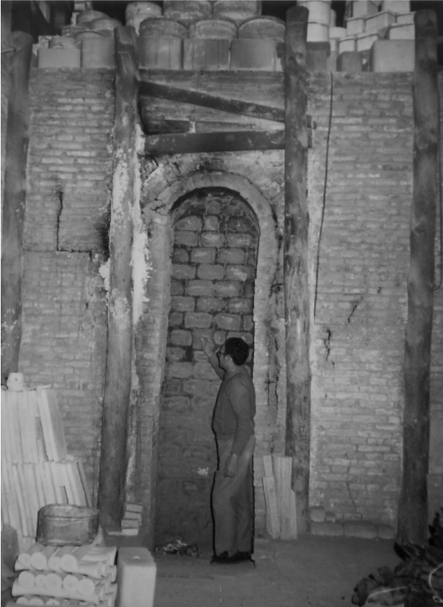
Figura 9. Operario enformando

elementos que al contacto con el calor se oxidan, tomando una coloración característica según predomine un elemento químico u otro. Los azulejos cerámicos del siglo XVIII exhiben unos trazos gruesos y colores puros, siendo principalmente amarillos, naranjas, azules, verdes, marrones y blancos. Es alrededor del año 1880, a principios del XIX, cuando esa pureza de los colores se ven modificadas con la introducción del color rosa.