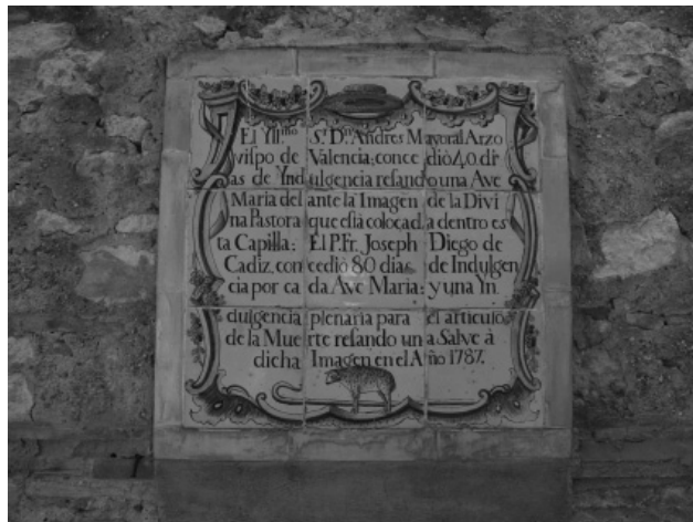
Figura 4. Museo Benlliure. Patio Interior

El marco arquitectónico donde se ubican este tipo de obras es otra peculiaridad relevante de los paneles cerámicos. En la zona de la Comunidad Valenciana y durante el siglo XVIII se encuentran los paneles cerámicos colocados en el muro con un borde simple mixtilíneo bordeando el panel. Ya en el siglo XIX se introducen