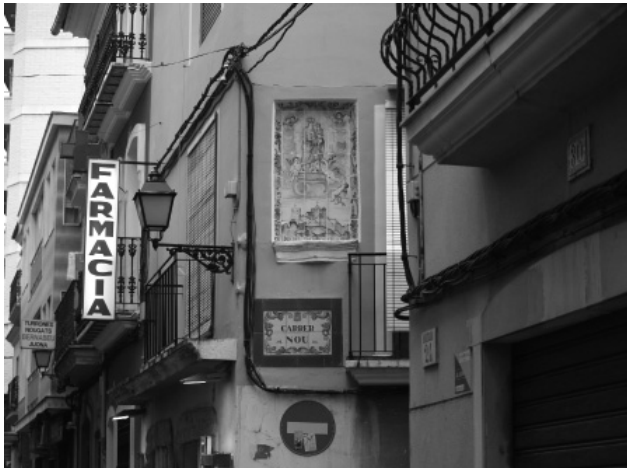
Figura 1. Carrer Nou. Cullera