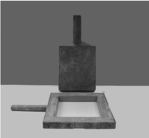
Figura 7. Bastidor de madera para realizar azulejos. Museo de Cerámica de Manises