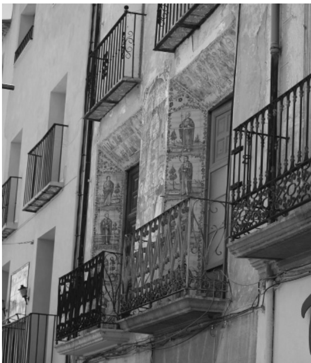
Figura 3. Calle mayor. Cocentaina

La azulejería religiosa es uno de los signos externos más característicos de la religiosidad popular de las comarcas valencianas, y popular por cuanto a su colocación y culto, mayormente, emana de la voluntad del pueblo, siendo éste el verdadero artífice de las fiestas que tradicionalmente han girado en torno a los paneles cerámicos devocionales de las calles. Fenómeno similar se observa en comarcas andaluzas, con cerámicas salidas de las fábricas sevillanas, y con extraordinaria significación en numerosos municipios de Portugal.