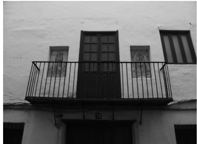
Figura 2. Calle de la Sequia. Cullera

en origen, un deseo por agradecer o hacer presente al santo de su comarca o jurisdicción, tomándose posteriormente por costumbre la celebración anual.