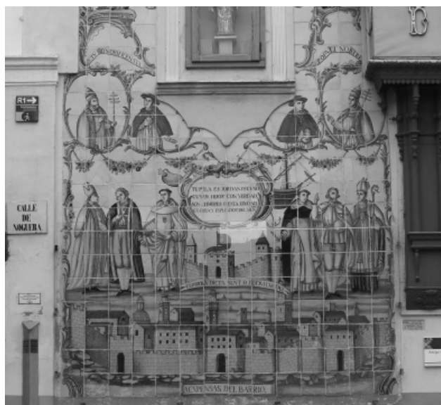
Figura 5. Calle Noguera. Xativa

La selección de la materia prima para la elaboración de los azulejos valencianos se confeccionaba a partir de distintas arcillas aprovechando el barro de Manises y de los pueblos limítrofes. De igual modo se utilizaban otras tierras secas mezcladas en proporción, bien trituradas pasando el resultado por tamices, colocando la arcilla en polvo en depósitos o balsas al aire libre. Posteriormente se le añadía agua hasta conseguir una mezcla homogénea y líquida 6 . La arcilla después circulaba a otro depósito denominado balsa de sedimentación, donde se iba decantando durante unos tres meses,