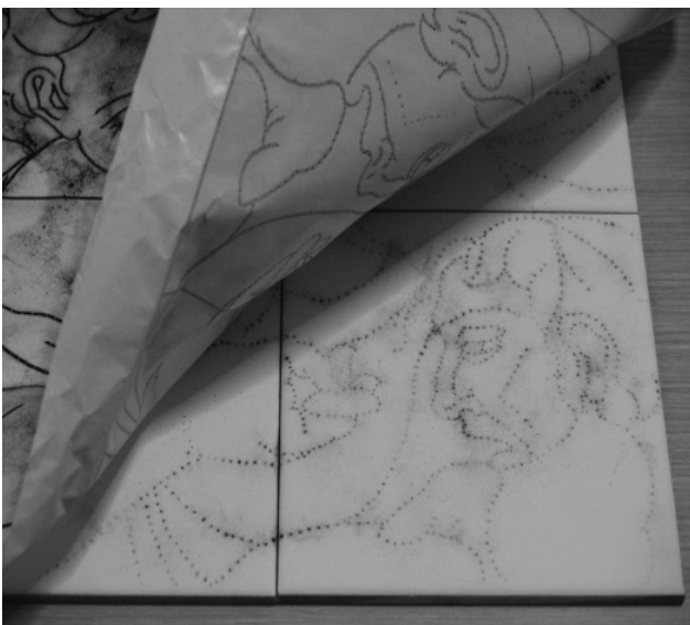
Figura 8. Estarcido

endureciéndose al mismo tiempo que se eliminaba el agua de la parte superior. Este proceso es indispensable en la formación de cualquier arcilla, pues se selecciona un polvo perfecto desechando las piedras y arenas gruesas.