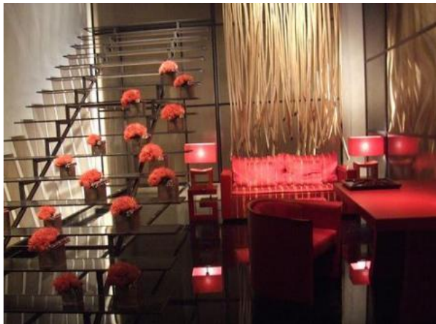
Ambiente/decoración despacho Natsumi

Realmente esta localización no ha de ser un restaurante de verdad, se puede grabar en una habitación con aspecto de despacho y toques intimistas. Se puede poner un biombo y algunos elementos de decoración japoneses. El ambiente se creará con el sonido de fondo, en el que se escuchará el barullo típico de la cocina de un restaurante. Además cuando Paquito entre en escena, siempre llevará puesto un delantal, incluso puede entrar con una bandeja de servir, o un plato.