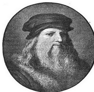
Figura III: Leonardo Da Vinci

Viene con el nombre del famoso Leonardo Da Vinci, artista, pensador e investigador italiano que vivió entre los siglos XV y XVI. Su genio polifacético le convirtió en el modelo perfecto del hombre del Renacimiento. Su curiosidad insaciable y su aguda capacidad de observación le llevaron a interesarse por todas las ramas del saber y por todos los aspectos de la vida.