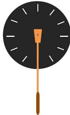
Cara de atrás del disco donde irá sujeto el mango