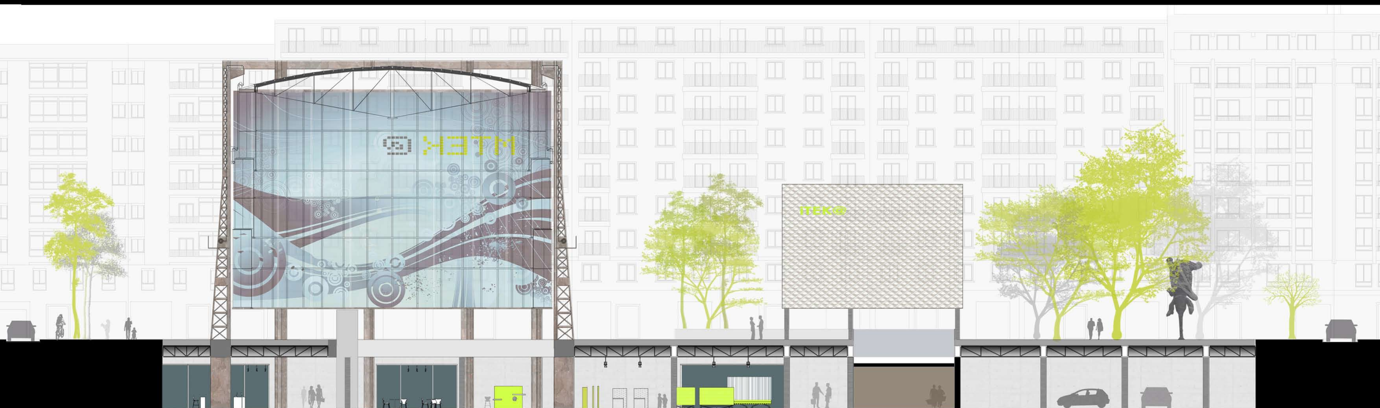
SECCIÓN TRANSVERSAL BB' E:1/200