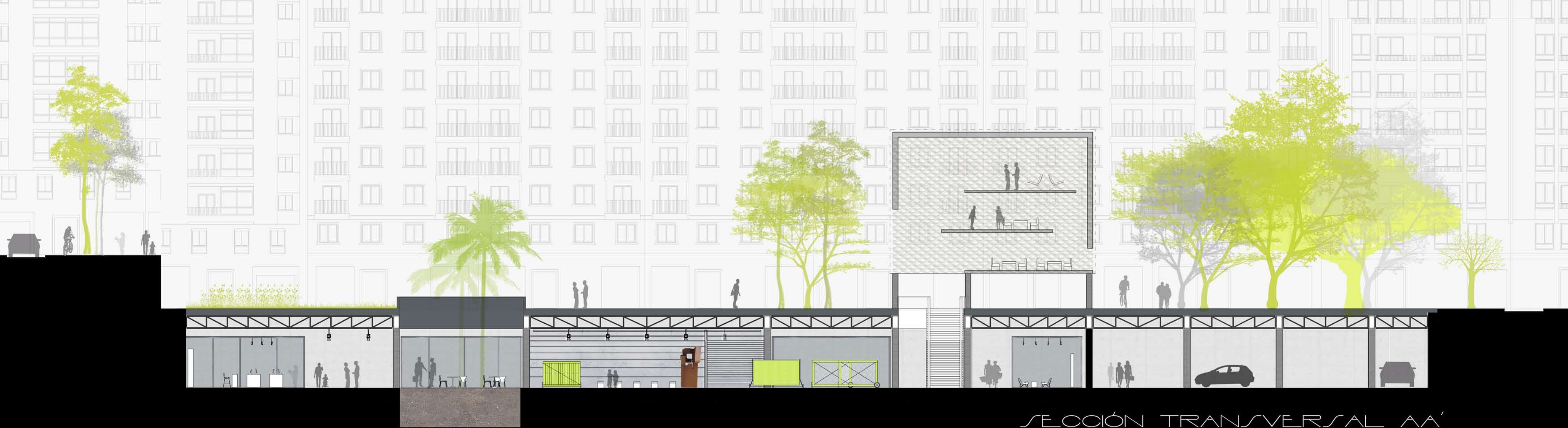
SECCIÓN TRANSVERSAL AA' E:1/200