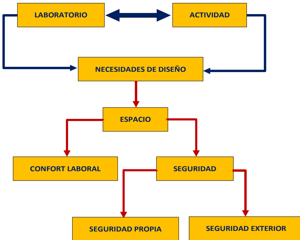
Figura 3: Variables más relevantes en el diseño del espacio de un laboratorio.

Una última etapa en el diseño de un laboratorio debe de tener en consideración, de forma conjunta, tanto la ubicación como las necesidades espaciales para mobiliario y equipamiento, además de los requerimientos espaciales y de seguridad en el trabajo. Por ello, el replanteamiento inicial del problema de diseño, ahora que se conocen las necesidades de cada etapa, puede ayudar a contemplar el laboratorio como una entidad global y poder dar forma final al diseño.