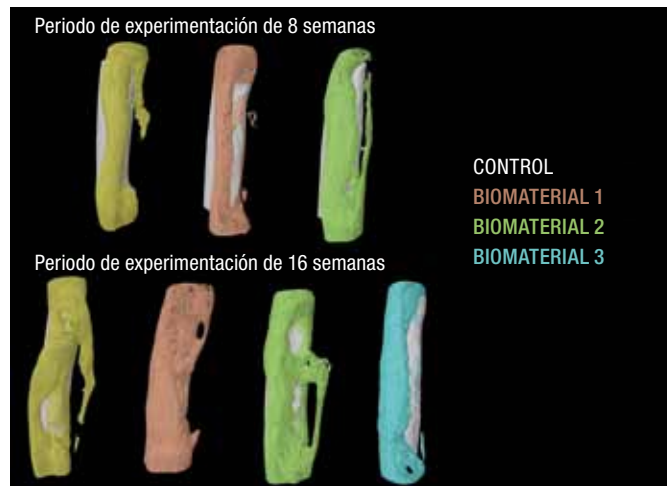
Figura 2. Reconstrucciones 3D de una muestra por cada uno de los grupos de estudio.

en el proyecto, bajo el estrecho control y supervisión de la empresa líder del proyecto, TEQUIR, S.L. Estas fases fueron: