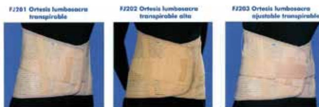
Figura 8. Imágenes de las fajas que aparecen en el antiguo catálogo.

Gracias al Diseño Orientado Por las Personas, EMO ha conseguido introducir la voz de sus clientes en sus diseños, empatizando con ellos y respondiendo a sus necesidades funcionales y emocionales. El incremento en ventas de los productos que se han desarrollado bajo esta metodología respalda su validez. La historia de amor está garantizada.