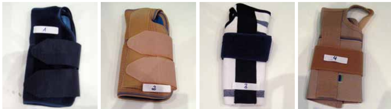
Figura 2. Muestra de muñequeras no deportivas utilizadas en el estudio.