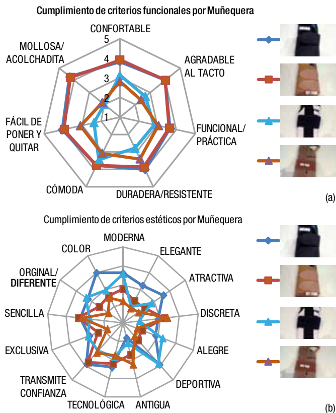
Figura 4. Cumplimiento de los criterios funcionales (a) y emocionales (b) de las muñequeras de estudio.

Si una muñequera no es comfortable, los usuarios no se la comprarán. Para conseguir esta percepción se debe utilizar