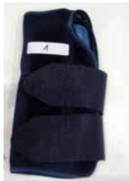
Figura 5. Muñequera favorita.

“El azul parece más deportivo y el color carne más ortopédico” “Debe actualizarse y modernizarse. Gris me gusta y mejor para lavar” “Azul, morado o negro. Carne no” “Azul marino por ser más discreto y no dar sensación de enfermo. También colores vivos”