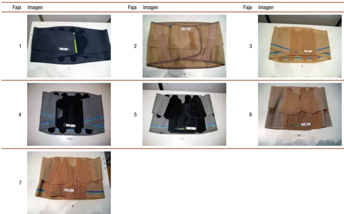
Figura 3. Muestra de fajas lumbosacras utilizadas en el estudio.