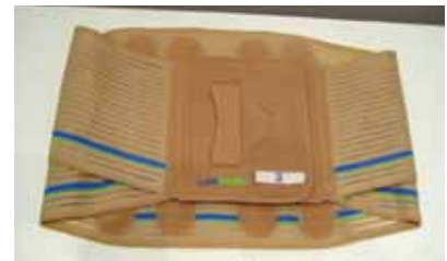
Figura 7. Faja favorita.

La faja 3, que es de color carne y con cierre único, cumple mejor con los criterios de color y facilidad de poner y quitar, que son, a su vez, los que explican en mayor medida la intención de comprar una ortesis lumbosacra (Figura 7).