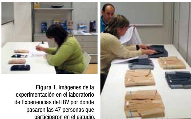
Figura 1. Imágenes de la experimentación en el laboratorio de Experiencias del IBV por donde pasaron las 47 personas que participaron en el estudio.