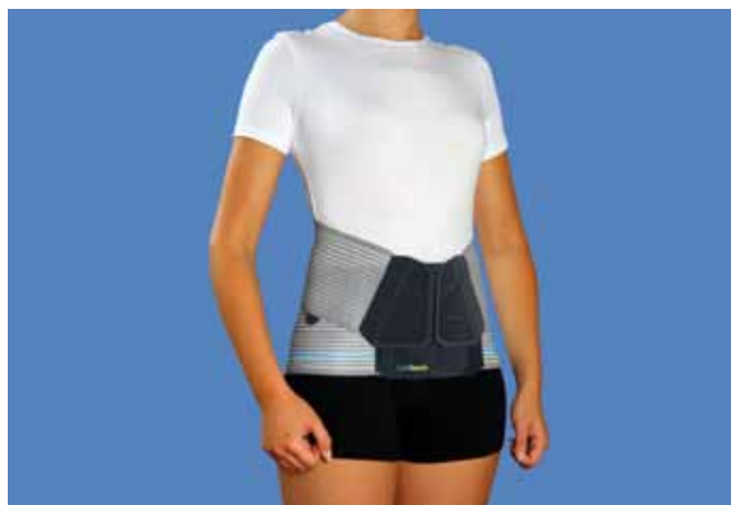
Figura 9. Imágenes de las fajas que aparecen en el nuevo catálogo.