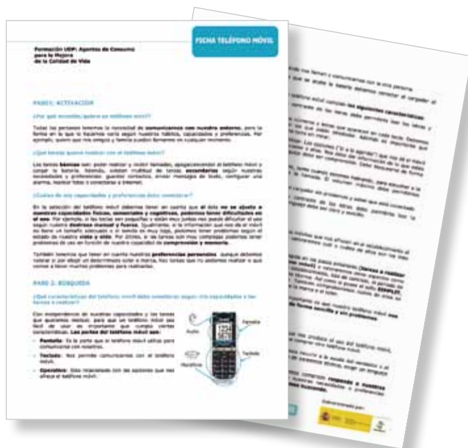
Figura 3. Ejemplo ficha informativa teléfono móvil.