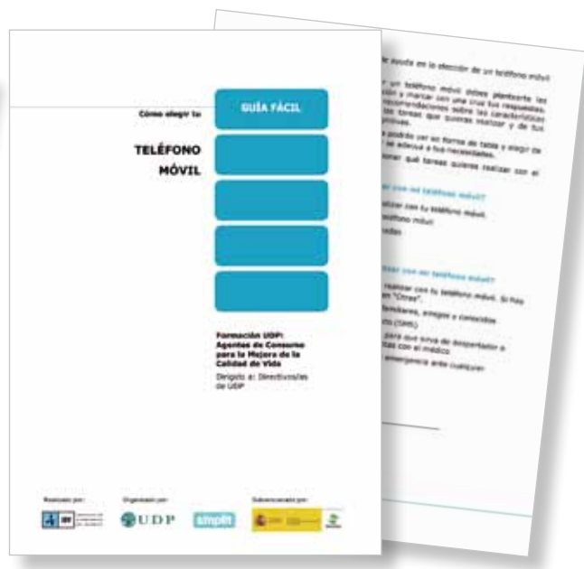
Figura 4. Ejemplo guía fácil teléfono móvil (portada y primera fase).

haya elegido el teléfono móvil más adecuado para el usuario en la etapa anterior, hay que comprobar si realmente es el producto que se está buscando. Para ello, se debe comprobar que puede realizar todas las tareas de forma sencilla, que se ajusta a sus preferencias, etc. Si no lo es, se puede repetir el proceso por si se ha cometido algún error o volver a la tienda para preguntar al dependiente si puede resolver los problemas que se hayan presentado o devolver el teléfono si no cumple las necesidades del cliente.